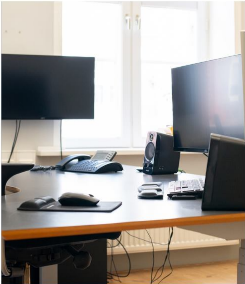
Endnu fremstår kontoret tomt...