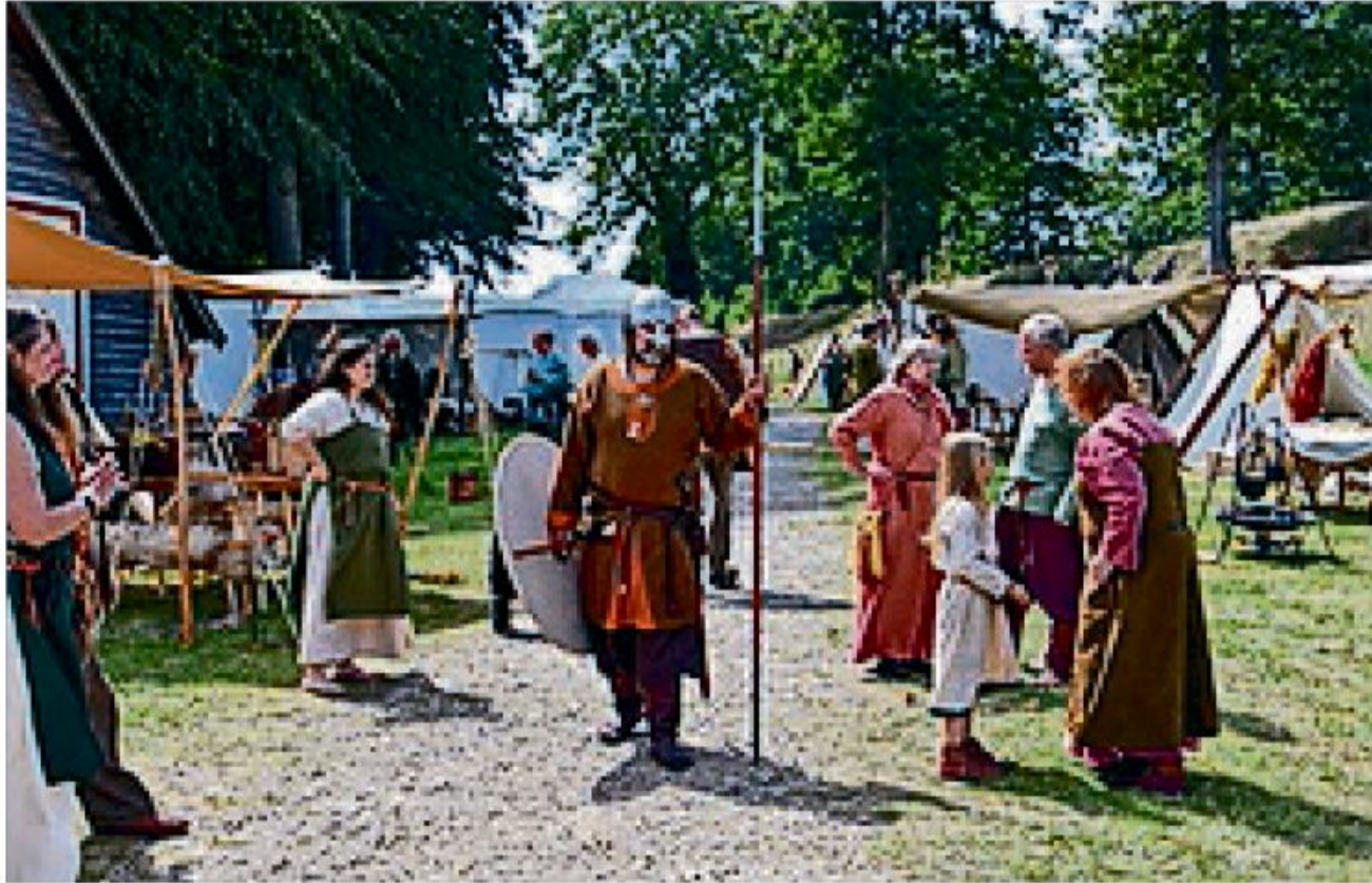
Die Wikingerguppe Opinn Skjold hat schon früher am Danewerk ihr Heerlager veranstaltet, und auch eine Welterbefeier gab es dort schon. Diesmal gibt es erstmals beides im Doppelpack.