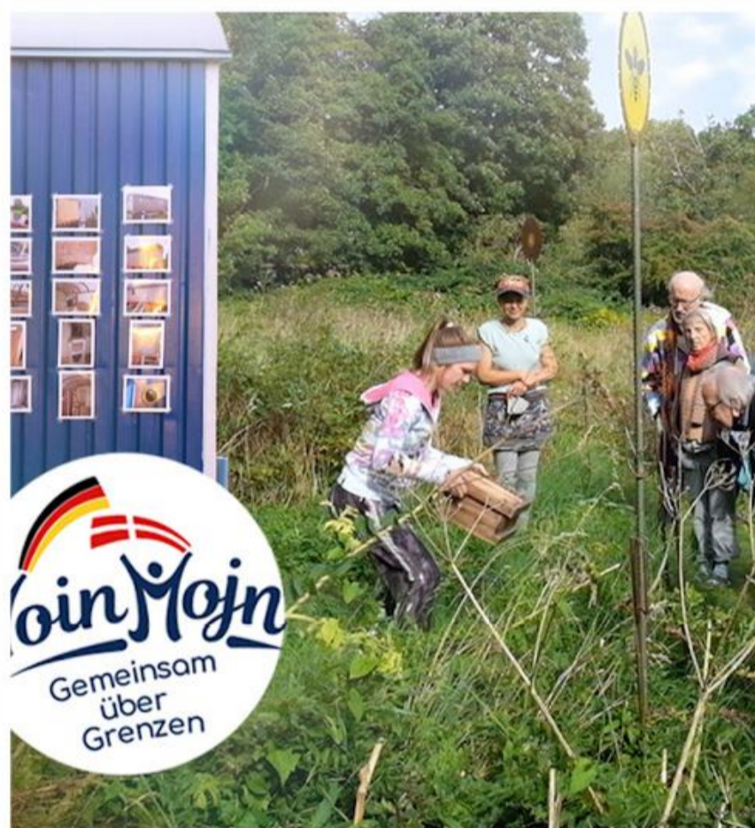
Bunnies Ranch præsenterer sig selv og området i morgen, fredag.