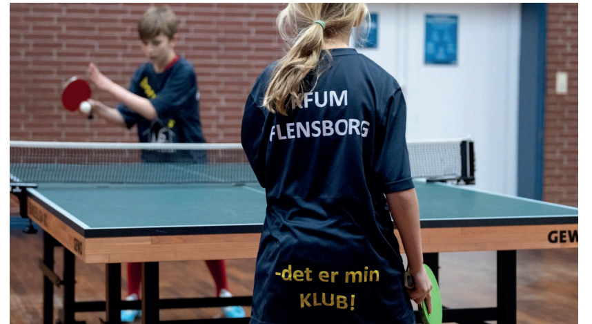
-det er min KLUB!