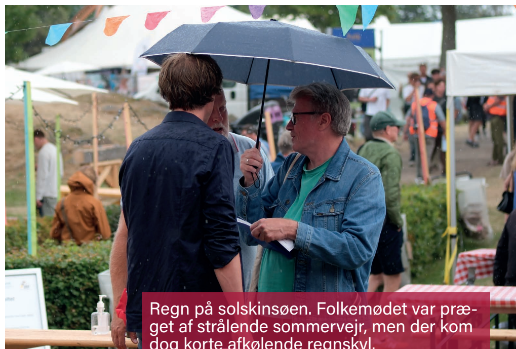
Regn på solskinsøen. Folkemødet var præget af strålende sommervej, men der kom dog korte afkølede regnskyl.