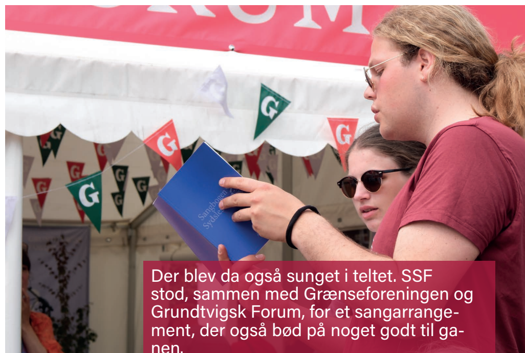
Der blev da også sunget i teltet. SSF stod, sammen med Grænseforeningen og Grundtvigsk Forum, for et sangarrangement, der også bød på noget godt til gaven.