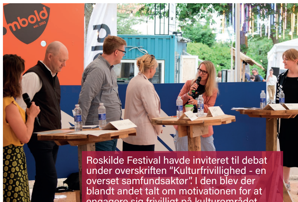
Roskilde Festival havde inviteret til debat under overskriften "Kulturfrivillighed - en overset samfundsaktør". I den blev der blandt andet talt om motivationen for at engagere sig frivilligt på kulturområdet.