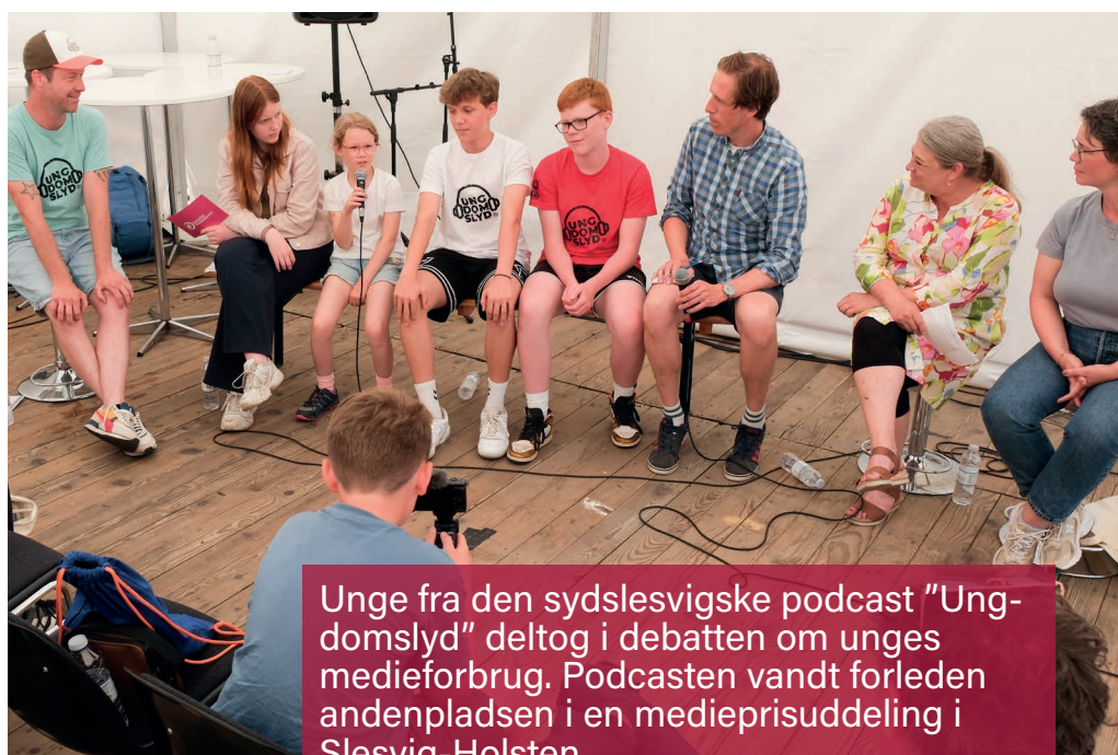
Unge fra den sydslesvigske podcast "Ungdomslyd" deltog i debatten om unges medieforbrug. Podcasten vandt forleden andenpladsen i en medieprisuddeling i Slesvig-Holsten.

Frivillighed var - foruden bæredygtighed, grøn omstilling, trivsel og unge - et af de helt store emner til Folkemødet. Noget der gentagne gange blev nævnt i debatten, var nødvendigheden for at sætte ord på frivilligheden. Anerkendelse, fællesskab og følelsen af at være med til at skabe noget, er de motiverende faktorer. Ønsker man altså at få flere til at yde en frivillig indsats, skal der tages højde for disse punkter. Samtidig skal man - frem for at have fokus på en eventuel negativ udvikling - fremhæve de mange positive sider. Og så skidt står det slet ikke til. I Danmark er omkring 40 procent af befolkningen frivillig engageret. Det tal har været meget stabilt, men måden, hvordan man er frivillig på, har forandret sig. Men når først man har taget afsked med tanken om, at man forbliver i én forening og én bestyrelse hele livet, åbner udviklingen op for gode muligheder. Det er i hvertfald noget, man i foreningerne bør se på.