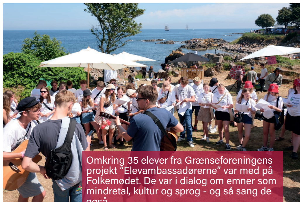
Omkring 35 elever fra Grænseforeningens projekt "Elevambassadørerne" var med på Folkemødet. De var i dialog om emner som mindretal, kultur og sprog - og så sang de også.