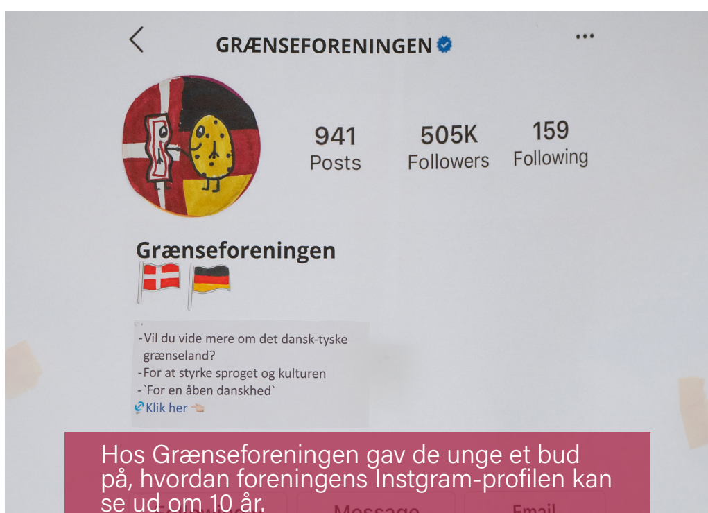
Hos Grænseforeningen gav de unge et bud på, hvordan foreningens Instagram-profilen kan se ud om 10 år.