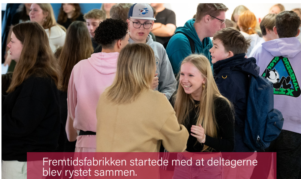
Fremtidsfabrikken startede med at deltagerne blev rystet sammen.

Fremtidsfabrikken Arrangementet blev holdt for fjerde gang. Det er en udløber af Sydslesvigkonferencen, som hørte under Det Sydslesvigske Samråd. Konferencen blev gennemført nogle gange, men mødte kritik, fordi det typisk var "Tordenskjolds soldater", der mødte op til konferencerne. Der kom derfor et forslag om, at gøre konferencen til en ungdomskonference. Ud fra det opstod Fremtidsfabrikken, som SdU står for at gennemføre.