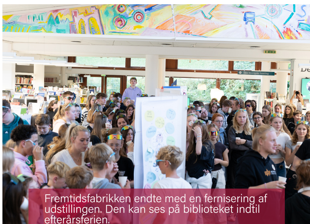
Fremtidsfabrikken endte med en fernisering af udstillingen. Den kan ses på biblioteket indtil efterårferien.