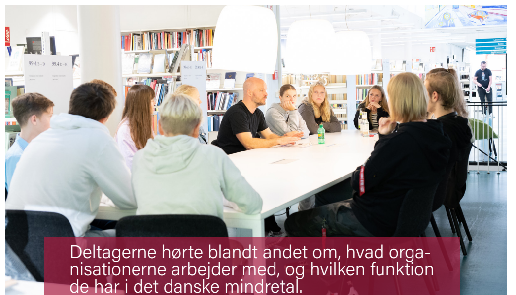
Deltagerne hørte blandt andet om, hvad organisationerne arbejder med, og hvilken funktion de har i det danske mindretal.