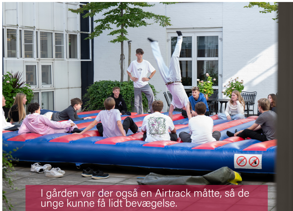
I gården var der også en Airtrack måtte, så de unge kunne få lidt bevægelse.