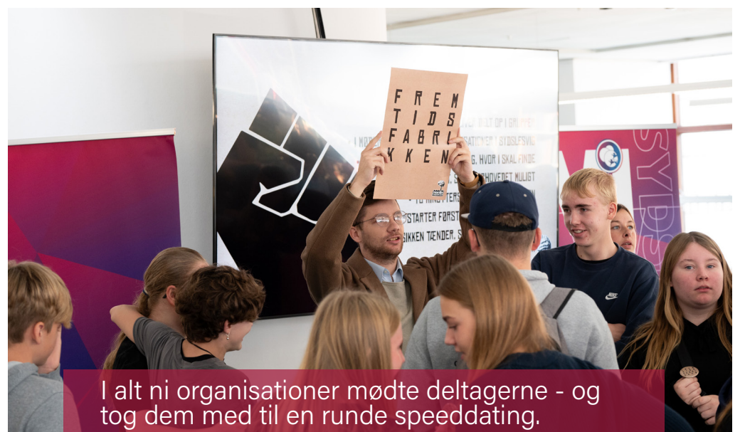
I alt ni organisationer mødte deltagerne - og tog dem med til en runde speeddating.