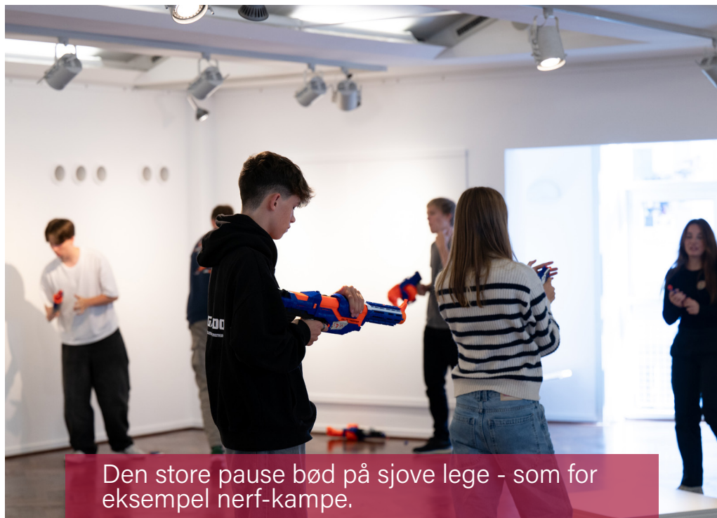
Den store pause bød på sjove lege - som for eksempel nerf-kampe.