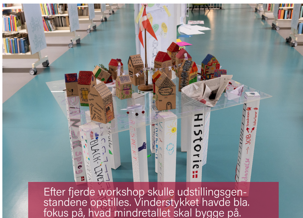
Efter fjerde workshop skulle udstillingsgenstandene opstilles. Vinderstykket havde bla. fokus på, hvad mindretallet skal bygge på.