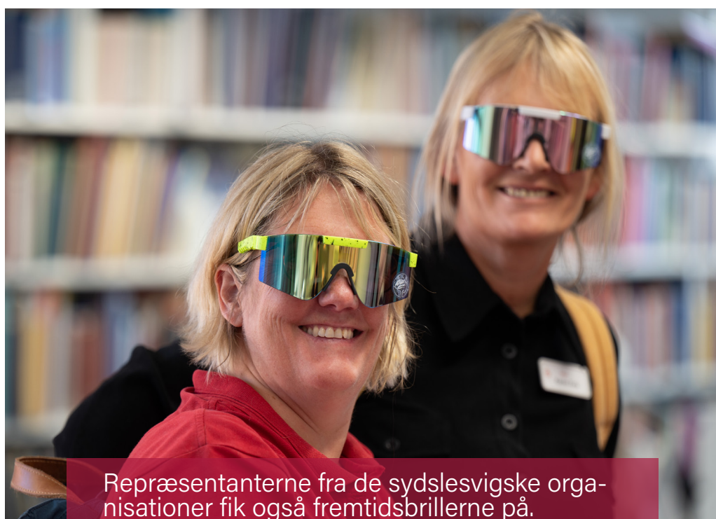
Repræsentanterne fra de sydslesvigske organisationer fik også fremtidsbrillerne på.