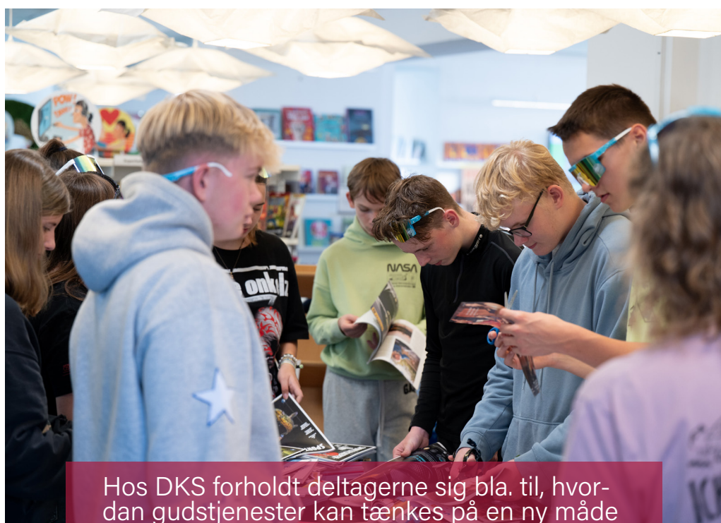
Hos DKS forholdt deltagerne sig bla. til, hvordan gudstjenester kan tænkes på en ny måde