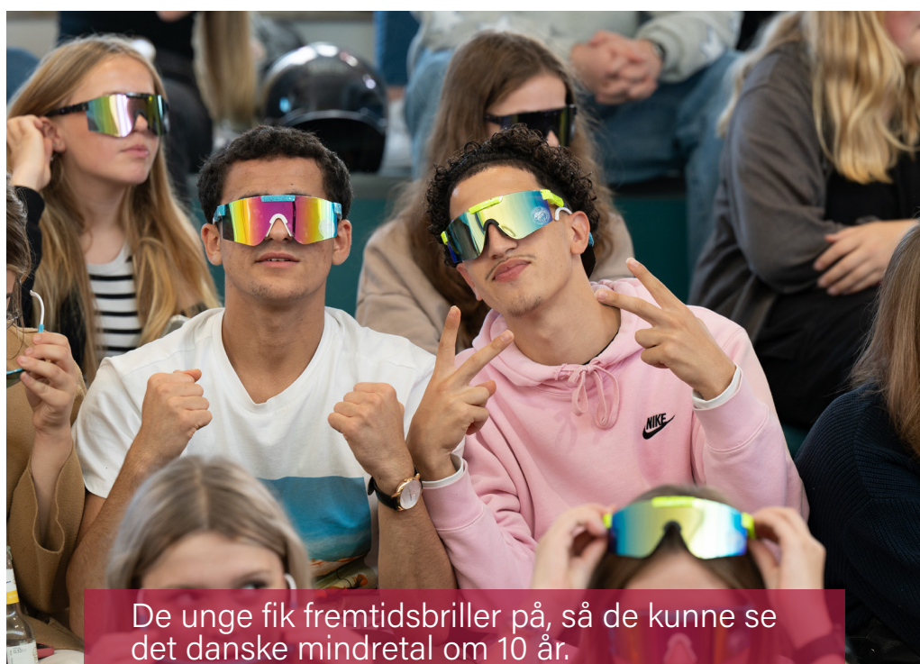
De unge fik fremtidsbriller på, så de kunne se det danske mindretal om 10 år.