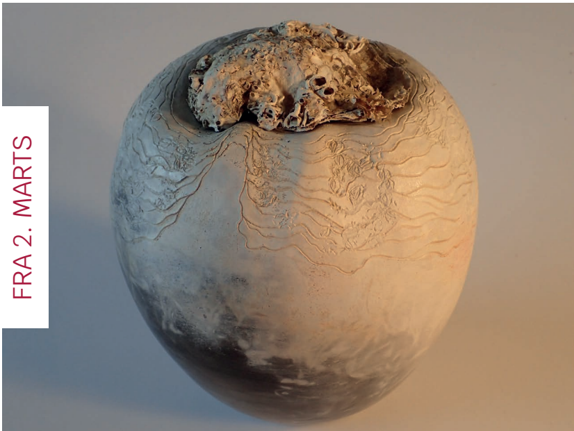
FRA 2. MARTS