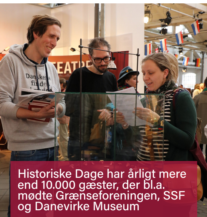
Historiske Dage har årligt mere end 10.000 gæster, der bl.a. mødte Grænseforeningen, SSF og Danevirke Museum