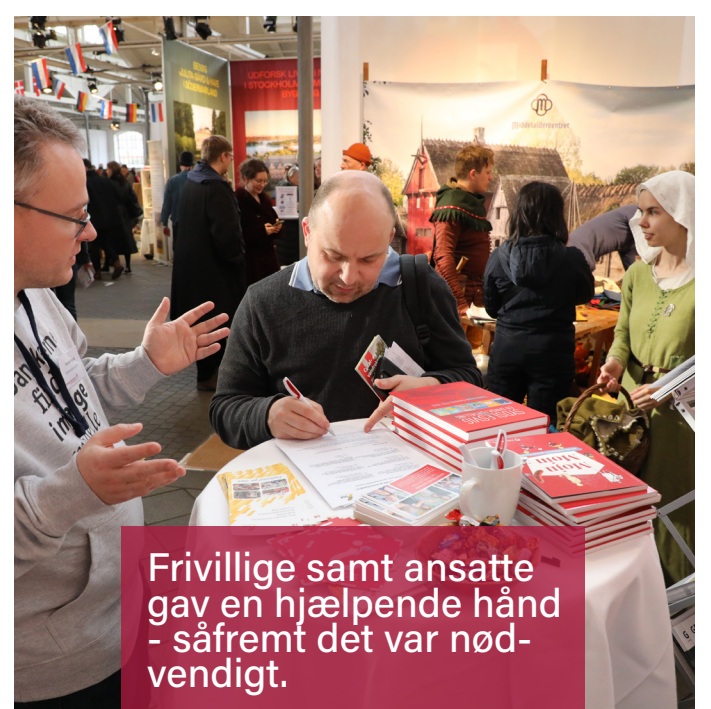
Frivillige samt ansatte gav en hjælpende hånd - såfremt det var nødvendigt.