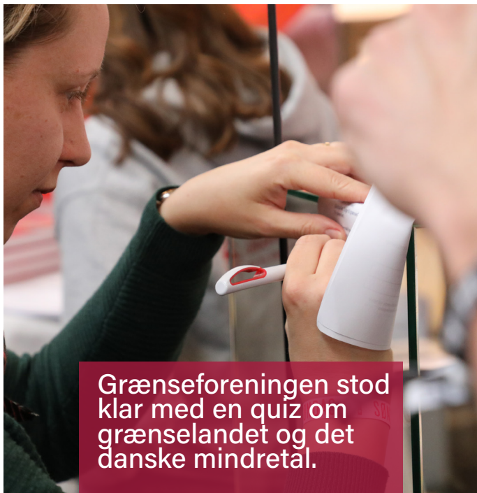
Grænseforeningen stod klar med en quiz om grænselandet og det danske mindretal.