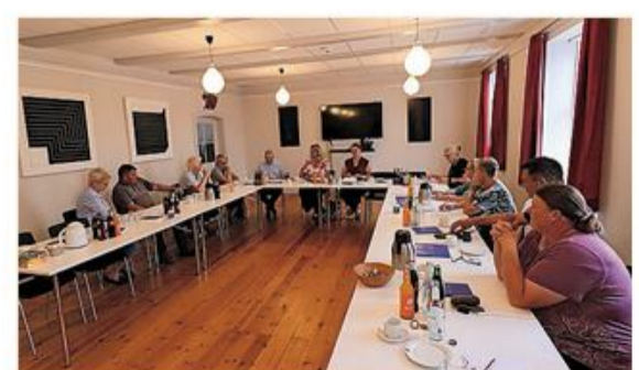
Ejdersted Amt bekræftede torsdag aften ønsket om at gå sammen med SSF Husum Amt i Amt Sydvest.