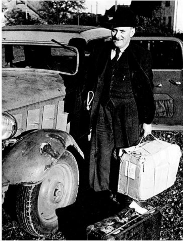
Bogbilerne var særligt vigtige i mellemkrigstiden for at udbrede dansk sprog, kultur og historie til mindretalsdanskere uden for Flensborg.