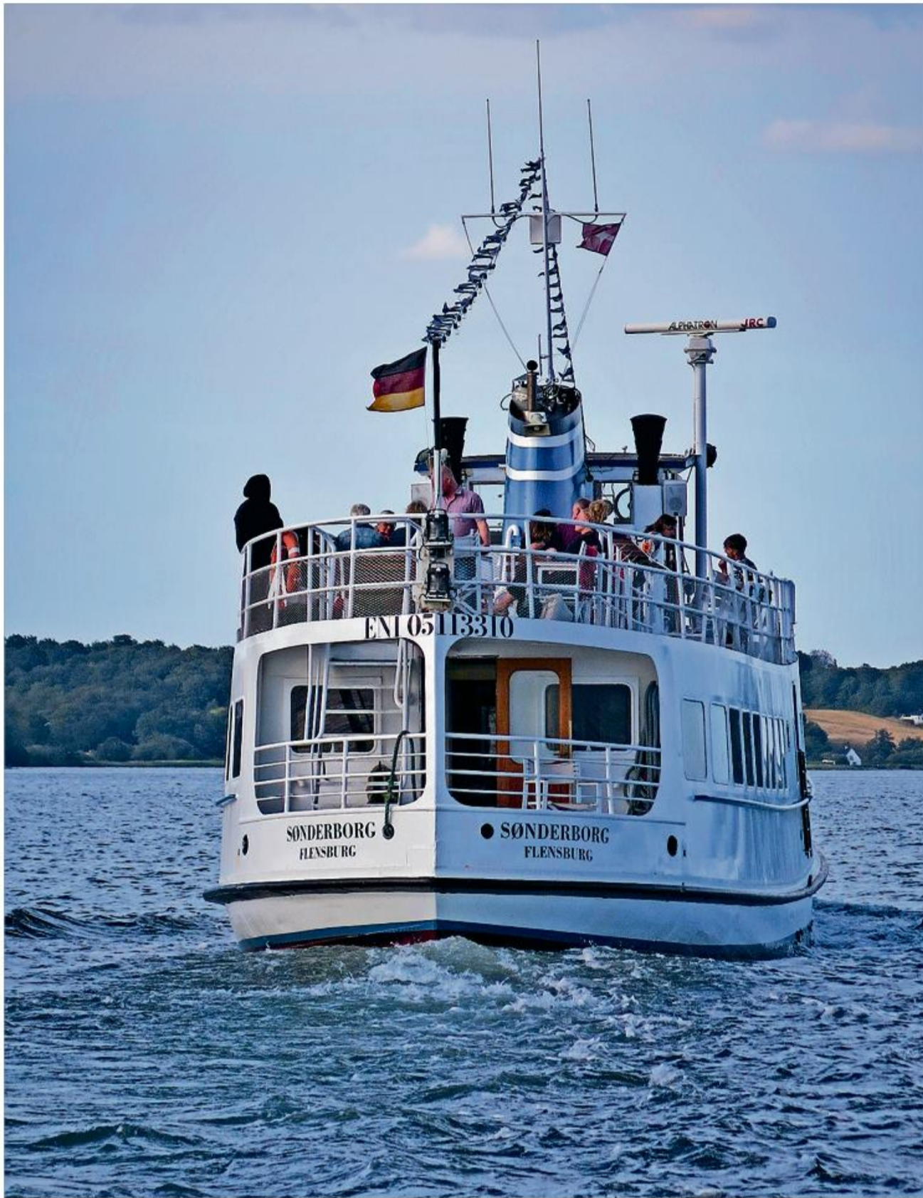
Skibet Sønderborg er det helt rigtige skib til en hyggelig SSF-sensommertur.