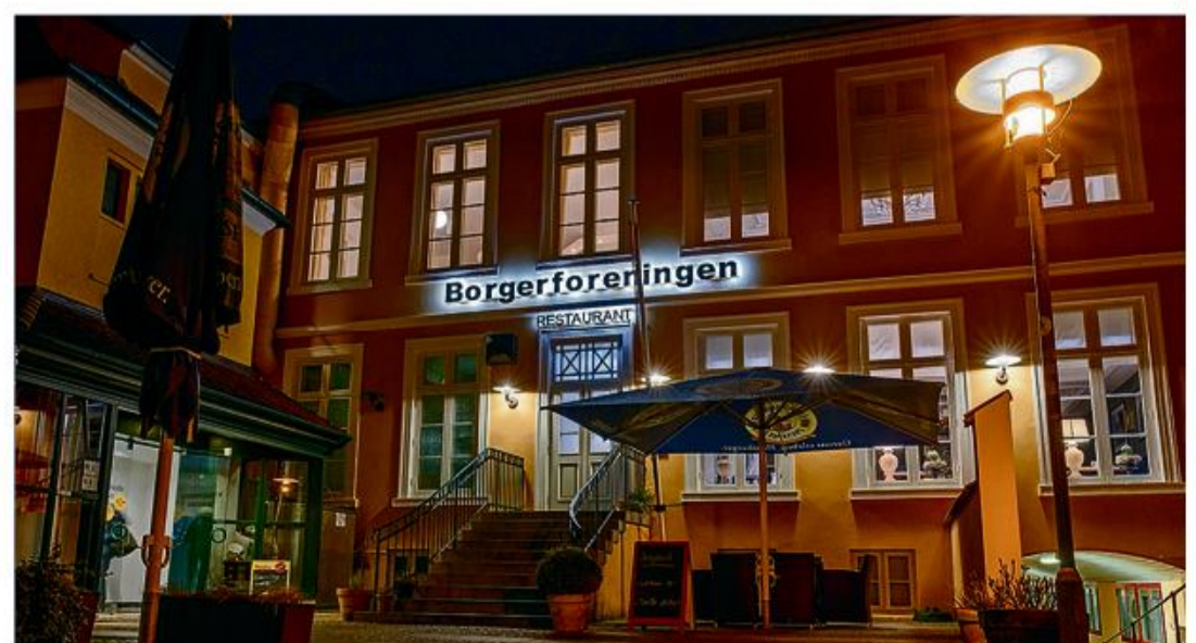
Den 6. september kommer historiker og forfatter Rejhan Bosnjak til Borgerforeningen.

Aftenen indledes som sædvanligt med spising og man bedes tilmelde sig senest lørdag den 3. september til Rest. Borgerforeningen tlf. 0461 23385. Også ikke-medlemmer er velkomne.