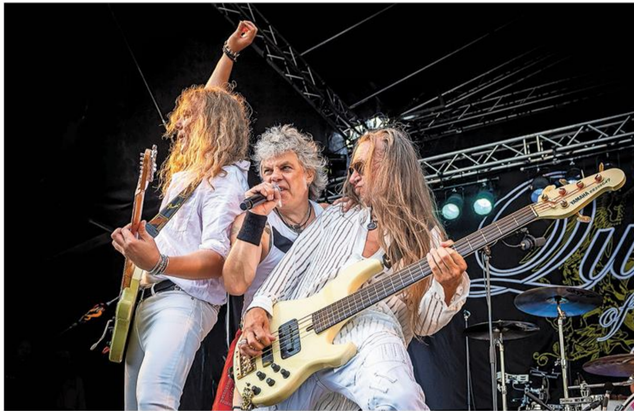
Coverbandet Queen of Denmark kommer til Husumhus fredag den 23. september.