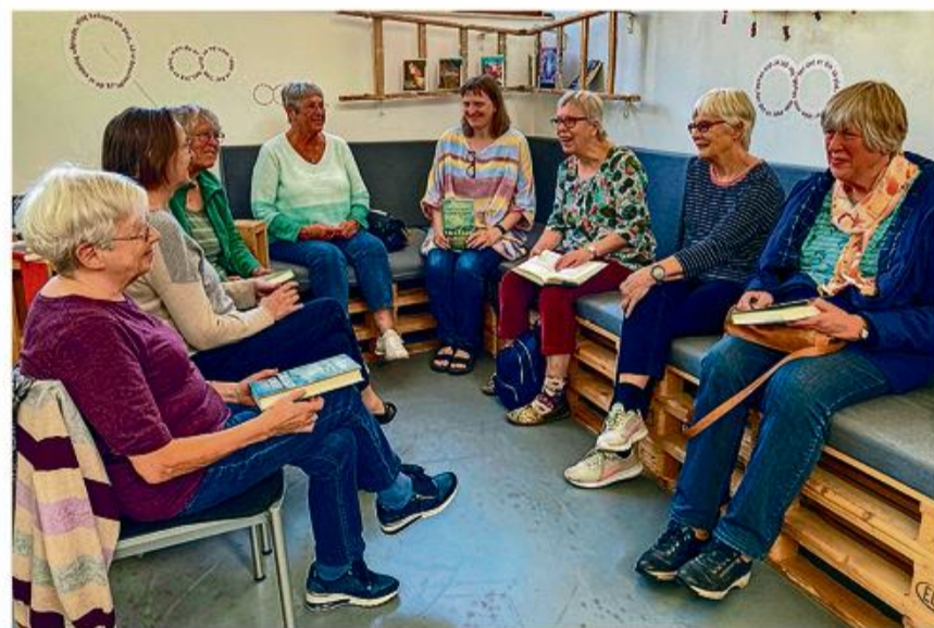
Biblioteket har flere læseklubber.