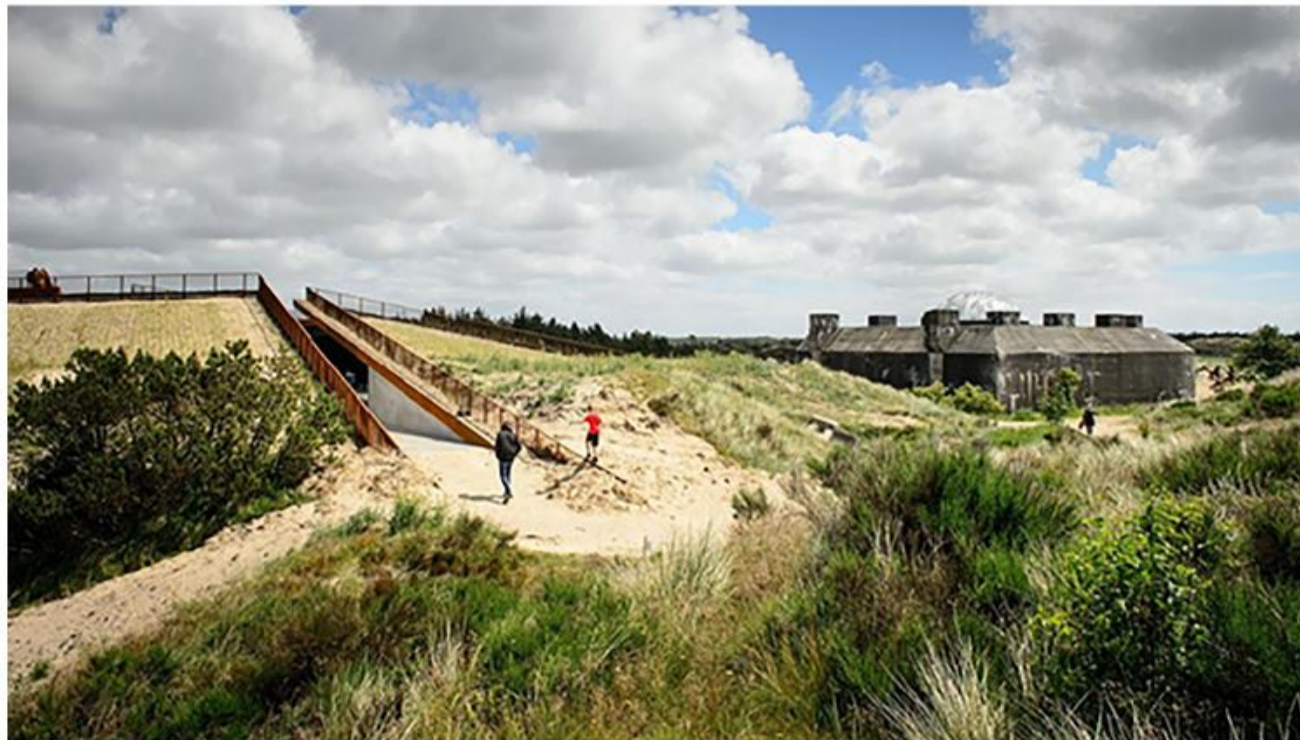
SSF Centrum-Duborg-Vest besøgte Tirpitz Museet i Blåvand