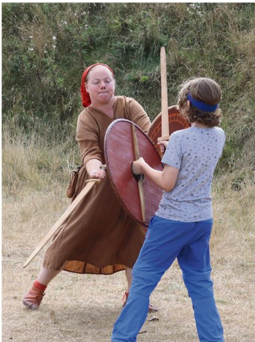
En ung kriger fra Frederiksstad i kamp med en skjoldmø fra Ribe.