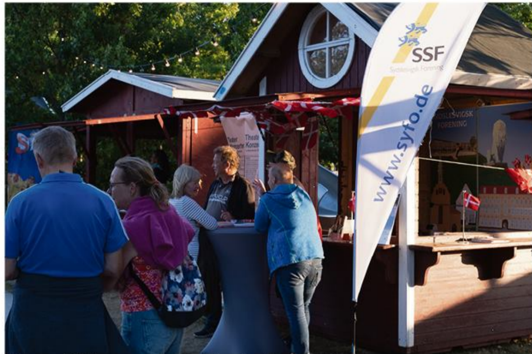
SSF er med. Både som partner, men også ved en informationsbod.