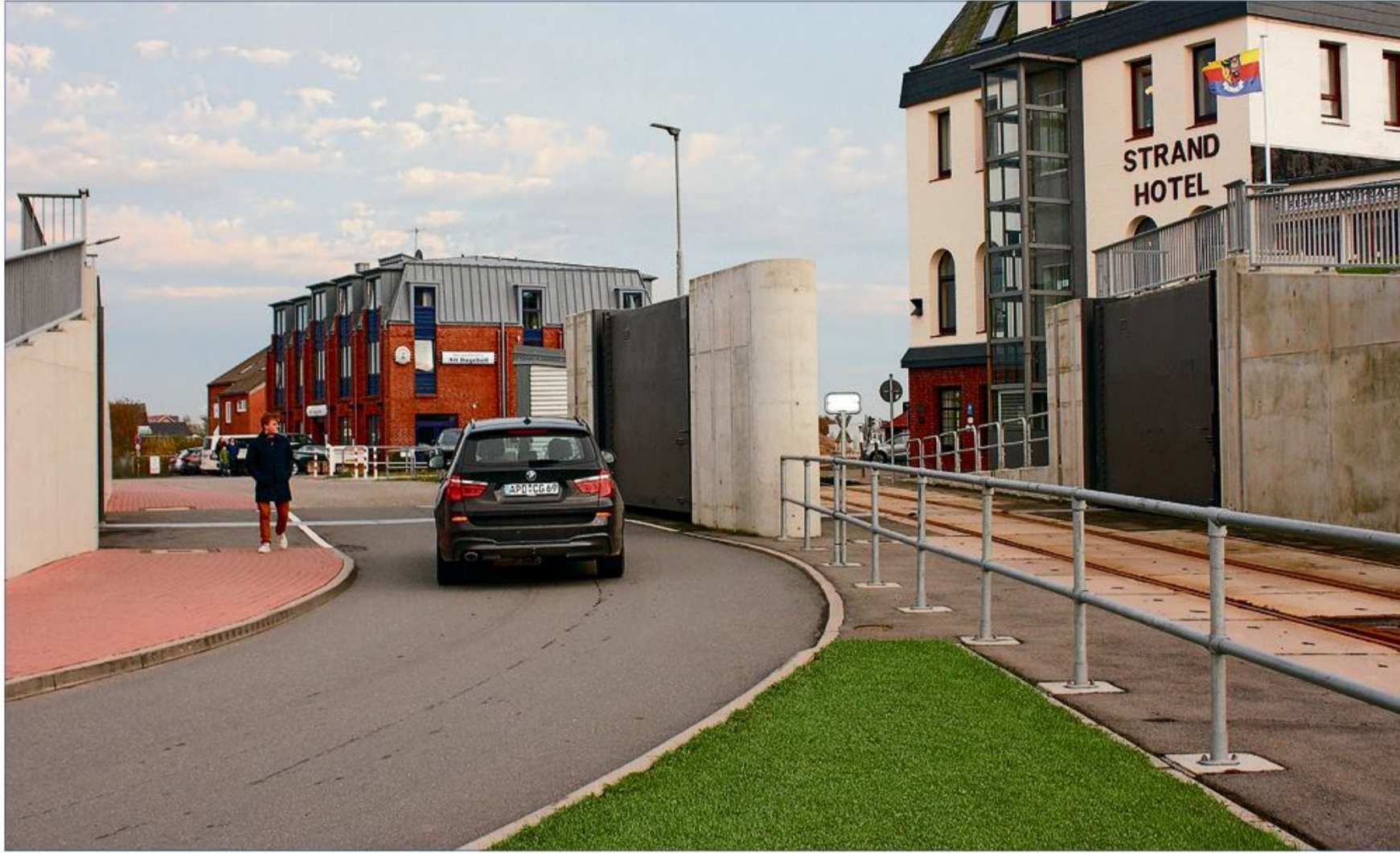
De store stormflodsporte i Dagebøl, der kan lukke for vej og jernbane. Til venstre mod vest er der bygget kæmpediger.