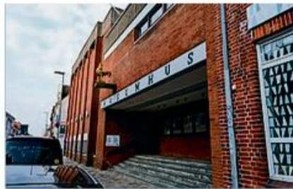
SSWs landsmøde holdes lørdag den 17. september 2022, kl. 09.00 i Husumhus.