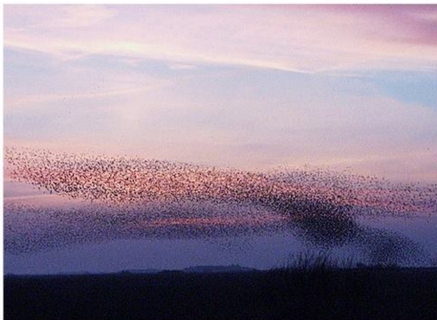
Sort Sol er et fantastisk fuglesyn.

med tilmelding til sekretariatet på 04661/2755 eller 0173/65 82 276 eller lars@syfo.de . Prisen for denne aften er 12,- € for medlemmer og 16,- € for ikke-medlemmer. Der bedes om tilmelding senest den 15.09.