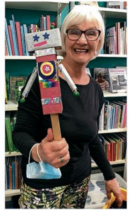
Dolas Dukketeater kommer til Egemfælde.

Dolas Dukketeater besøger Fællesbiblioteket Egemfælde, tirsdag 13. september klokken 15.00. Gennem årene har hun begejstret flere generationer med sit dukketeater for de mindste. Hver forestilling består af små stykker, som er forskellige fra gang til gang. Inviter dine børn eller børnebørn med i teatret på Fællesbiblioteket Egemfælde. Tilmelding til bibliotekar Kristian Ehmisen: keh@dcbib.dk to dage før. Begrænset antal deltagere.