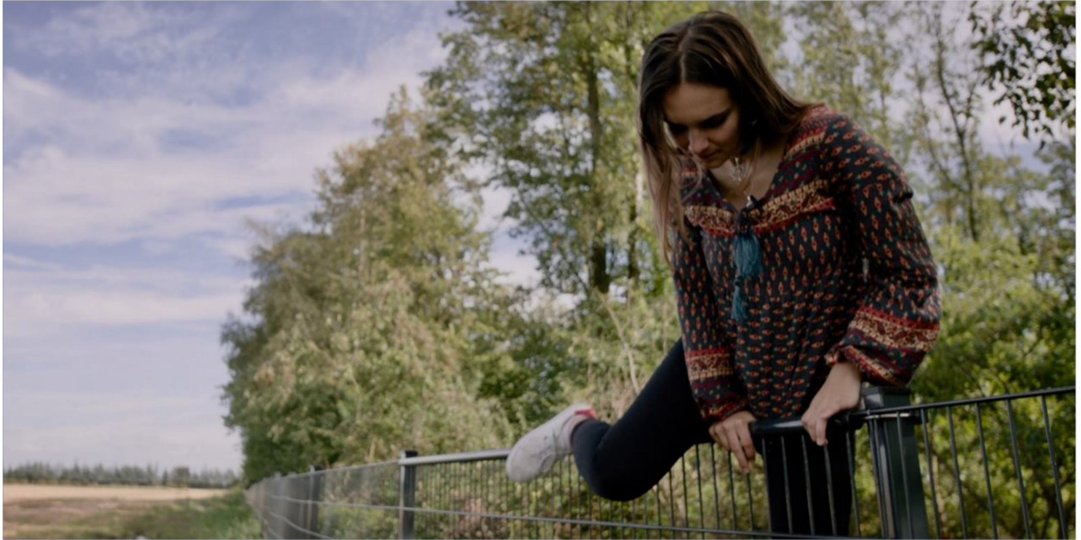
"Os på Grænsen" har forpremiere på Flensborghus onsdag den 14. september klokken 19. Efter filmen følger en paneldebat.