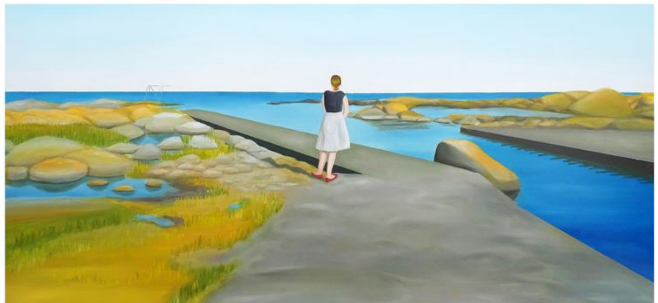
Udstillingen "Skabt på Bornholm" giver indblik i, hvilke kunstneriske tendenser der rører sig på Bornholm.

Sydslesvigs danske Kunstforening inviterer til åbning af udstillingen "Skabt på Bornholm - kunst og kunsthåndværk". Den vises på biblioteket i Flensborg, og åbningen er fredag den 16. september klokken 19:30. Udstillingen viser værker skabt af seks kunstnere og kunsthåndværkere, som alle er bosat på øen Bornholm. Værkerne giver et varieret indblik i øens kunstneriske positioner indenfor tekstil og tegning, keramik, maleri og fotografi. Enkelte værker forholder sig direkte til Bornholm i form af indhold eller brug af materiale, mens andre er mere indirekte påvirket af øens omgivelser. Fælles for alle værkerne er, at de er skabt på Bornholm. De er med til at give et nutidigt indblik i, hvilke kunstneriske tendenser der rører sig på Bornholm lige nu. Øen har gennem flere århundreder udviklet en unik position indenfor kunst og kunsthånd-