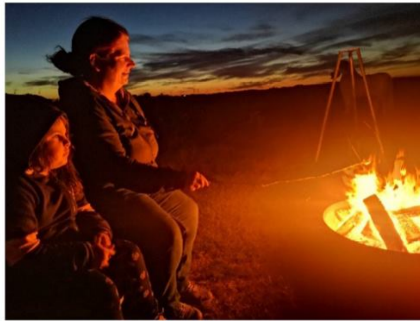
Lejrbål, marshmallows og et vidunderligt udsyn. Så er der lagt op til hygge.