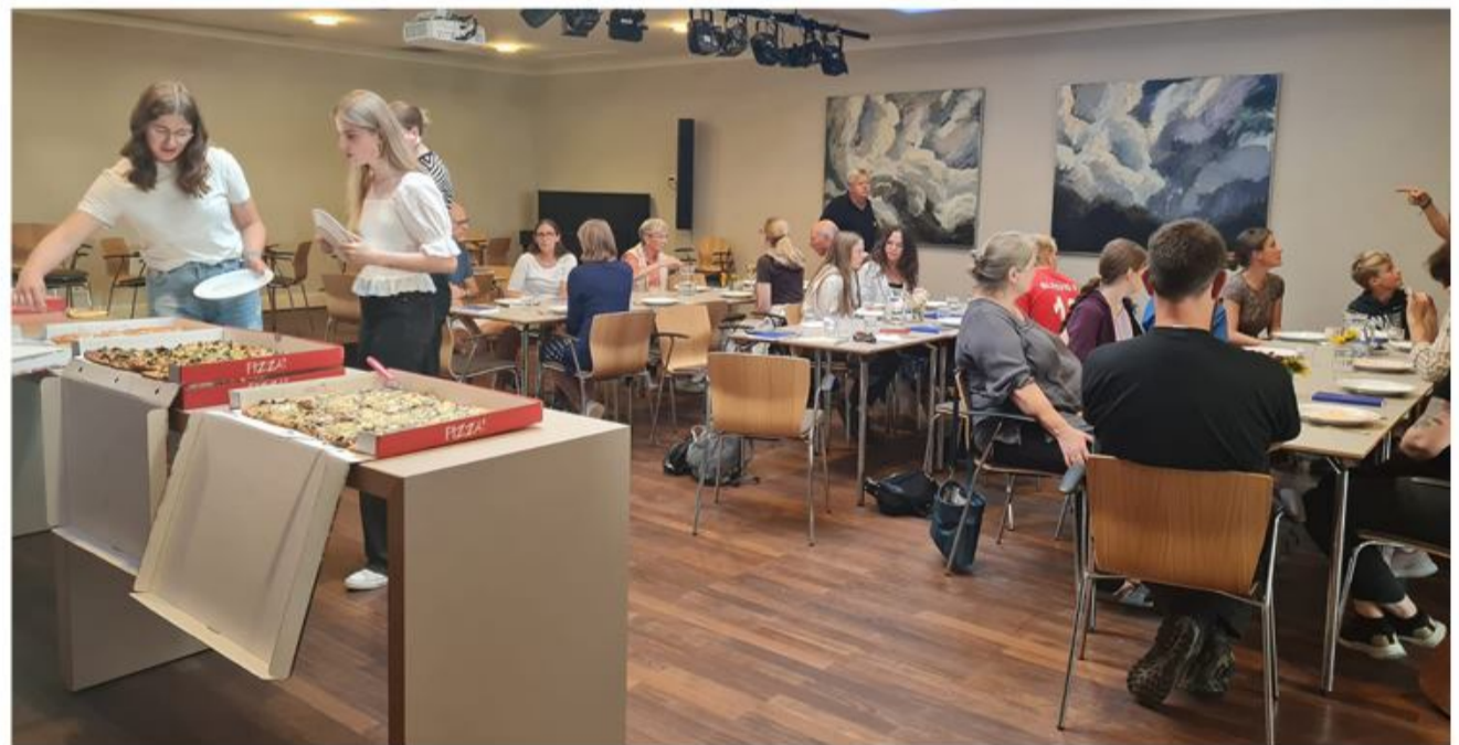
SpisSammenafteften i Slesvig var en stor succes. Den 27.10. er der igen lagt op til fælles hygge.

til de forskellige institutioner og lokaliteter i Slesvig, hvor mindretallet har sine aktiviteter, så man kan lære lidt mere om hinanden og de tilbud, der findes i mindretallet. Næste gang bliver i Slesvig Roklub den 27.10. fra kl 18-20. Alle med tilknytning til det danske mindretal – forældre, elever, børnehavnere, bosiddende eller arbejdende i Slesvig – er velkomne. Idéen er, at man spiser aftensmad og hygger sig samtidig. Desuden er det tænkt som et øvested for at tale dansk helt ukompliceret og tidsbegrænset til maksimalt to timer. Prisen er 7 EUR pr person og 15 EUR pr familie. Tilmeldning senest den 24.10. via sekretariatet: 04621 33888 eller gotorp@syfo.de . Og skulle en forening eller institution i Slesvig by føle sig fristet til at stille lokaler til rådighed for en aften, så send en mail til formand@slesvig-roklub.dk – for fællesskab gør stærk.