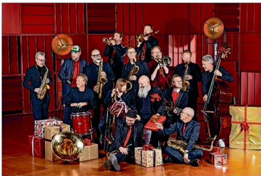
DR Big Band.