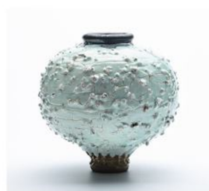
Bornholm har en unik position indenfor kunst og kunsthåndværk.

Sydslesvigs danske Kunstforening inviterer til åbning af udstillingen "Skabt på Bornholm - kunst og kunsthåndværk". Den vises på biblioteket i Flensborg, og åbningen er fredag den 16. september klokken 19:30. Udstillingen viser værker skabt af seks kunstnere og kunsthåndværkere, som alle er bosat på øen Bornholm. Værkerne giver et varieret indblik i øens kunstneriske positioner indenfor tekstil og tegning, keramik, maleri og fotografi. Enkelte værker forholder sig direkte til Bornholm i form af indhold eller brug af materiale, mens andre er mere indirekte påvirket af øens omgivelser. Fælles for alle værkerne er, at de er skabt på Bornholm. De er med til at give et nutidigt indblik i, hvilke kunstneriske tendenser der rører sig på Bornholm lige nu. Øen har gennem flere århundreder udviklet en unik position indenfor kunst og kunsthånd-