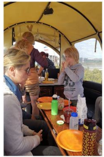
Pandekagerne blev lavet direkte på vognen.