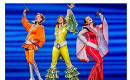
Udflugten til Hamborg indeholder blandt andet en tur til musicalen Mamma Mia.