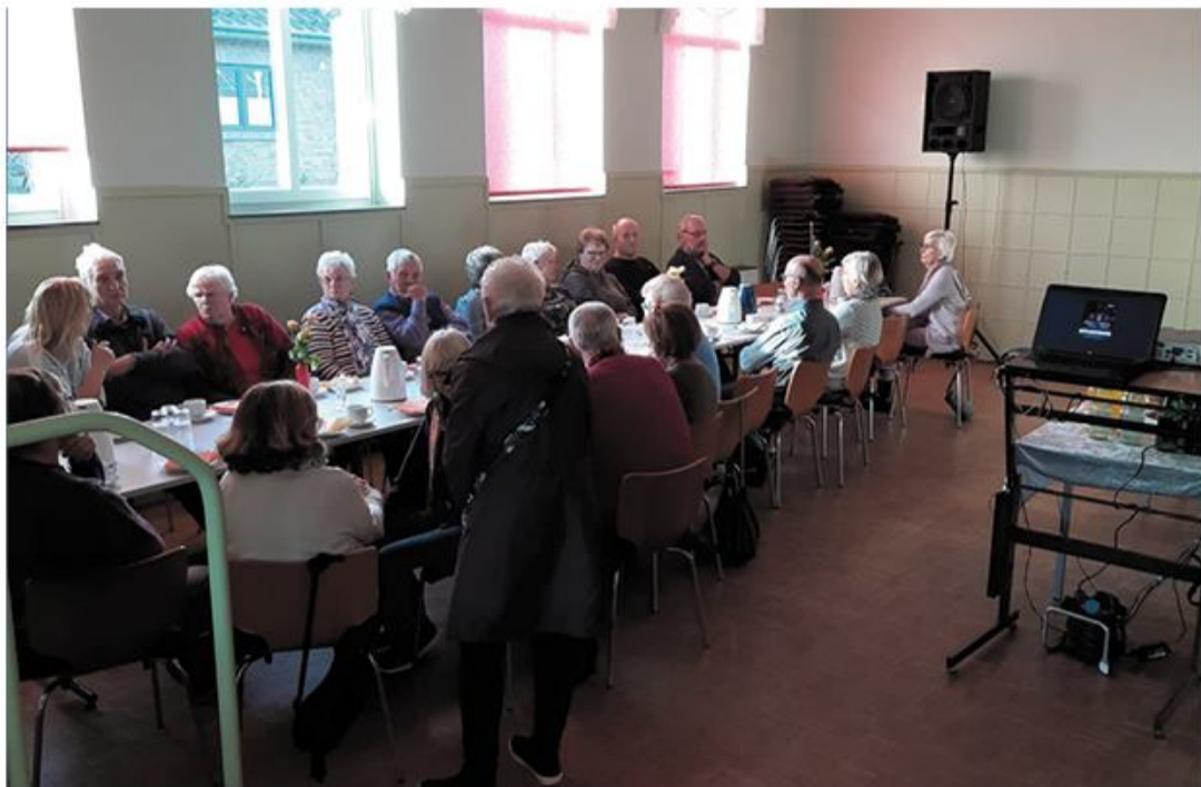
En filmeftermiddag i fællesskab indebærer en masse hygge og fællesskab.