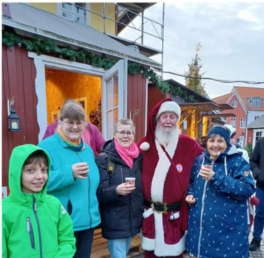
SSF Frederiksstad tog til Tønder for at varme op til den kommende juletid. En vellykket tur for små som store.

Dermed er distriktet ved at være stemt ind til næste julearrangement – julebasar i Paludanushuset i Frederiksstad. Den holdes den 25.11.2022 i forbindelse med byens "Grachtenweihnacht".