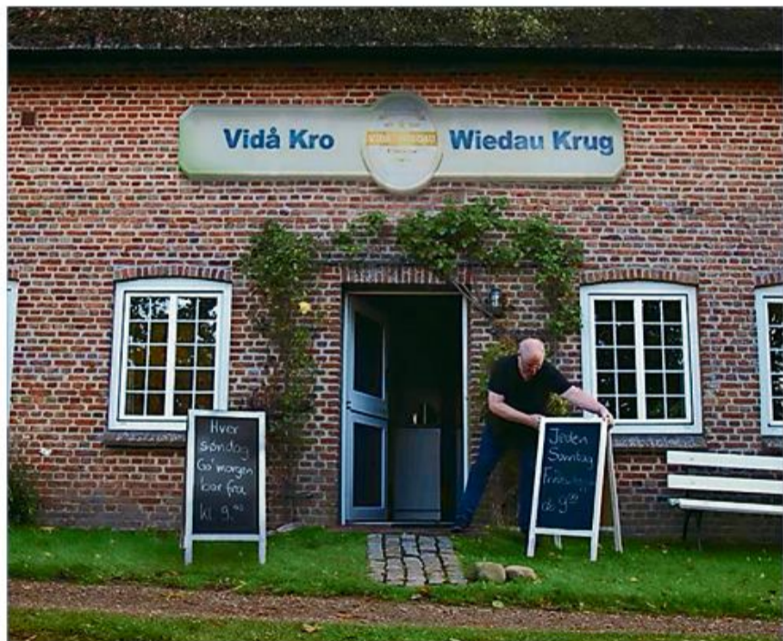
Kroen ved Vidåen

Foruden hyggeligt samvær, byder eftermiddagen på filmen "Kroen ved Vidåen". Alle er velkomne. Der serveres kaffe og kage.