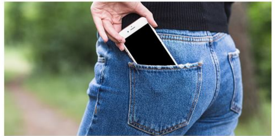
Foredraget om datalogi giver blandt andet svar på, hvordan man forsker på området.

bare computer ligger resultaterne af mange års datalogisk forskning. Men hvordan forsker man i datalogi? Hør om teknologiens udvikling og forskningen i blandt andet data, algoritmer og brugergrænseflader, der gavner alle.