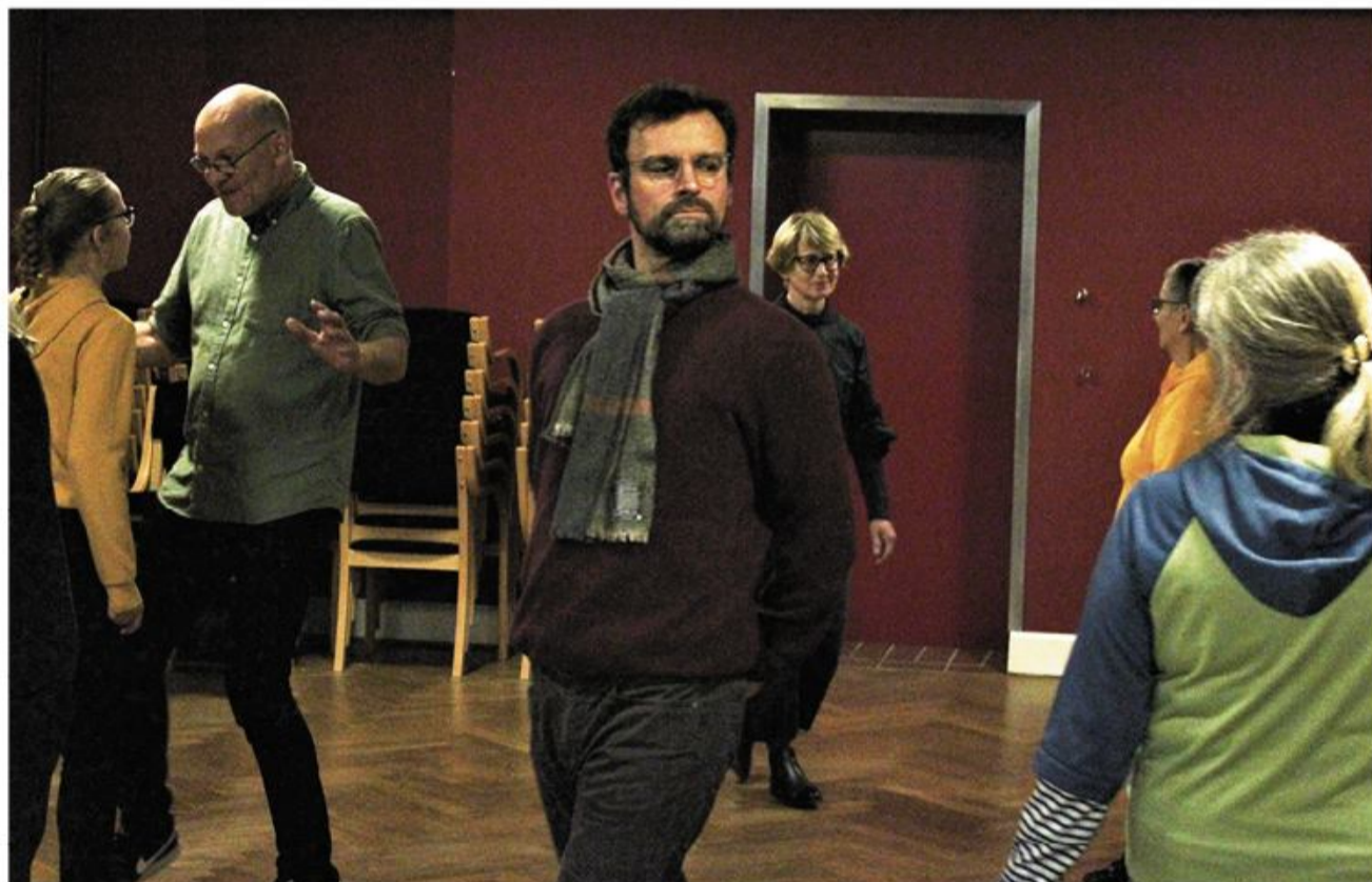
Dramakurset betød også, at man skulle prøve kræfter med nye øvelser.