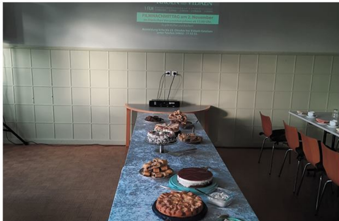
Efter filmen var der lagt op til sønderjysk kaffebord.

Lattermusklerne blev flittigt brugt, da SSF i Agtrup holdt filmeftermiddag i forsamlingshuset. Filmen »Kroen ved Vidåen» levede op til forventningerne, alle tilskuere var begejstrede over en film med til dels lokale skuespillere og de fem sprog, der tales på