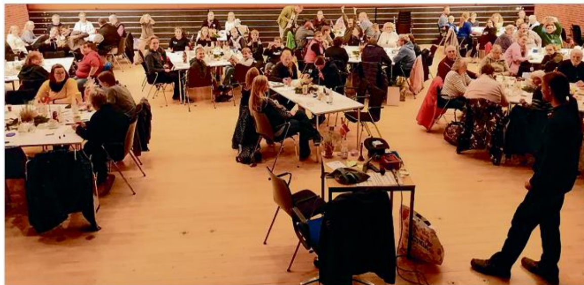
Altid en gevinst – lottoaftner byder på noget for store og små.

Aftenens indtægter gik til mindretallets børn og unge i omegnen, så de har lidt tilskud til deres næste ture. Alt i alt bød lottoaftenen på alt, hvad der hører til. Lækker mad, gode gevinster, fællesskab, snak, grin og gode formål – og deltagere fra tre generati-