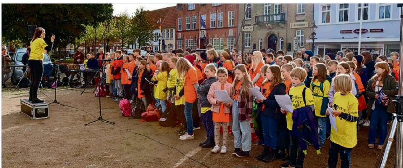
Da koncerten begyndte, brød solen igennem.