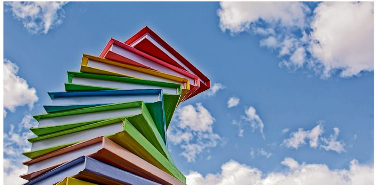
Bibliotekar Lene Lund præsenterer nye gode romaner

der om tilmelding (dcb@dcbib.dk). Foredraget livestreames fra Aarhus Universitet og arrangeres af Faculty of Natural Sciences, Aarhus Universitet og udbydes sammen med Carlsbergfondet.