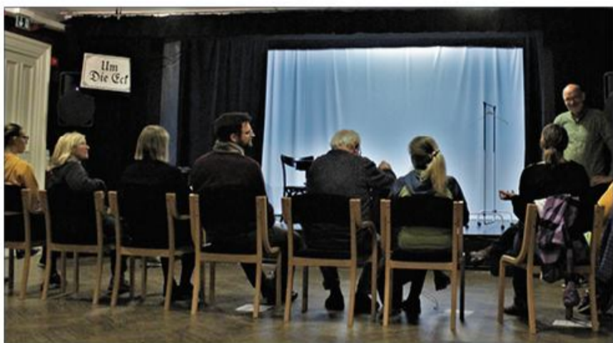
Kurset på Det Lille Teater var godt besøgt.

gik snakken ivrig. Det var tydeligt at der var en god stemning og kursisterne var tændte på at optræde og lære. Kurset var en optakt til teatrets næste større forestilling: "stumper og stykker". Der må have været stor tilfredshed med dagens prøvelser for alle, undtagen én, deltagerne meldte sig efterfølgende til at være med i forestillingen. Måske er en stor stjerne på teatrets firmament blevet tændt?