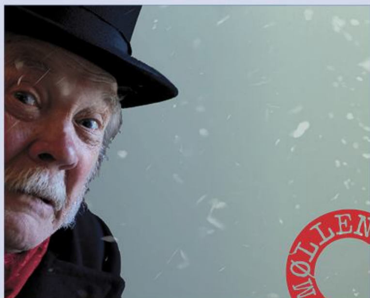
Et juleeventyr

staffagen barberet væk. Helt i romanens ånd bliver "Et juleeventyr" til en intim oplevelse, hvor tilskuere kommer ind under huden på Ebenezer Scrooge og dykker ned i forretningsmandens slørede livshistorie. Det bliver en eftertænkning og tankevækkende juleforestilling for hele familien. Teatret Møllens "Et juleeventyr" præsenteres af SSF, stykket vises torsdag, den 17.11.22, klokken 19:30 på Flensborghus i Flensborg. Billetter: ssf-billetten.de, +49 461 14408 125, SSFs sekretariat, Aktivitetshuset, sh:z Ticketcenter, Nikolaistr. 7 FL, Reisebüro Peelwatt, Marie-Curie-Ring 39 FL og ved indgangen.