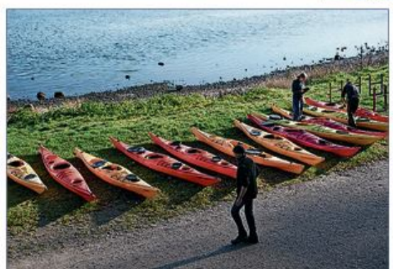
Klubbens kajaker inspiceres – for at sikre, at de er i forsvarlig stand.

Nu er kajakerne klar til første sikkerheds træning i Campusbad, som finder sted den 18. november. For Flensborg Roklub er bestemt ikke gået i vinterhi. Der venter medlemmerne et spændende vinterprogram indtil klubfanen atter kommer op i standen. Klubben orienterer herom på dens Facebook-side: