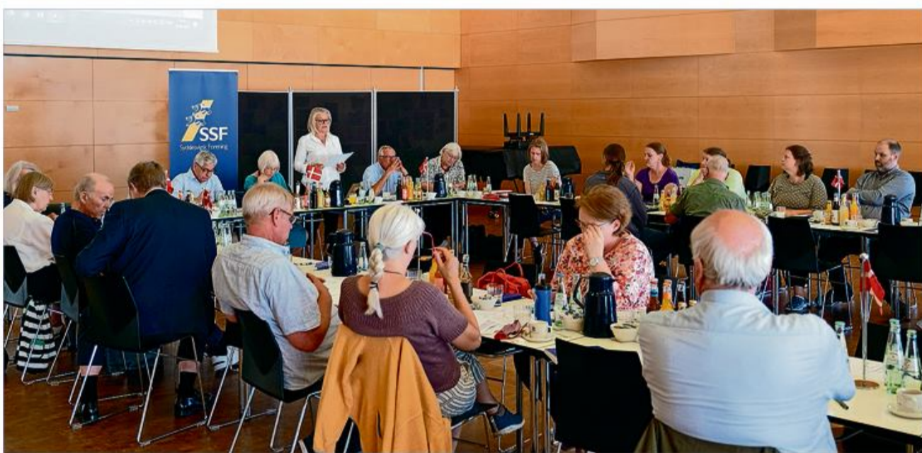
SSF holder hovedstyrelsesmøde på A.P. Møller Skolen den 21. november.