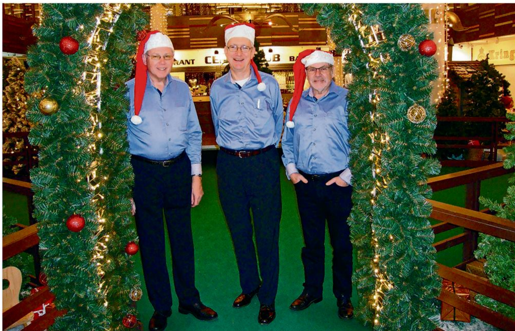
"De grå Synger" skaber den rette julestemning