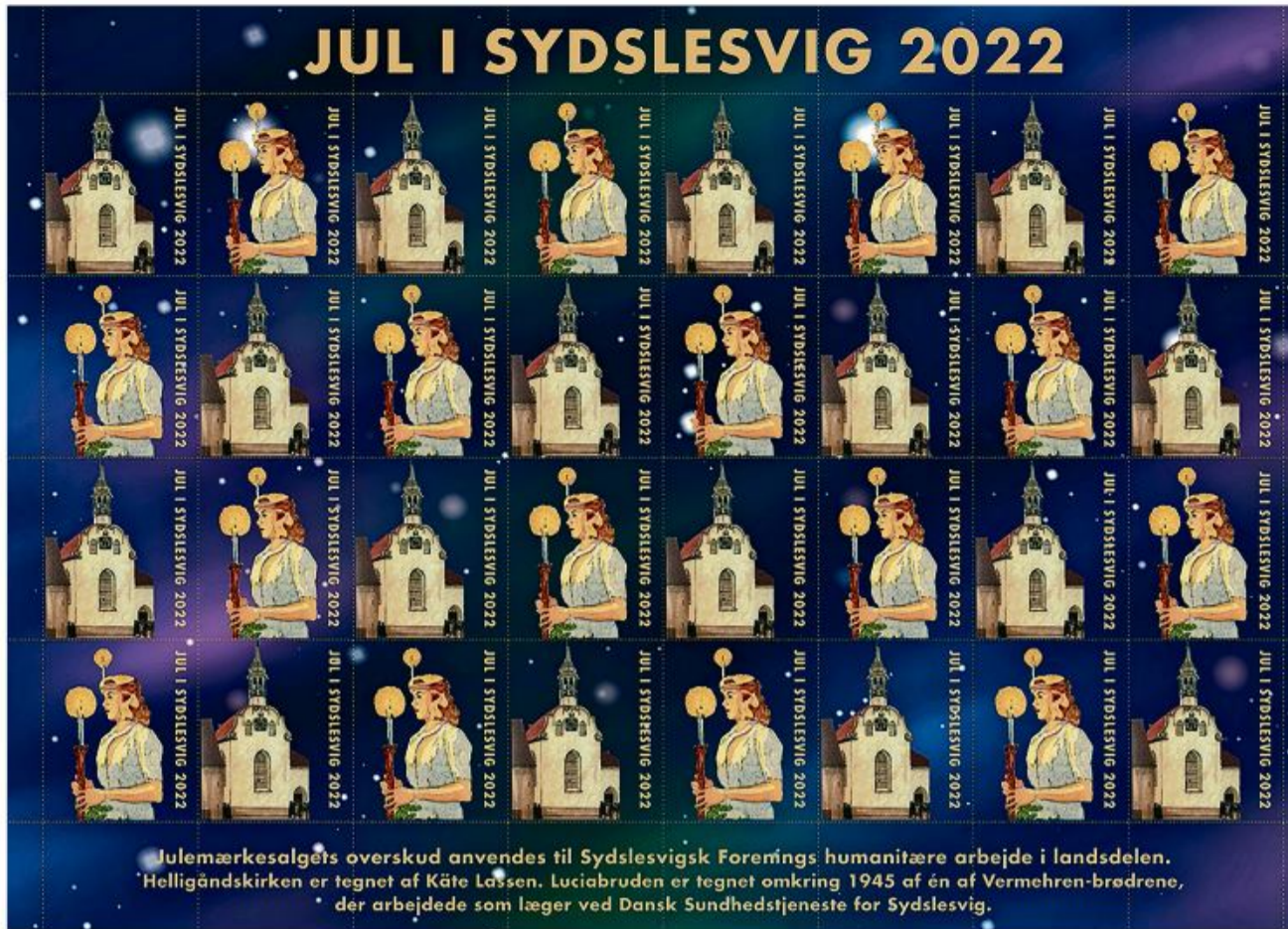
Julemærket 2022 består af to motiver – Helligåndskirken og en Luciabrud. (Grafik: SSF)