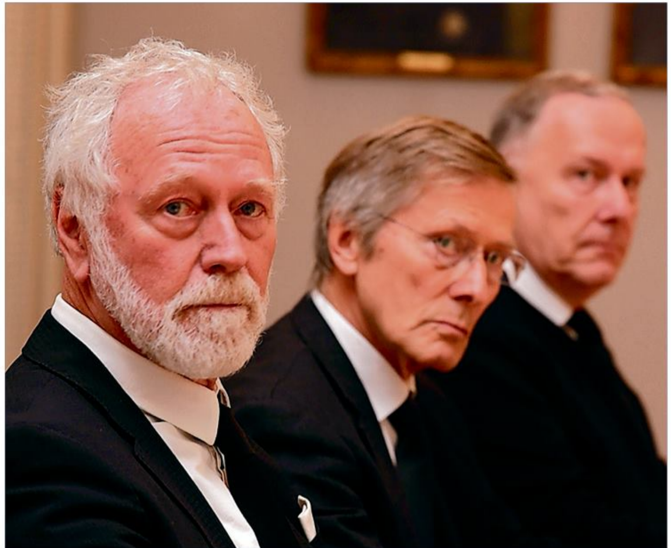
Bestyrelsen i SSF Flensborg By er bekymret. De mangler gode ideer.