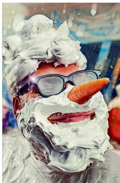
Julemand med juleskæg!

Tilmelding på akti@sdu.de eller tlf. +49 (0)461 150140 og husk, der er kun et begrænset antal pladser!