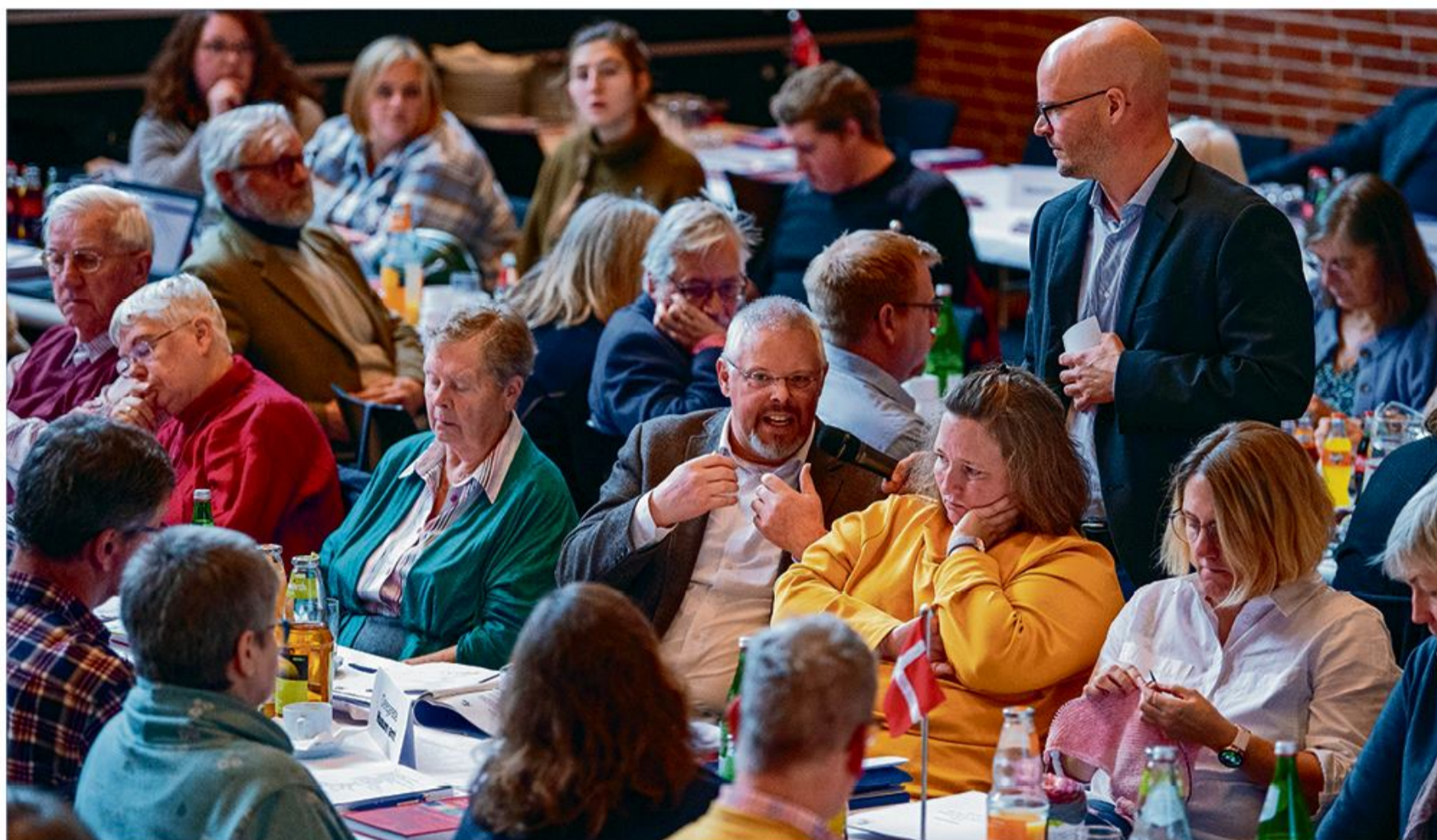
De delegerede fik lejlighed til at komme med deres syn på debatten om strukturen.