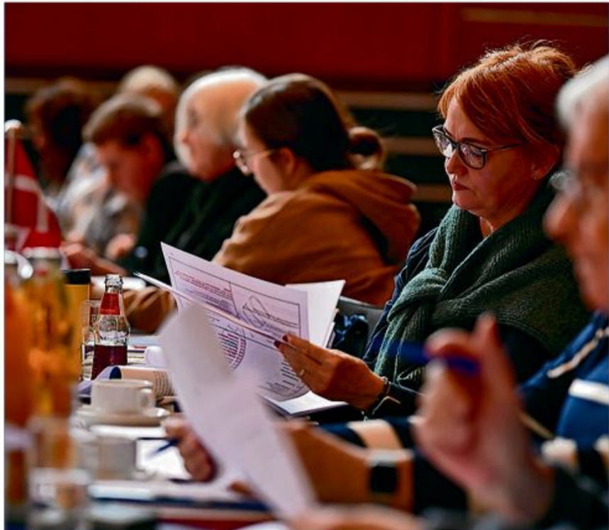
Vedtægtsændringerne kom ikke mindst på baggrund af to amters ønsker om at gå sammen i det nye Amt Sydvest.

godkendt, hvilket blandt andet betyder, at de to amter fra den 1. januar indgår i Amt Sydvest.