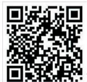
Se videoen her

Nu håber bestyrelsen, at medlemmerne tager godt imod filmen og SSF Flensborg By ser frem til gode ideer fra denne kant. For har man et projekt, så har man SSF Flensborg By! Filmen er delt på de sociale medier og den kan ses ved at scanne qr-koden