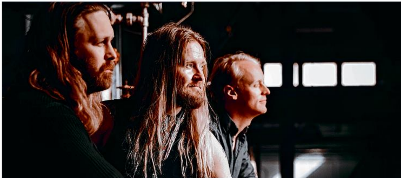
Islandske juletoner -Árstíðir

koncerten lyser bandet den vinterlige mørke tid op med deres intime arrangementer og harmoniske sang. Arrangementet præsenteres af Mitendrin GmbH, SdU og SSF. Billetter: ssf-billetten.de , +49 461 14408 125, SSFs sekretariat, Aktivitetshuset, sh:z Ticketcenter, Nikolaistr. 7 FL, Reisebüro Peelwatt, Marie-Curie-Ring 39 FL og ved indgangen.