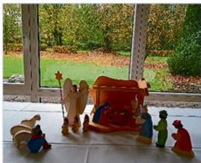
En smuk julekrybbe