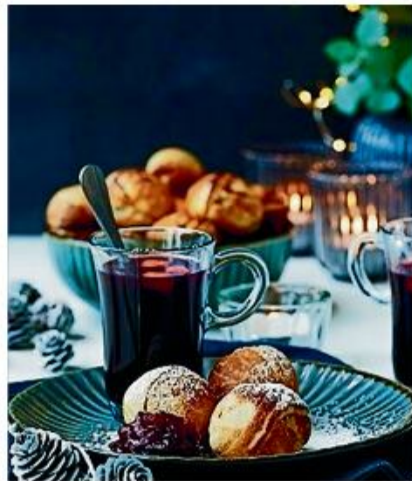
Hvad er julen uden æbleskiver og gløgg?