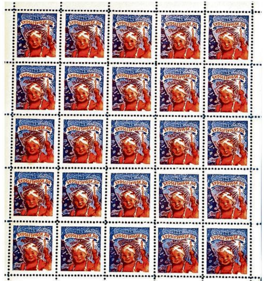
Sådan så mærket ud i 1949. (Grafik: SSF)