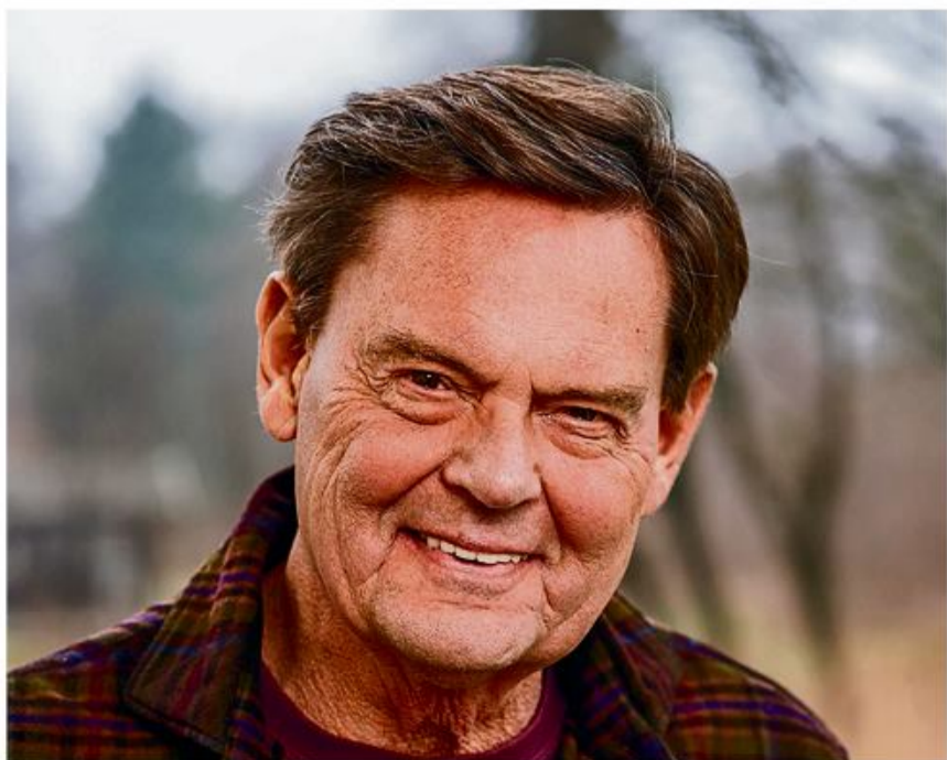
Ulf Pilgaard

gør man sig over det liv, som man har levet og ikke mindst om døden, som utvivlsomt nærmer sig? Foredraget tager udgangspunkt i bogen "Hellere halvgammel end helt død" og er en livsglad og optimistisk fortælling fra en af dansk kulturlivs helt store profiler, der stadig er nyforelsket og stadig i fuld vigør. Ulf fortæller levende og indsigtfuldt om venskaber, sorg, sex og lyst, tro, fortrydelse og succeser, humor – og om, en dag, at skulle byde verden farvel.