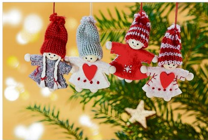
Juletid er nissetid