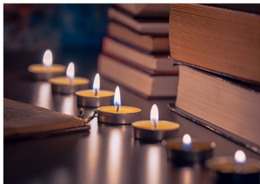
Skumringstid på biblioteket.

Det andet arrangement holdes mandag den 14. november klokken 18:00. Emnet er "Skumringstimen".