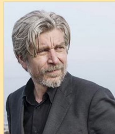
Foredrag med Karl Ove Knausgård vises på biblioteket.

I 2020 fik Karl Ove Knausgård »Hans Christian Andersen Litteraturpris«, som er en pris, der hylder H.C. Andersens indflydelse på forfattere i hele verden. I motiveringen lød det blandt andet, at Knausgård tildeles prisen »for sin intense fornyelse af feltet mellem roman og selvbiografi, et område som også H.C. Andersen i stor stil udforskede«. Fri entré. Tilmelding til dcb@dcbib.dk senest dagen før.