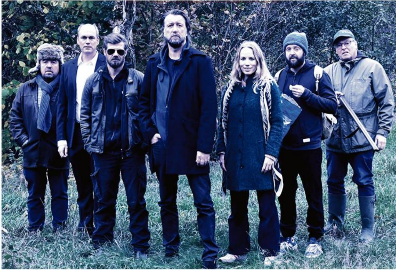
NørregadeTeatret med Blinkende lygter