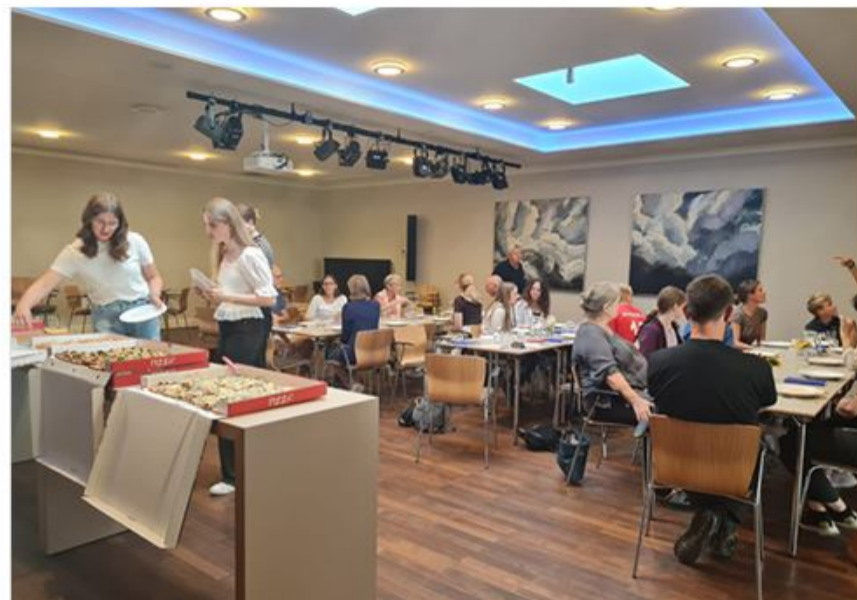
Første SpisSammen blev holdt på Slesvighus og omkring 30 personer deltog.

Den 27. oktober klokken 18-20 gentager mindretallet i Slesvig succesen med "SpisSammen aften". Denne gang lægger Slesvig Roklub hus til. Sammen med andre institutioner og foreninger i Slesvig by tilbydes der i alt 6 aftener, hvor mindretallet kommer sammen, hygger, synger og spiser aftensmad i fællesskab. Man er velkommen til at deltage, lige meget hvor dygtig man er til dansk. På den måde bliver "SpisSammen" til et møde – men også et øvested for at tale så meget dansk som muligt og samtidig at være sammen med mindretal-