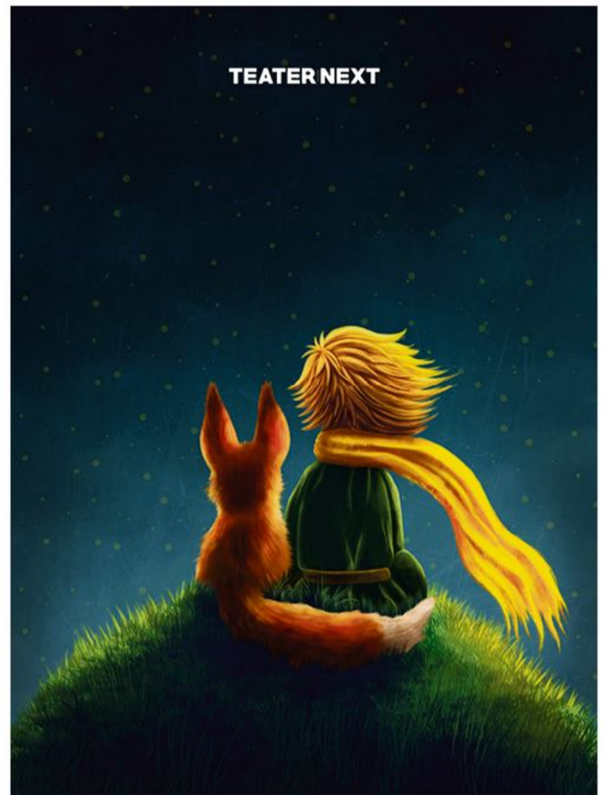
Den lille prins og universet