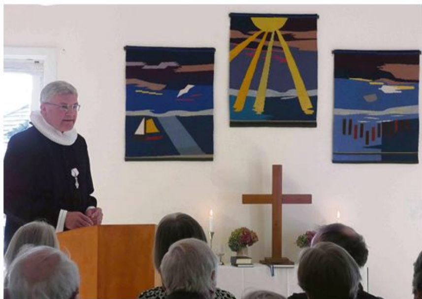
Menighedshuset i Aventoft har fået tre nye altertæpper, fremstillet af en væverske fra Tønder.