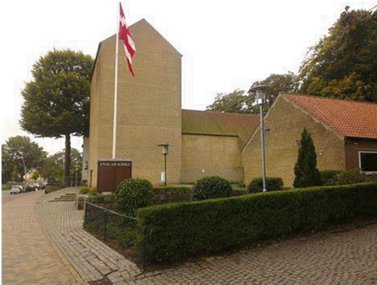
Ansgar kirke.