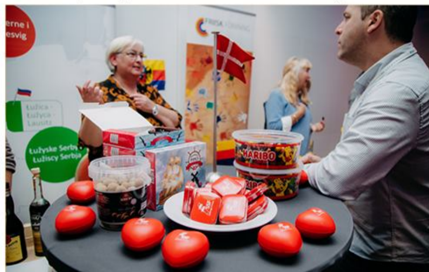
På mindretalsmarkeder præsenterede de forskellige mindretal sig.