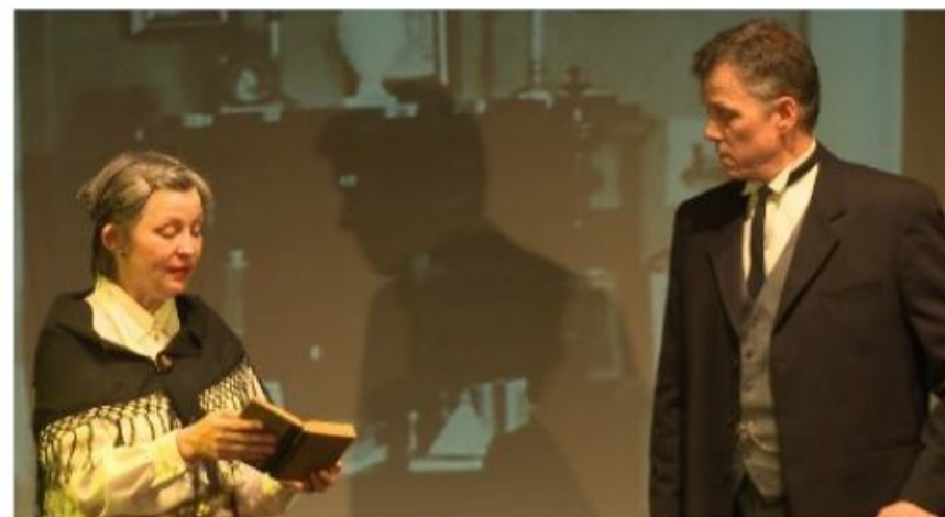
Aktiviteterne på Det lille Teater kommer så småt i gang igen.