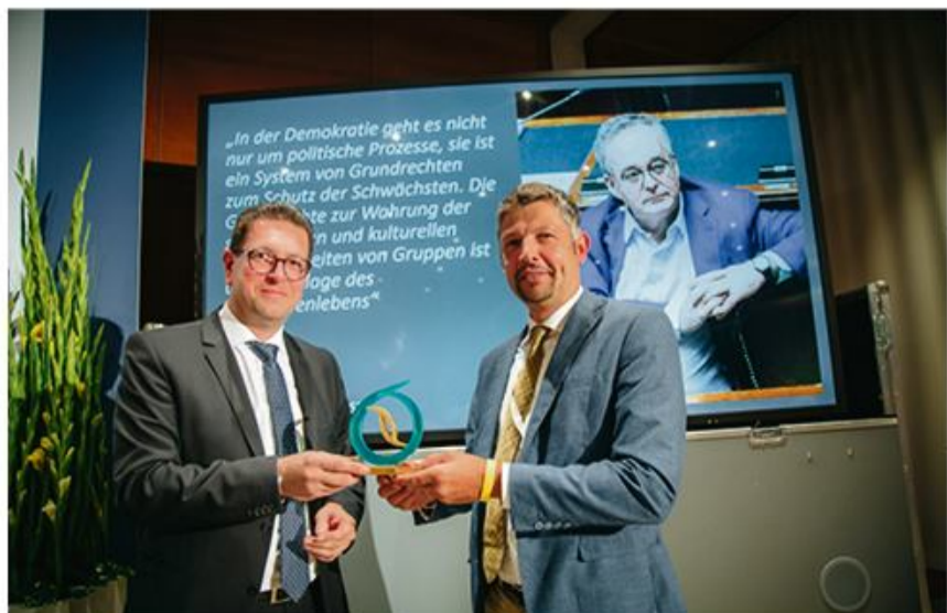
Den italienske politiker Gianclaudio Bressa modtog prisen, men kunne på grund af sygdom ikke deltage personligt ved konferencen.

Upcycling & More i Flensborghus' gård. Her arbejder hun med kunsthåndværk og upcycling.