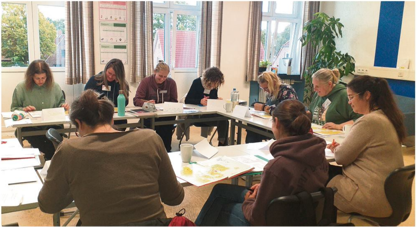
Mens forældrene indtog børnenes pladser i klasselokalet...

en masse forskellige workshops som f.eks. småkagebaking, julehygge, børnebiograf eller en udflyt til Multimar Wattforum. Der er aktuelt en håndfuld ledige kursuspladser på holdet for begyndere/ letøvede. Familiesprogdagene afholdes på følgende lørdage: 5. november, 3. december, 14. januar, 11. februar og 11. marts fra kl. 9-16 på Uffe- Skolen i Tønning. Det koster 30€ pr. dag for at deltage i undervisningen (6 lektioner) inklusiv forplejning, børn kan være med gratis. Dog er det påkrævet, at alle deltagere er medlem i SSF. Interesserede kan få nærmere information ved at kontakte Andrea Holste på mail (andrea.holste@skoleforeningen.org).