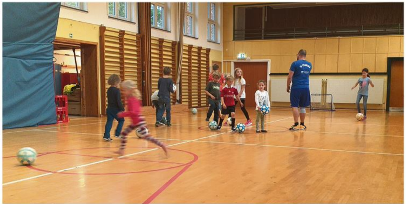
...hyggede børnene sig i tre forskellige workshops. (Fotos: privat)

en masse forskellige workshops som f.eks. småkagebaking, julehygge, børnebiograf eller en udflyt til Multimar Wattforum. Der er aktuelt en håndfuld ledige kursuspladser på holdet for begyndere/ letøvede. Familiesprogdagene afholdes på følgende lørdage: 5. november, 3. december, 14. januar, 11. februar og 11. marts fra kl. 9-16 på Uffe- Skolen i Tønning. Det koster 30€ pr. dag for at deltage i undervisningen (6 lektioner) inklusiv forplejning, børn kan være med gratis. Dog er det påkrævet, at alle deltagere er medlem i SSF. Interesserede kan få nærmere information ved at kontakte Andrea Holste på mail (andrea.holste@skoleforeningen.org).