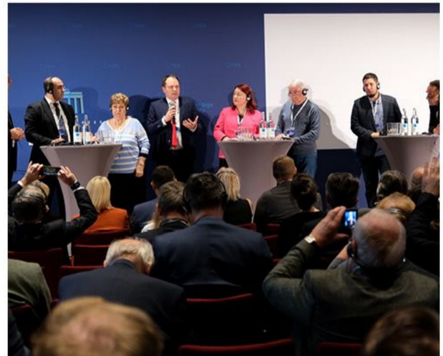
Repræsentanter fra mindretal i Ukraine fortalte om vilkårene under Ruslands angrebskrig.

Som første skridt i processen vil firekløveren bestående af grænselandets mindretal nu danne en fælles styringsgruppe, der meget hurtigt trækker i arbejdstøjet.