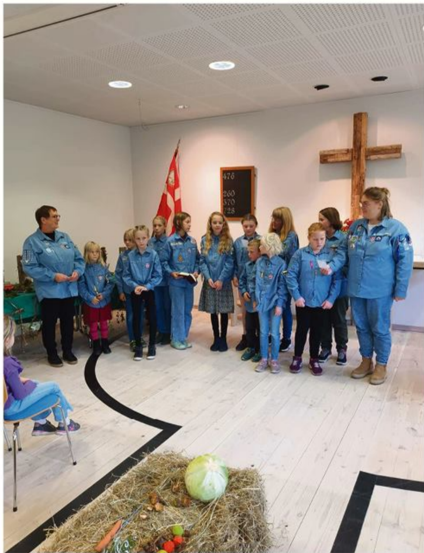
Der blev indsamlet 130 euro, som går til SOS Kinderdorf.