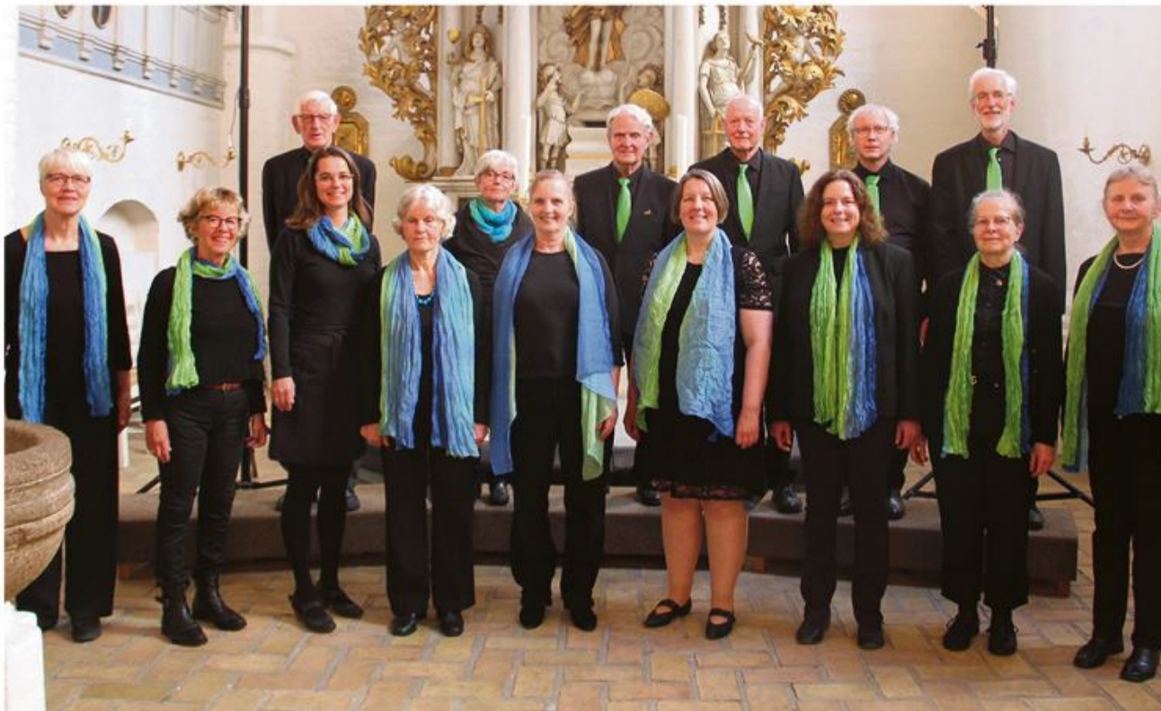
Helligåndskirkens kor.