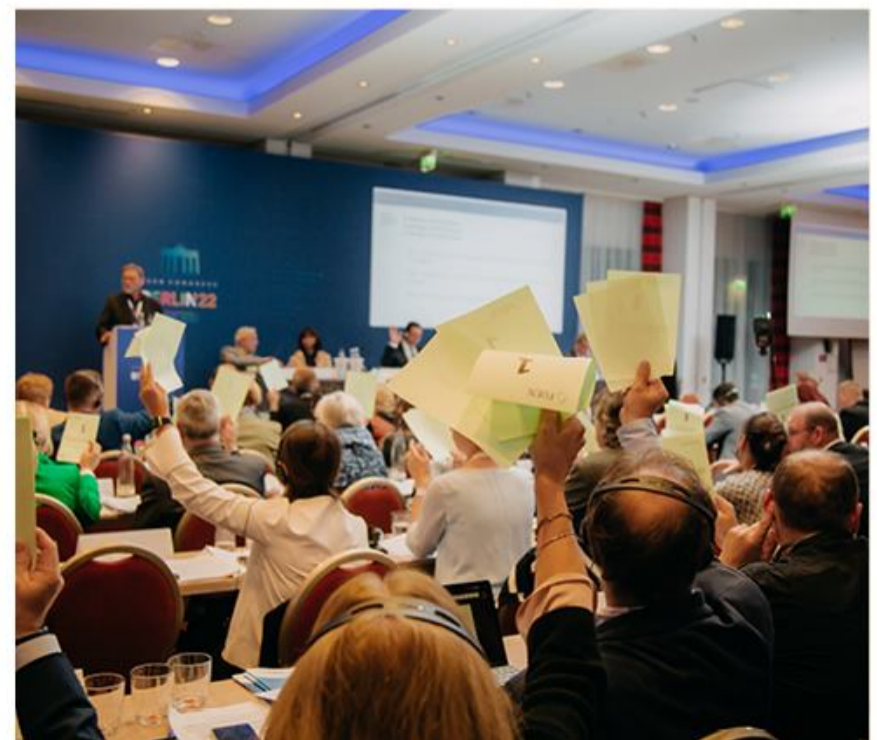
Ved den årlige konference i FUEN træffes der beslutninger, der berører mindretallene i Europa, men også om, hvor mindretallene spiller deres fodbold