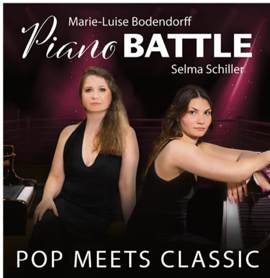
To pianister på flygel