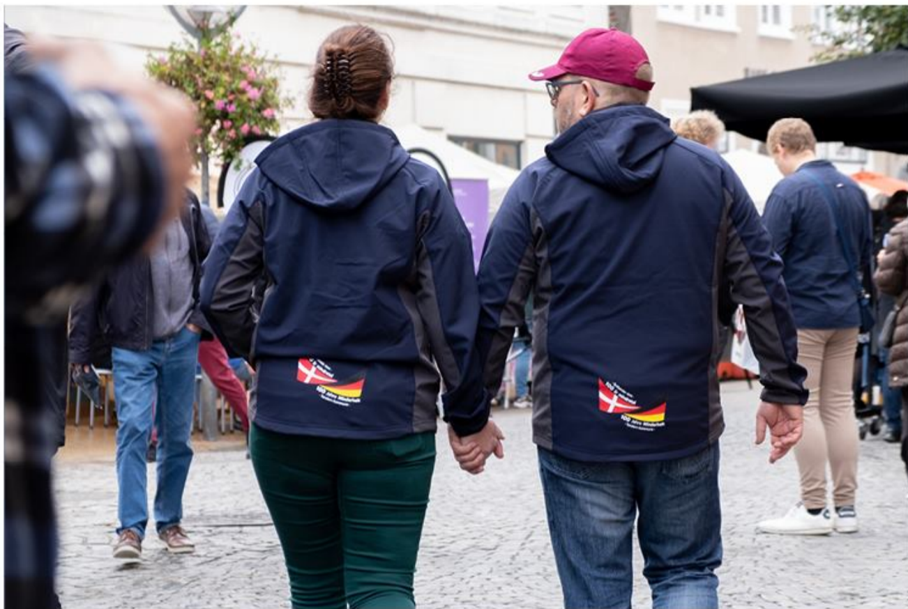
Fortælleseminaret har fokus på den personlige grænselandshistorie, der kan åbne en vej til forståelse og forsoning.