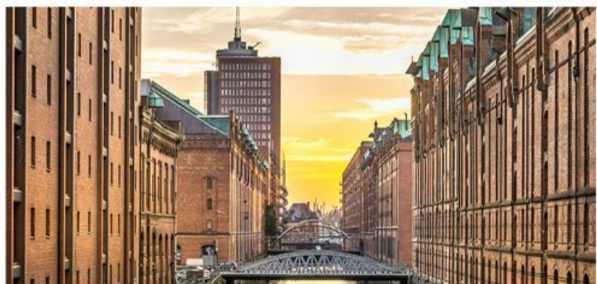
I weekenden den 29.-30. oktober går turen til Hamborg, hvor man blandt andet kan ses verdenskulturarven "Speicherstadt".