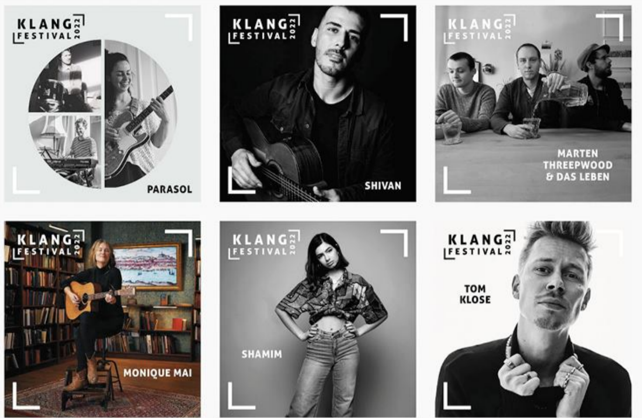
Klang Festival går fra den 15.-18. september. Der er gratis entre til koncerterne.