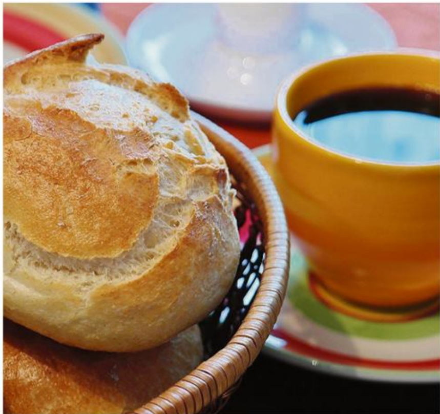
Frokost og informationer – i Ejderhuset serveres begge dele.