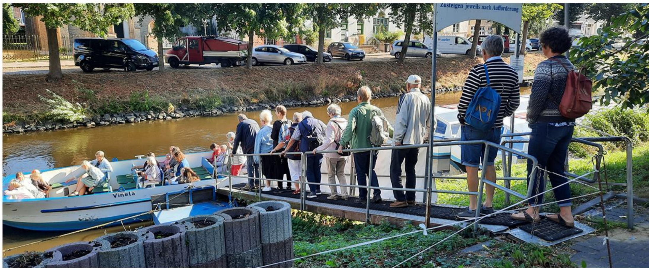
Så tages ombord til kanalrundfarten.