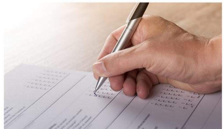
SdU er gået i gang med en stor spørgeskemaundersøgelse af fritids- og foreningslivet i Sydslesvig.