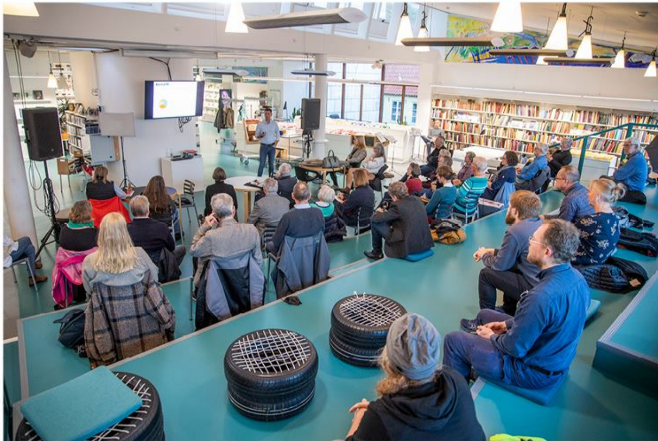
Rejhan Bosnjak fortæller om mindretallets fortid og nutid.