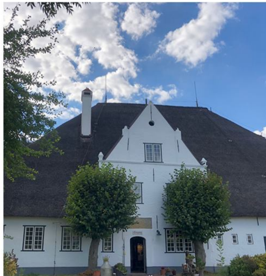
Den legendariske Roter Haubarg.