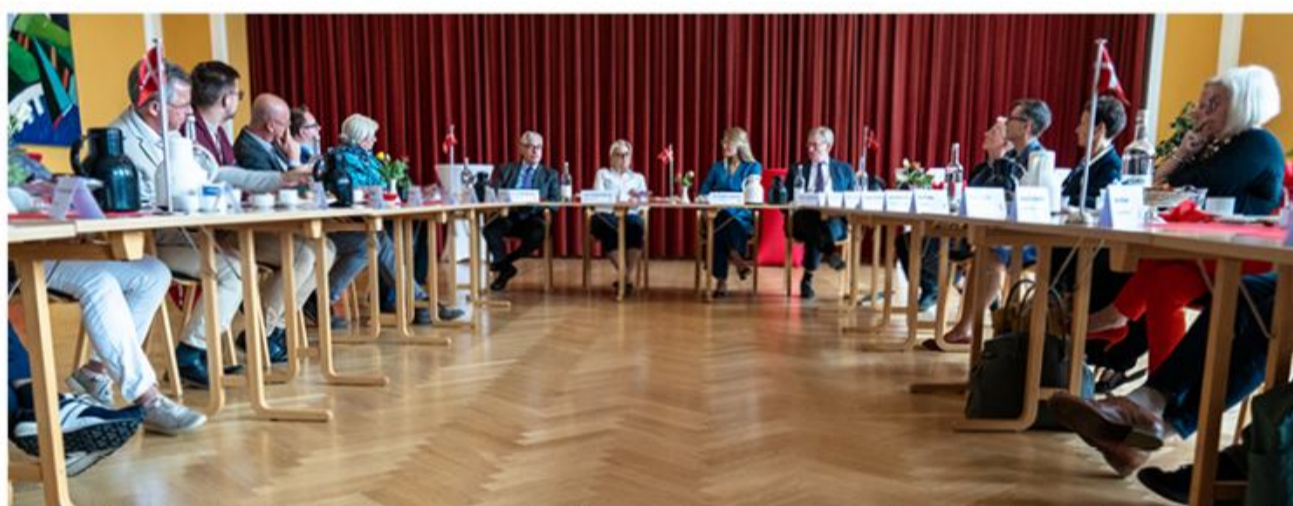
Ane Halsboe-Jørgensen, Danmarks kultur- og kirkeminister, mødte repræsentanter fra de danske organisationer i Sydslesvig.