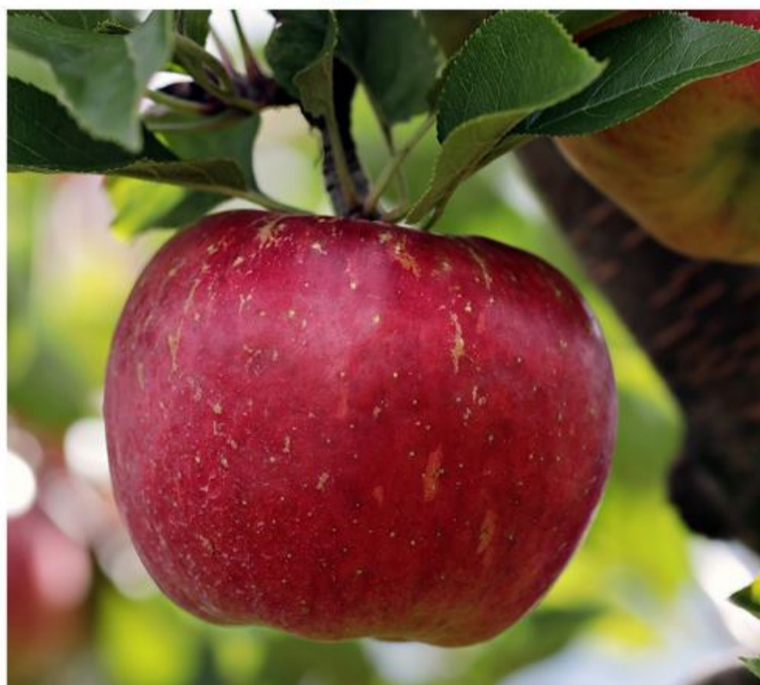
Fra 19.-26. september holdes Slesvig Æble Festuge, en dansk festuge med arrangementer rundt om det lækre, sunde og runde æble.

Grill med æbler og fælles aktiviteter Onsdag 21.9. kl. 17-19 UNGEGRUP-