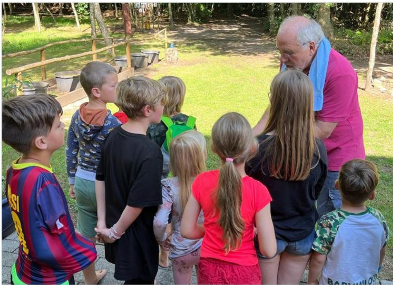
I barfodsparken kan både børn og voksne sanske skoven på en helt anden måde.