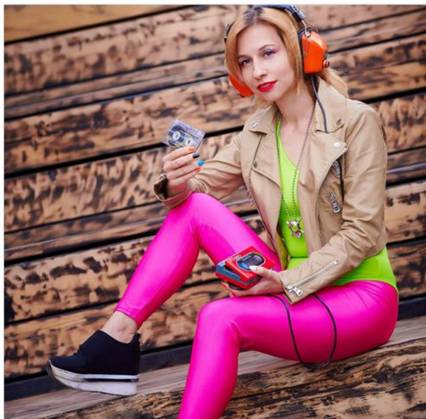
Der er præmier for bedste 80'er udklædning.

SSF Rendsborg beder om tilmelding til Sonja på 0172 18 88 5 66 (gjerne via WhatsApp).