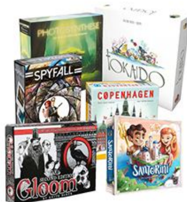
Et udvalg af brætspil.