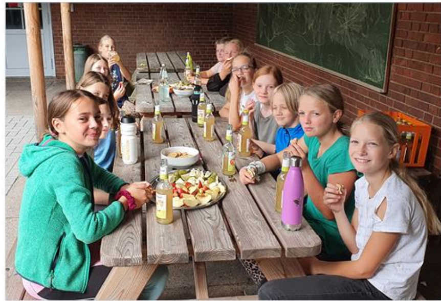
Dagen blev afrundet med sodavand og kage.