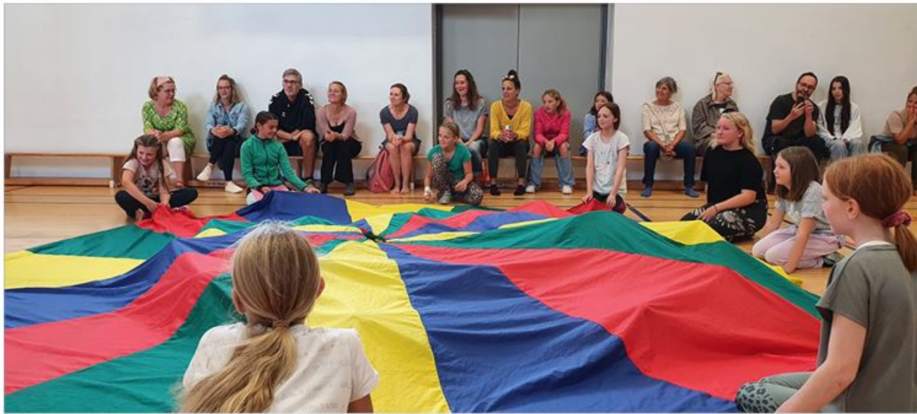
SSF Bredstedts ethjulsdag bød på stort show.