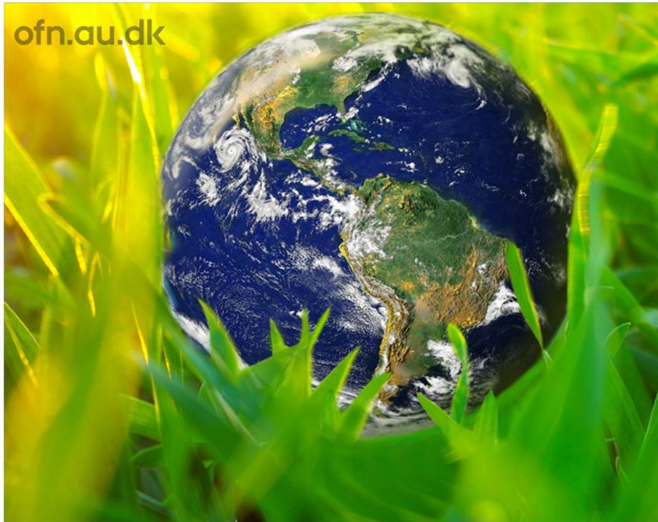
På Flensborg Bibliotek er der livestream-foredrag om, hvordan mennesket har forandret jorden.