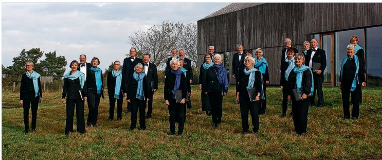
Hørsholm koret.