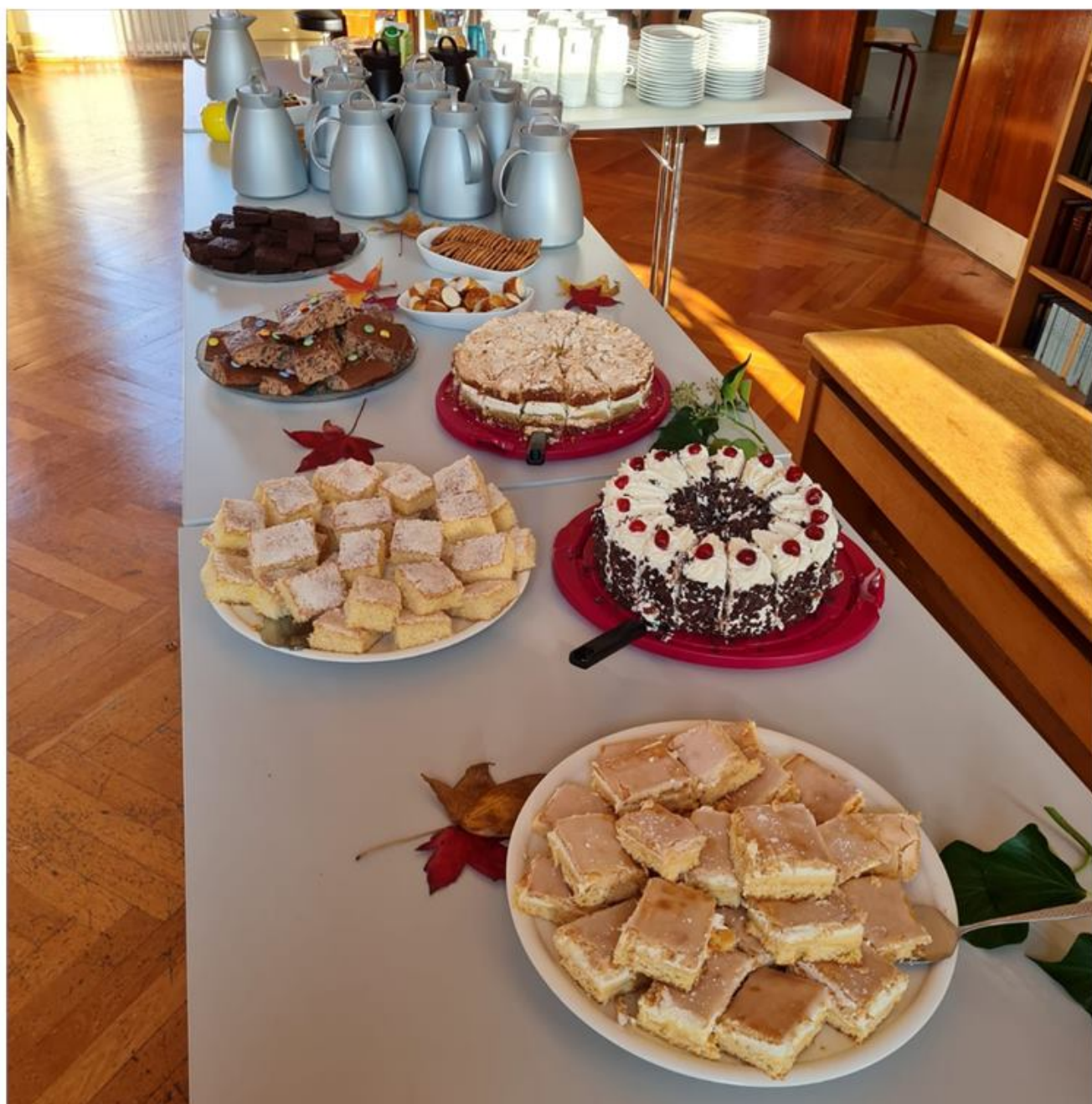
Der er altid et væld af lækre kager, når Uffes Kaffebær er åben. Det er skolens forældre, der leverer.

Kaffebæren åbner klokken 15, og bogbussen holder i skolen fra klokken 14:30.