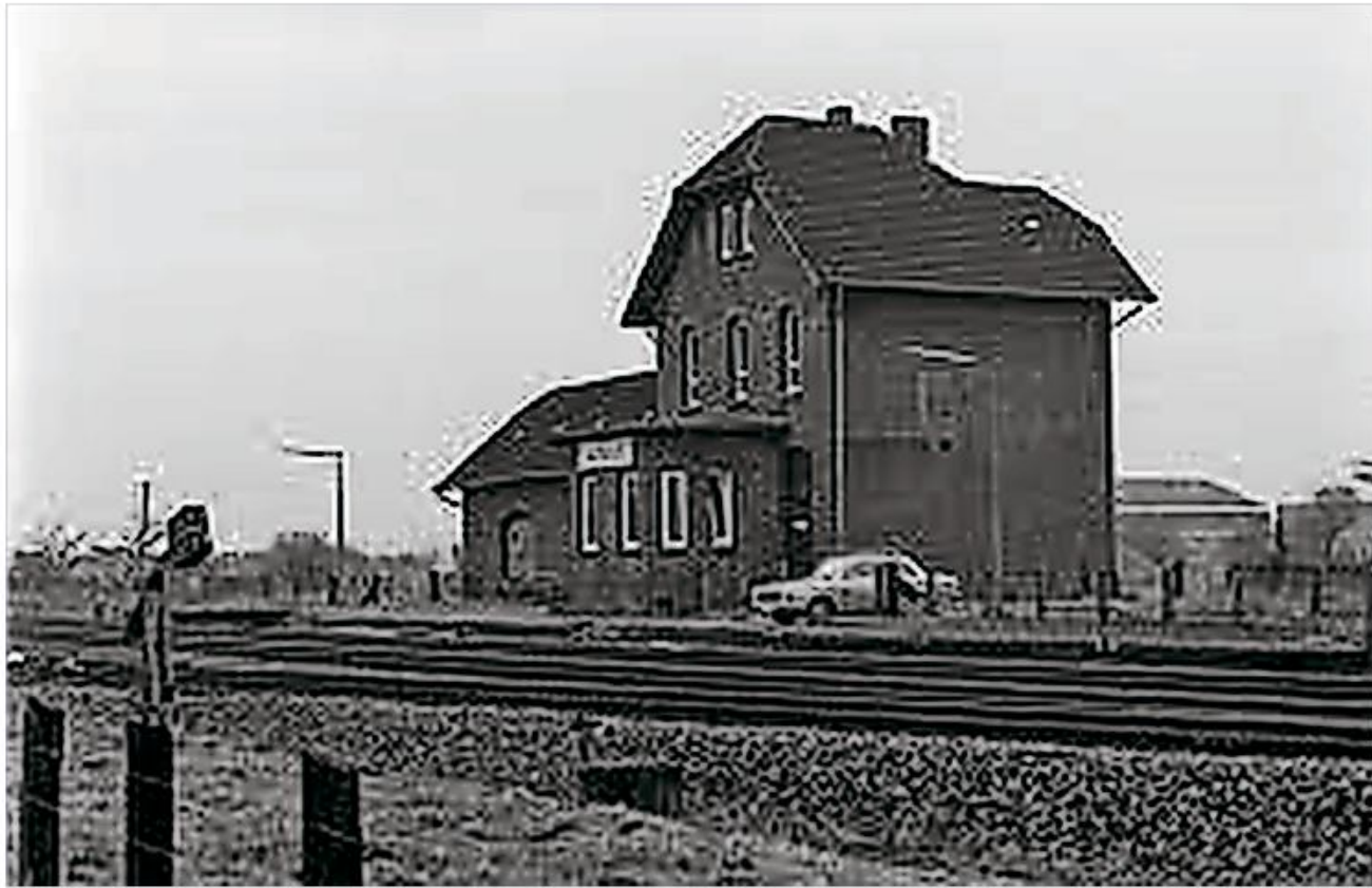
Omkring 1600 fanger fra Frøslevlejren blev via banegården i Harreslev deporteret til tyske koncentrationslejre.