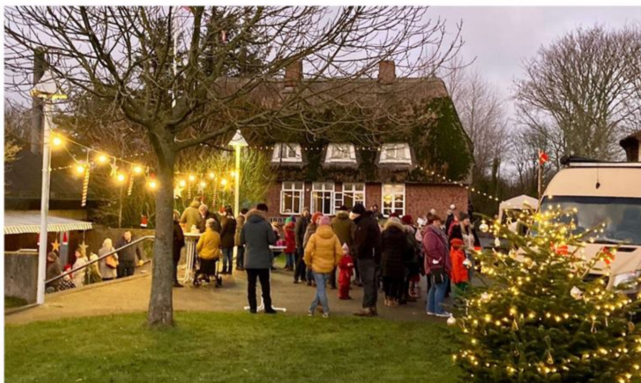
Der blev snakket ...