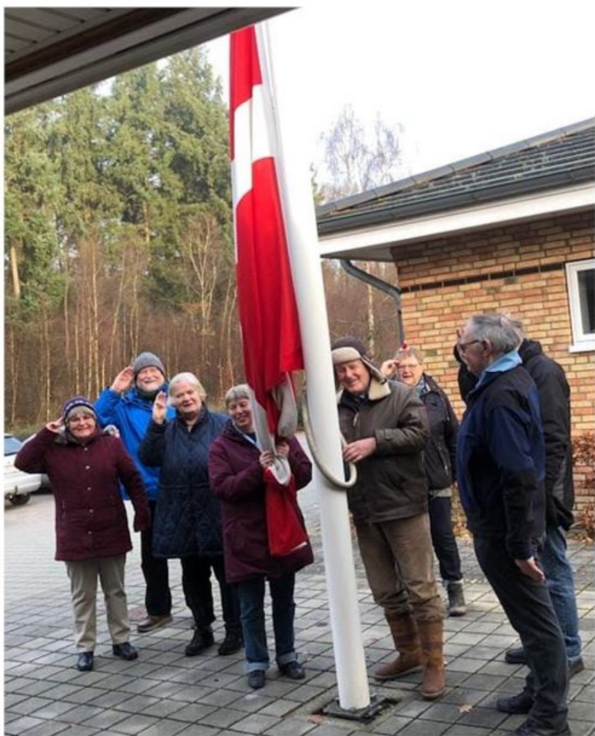
Flaget hejses.