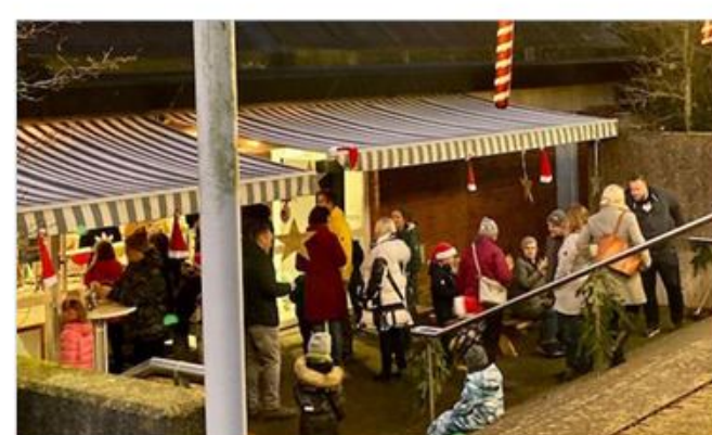
... og der blev nydt.