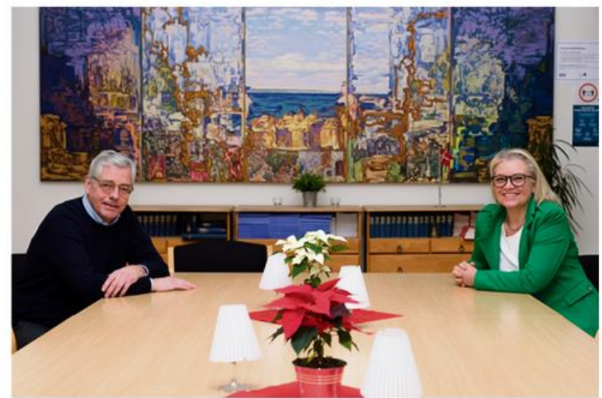
SSFs formand og generalsekretær ser frem til et mere normalt 2022.