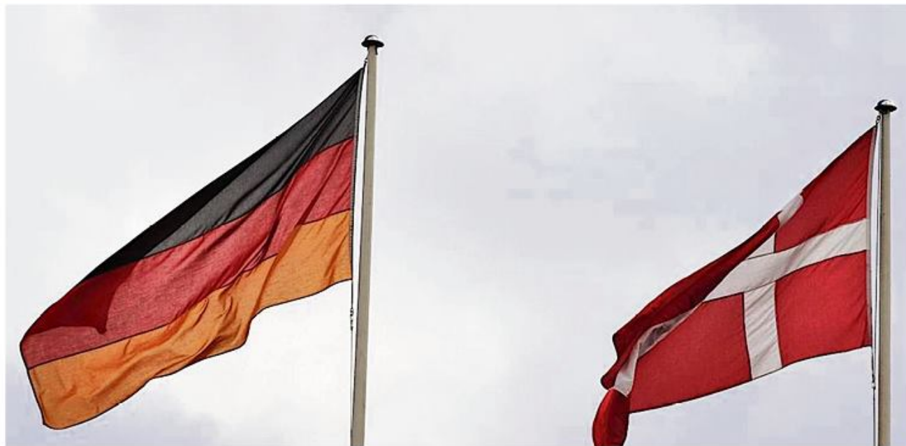
Den dansk-tyske mindretalsmodel blev ikke anerkendt som immateriel kulturarv. (Ill.: GF)