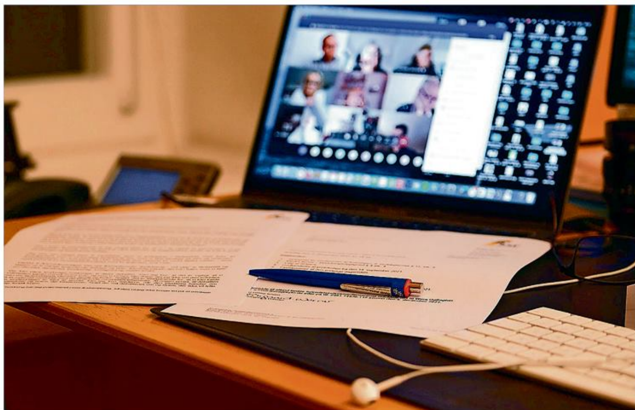
På det digitale hovedstyrelsesmøde sidst efterlystes oprettelsen af et online-stambord.