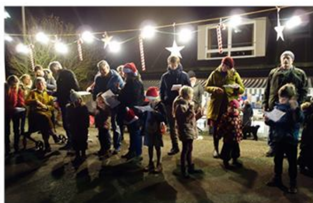
... og der blev sunget ...

bejde, der har gjort det vellykkede arrangement muligt, og stor tak til alle de flittige hjælpere. Vi glæder os til næste år, for vi vil helt afgjort gentage vores fælles julehygge. Glædelig jul fra Sild.