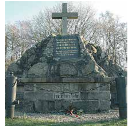
Det østrigske mindesmærke.

dette års taler af elevambassadører fra Duborg-Skolen og det tyske gymnasium i Aabenraa. Kl. 12 er der mindehøjtidelighed ved det østrigske mindesmærke i Sankelmark. Blæsere fra Satrup og Ugle Herred