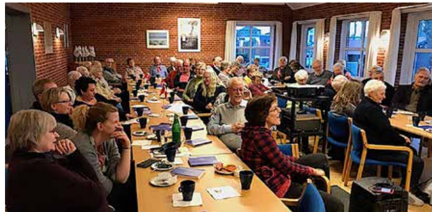
60 til gensynsmøde i Egernførde.