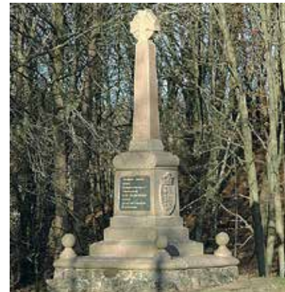
Den danske mindestøtte.

11.30 lægges kransen ved den danske mindestøtte i Sankelmark. Her holdes