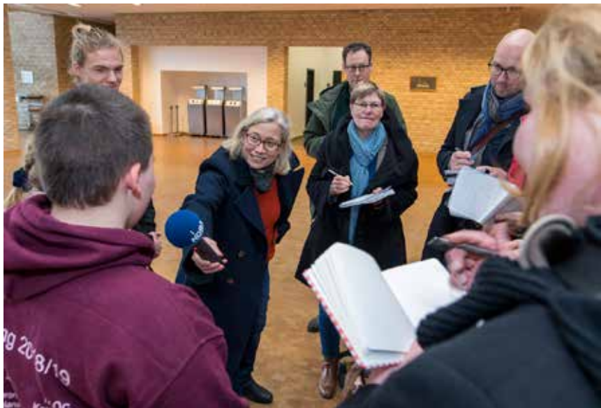
Elevambassadørerne var populære samtalepartnere for de mange journalister.