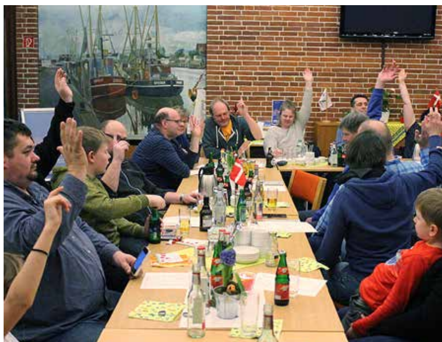
Generalforsamlingerne i Husum er gerne godt besøgt.