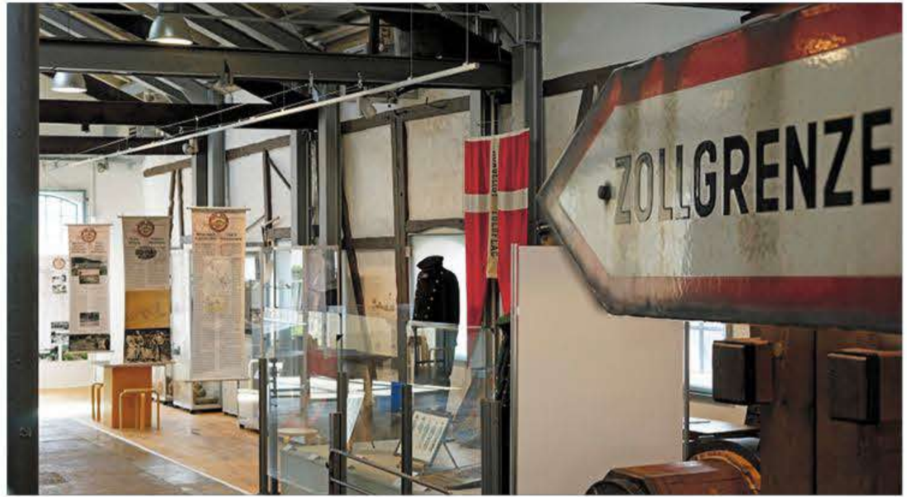
Et blik ind i særudstillingen.