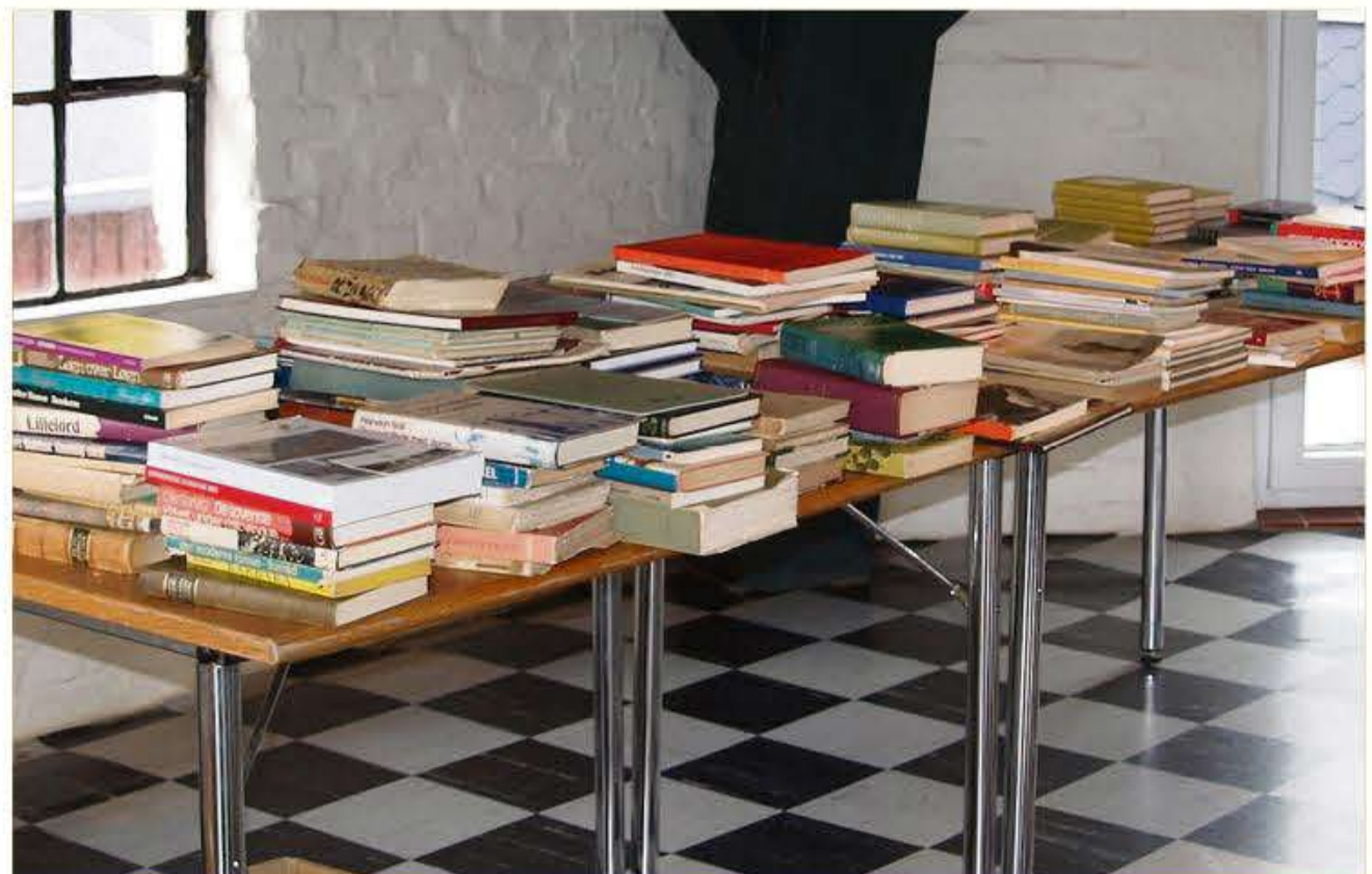
Der er bogudsalg på Mikkelberg.