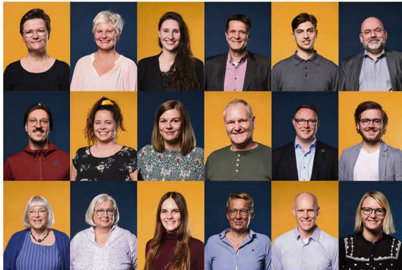
Der er kommet flere til. Her et uddrag af deltagerne ved »Et mindretals ansigter«.

Projektet "Et mindretals ansigter" er i kommende uge i Slesvig og Husum. Tirsdag den 4. maj stiller SSF op på Slesvighus, og torsdag den 6. maj på Husumhus, så flere har mulighed for at være med.