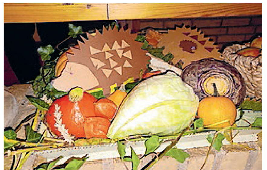
Høstgaverne kom på auktion til fordel for en donation til "Brot für die Welt".

Lørdag holdt det danske mindretal i Frederiksstad fælles høstfest. Omkring 35 deltager – store som små – mødtes til høstgudstjeneste i Menonitterkirken, som elever fra Hans Helgesen Skolen og børn fra Frederiksstad-Dragge Daginstitution havde pyntet. Derefter gik turen til Ejderviking, hvor de danske foreninger vartede op med lækker grillmad samt fine hjemmelavede salater. Men arrangementet bød ikke kun på hygge for medlemmerne. Høstgaverne blev nemlig solgt i en auktion til fordel for projektet "Brot für die Welt". Det var gaver som for eksempel hjemmebagt Kürbisbrød, hjemmelavet marmelade og diverse kål-arter. På den måde opnåede donationen op på 193 euro, der blev rundet op på 200 euro. Det var alle byens danske foreninger og institutioner, der stod bag det vellykkede arrangement.