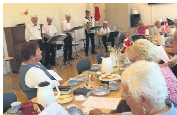
Folmer og Basserne underholder.

Slesvig. Vores næste komsammen er den 18. oktober kl. 14 med bingo. Der bedes om tilmelding hos Christa eller senest den 14.10. Alle er velkommen!