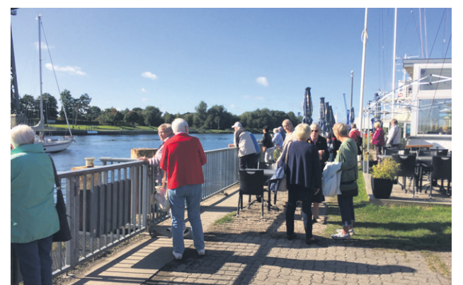
Hyggestund på Brückenterrasse.