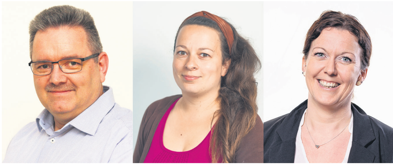
SSWs hold i Husum inviterer til åbent hus-arrangement.