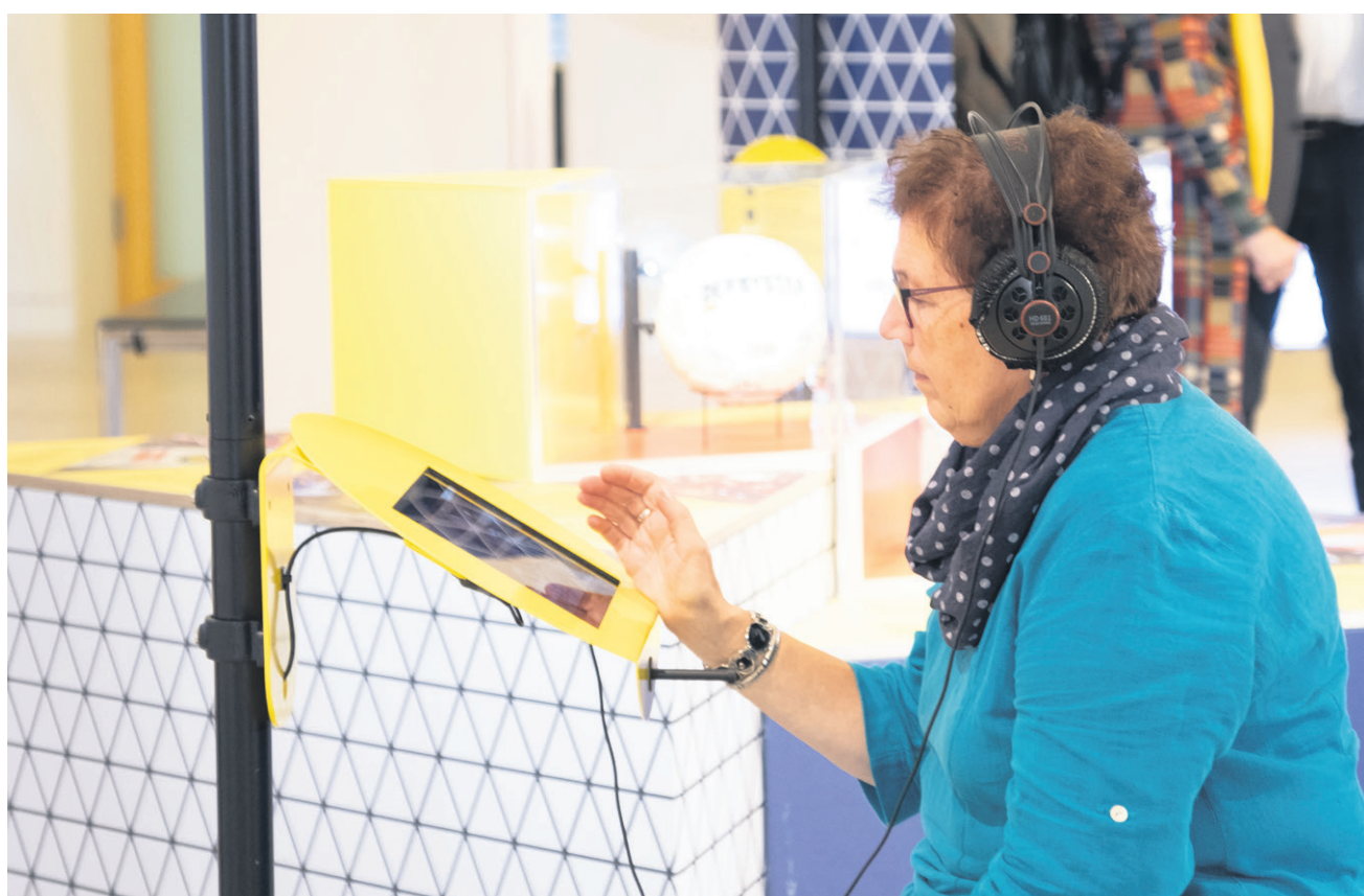
Onsdag aften kunne de første besøgende afprøve de interaktive dele af udstillingen.