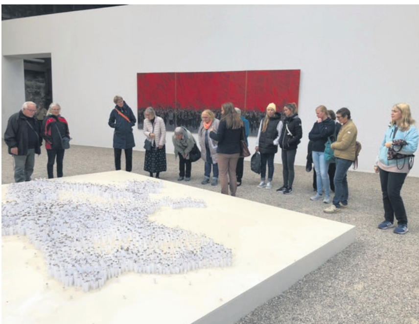
SSF-distrikt Nord var igen på vellykket tur til NordArt i Bydelstorp.

ind til udstillingen, hvilket var endnu en ingrediens til, at det hele var en god oplevelse. Udstillingen var både i parken og i Carlshytte. Den kulinariske afslutning skulle selvfølgelig heller ikke mangle og det var i form af lækker Flammkuchen i "Alte Meierei", som lå direkte i NordArt.