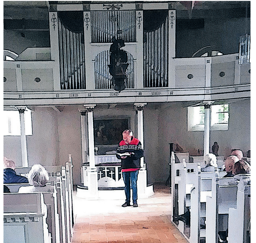
I Skipperkiren i Arnæs blev der sunget fra den dansk-tyske salmebog.