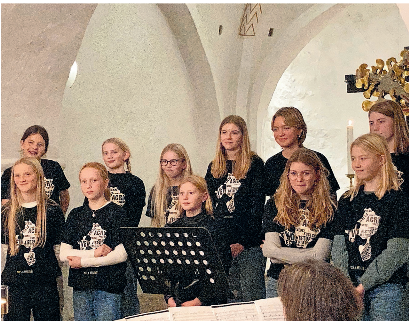
Mols-Helgenæs Ungdomskor.

Hamborg med en tysk far og en dansk mor. Nu er hun organist og korleder for syv kirker på Mols og Helgenæs. Alle er meget velkomne.