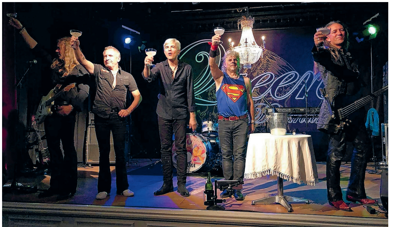
Queen of Denmark leverede et fantastisk show på Sild.