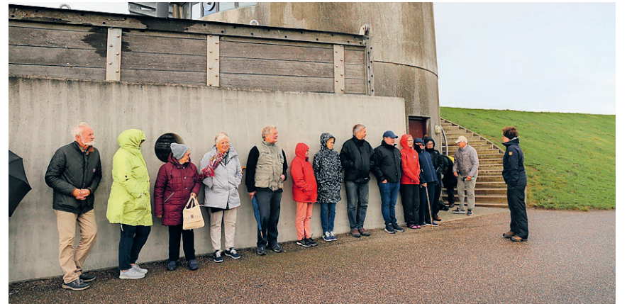
Deltagerne kryber i læ for regn og storm ved Vidåslusen.