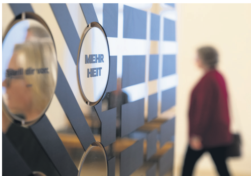
Indtil den 31. oktober kan vandredstillingen ses i Slesvig-Holstens parlamentsbygning.