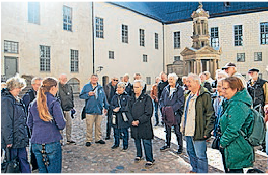
Turen til Kalmar og Gotland var en stor succes. Derfor vil SSF Flensborg By også tilbyde den i 2023.