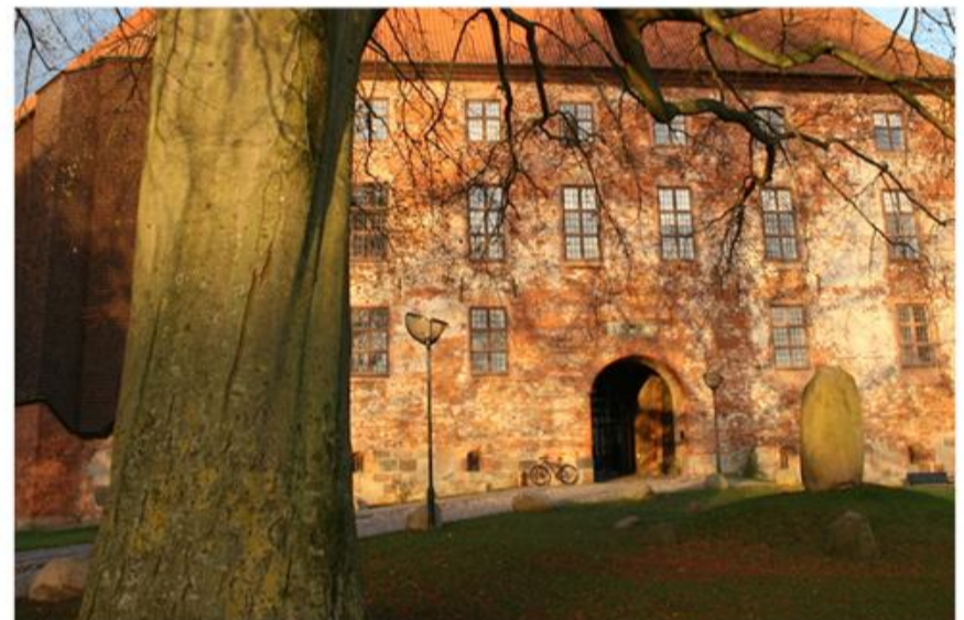
Koldinghus er målet for SSF Flensborg amts juletur i år.