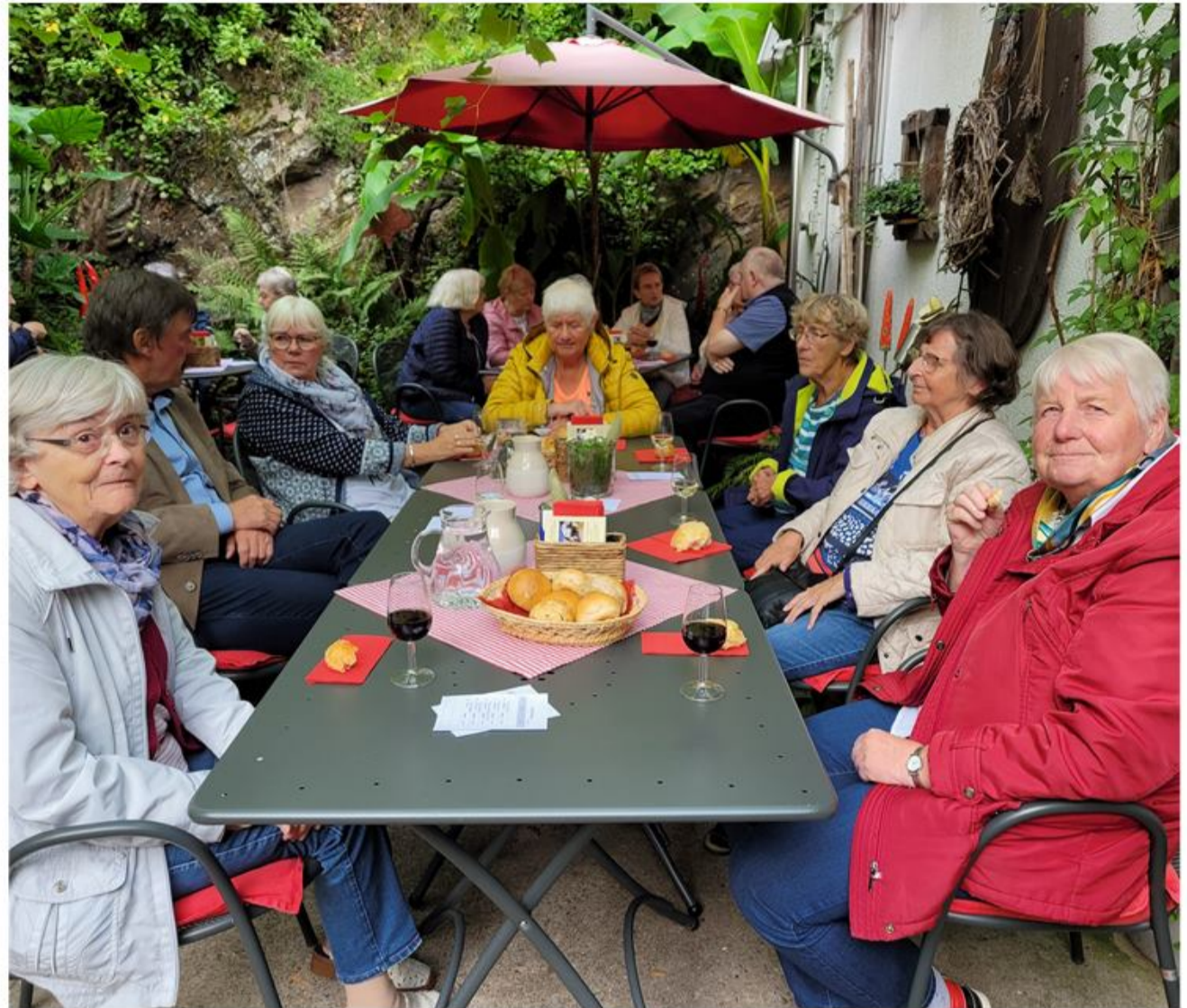
Der var smagsprøver hos en vinbonde.