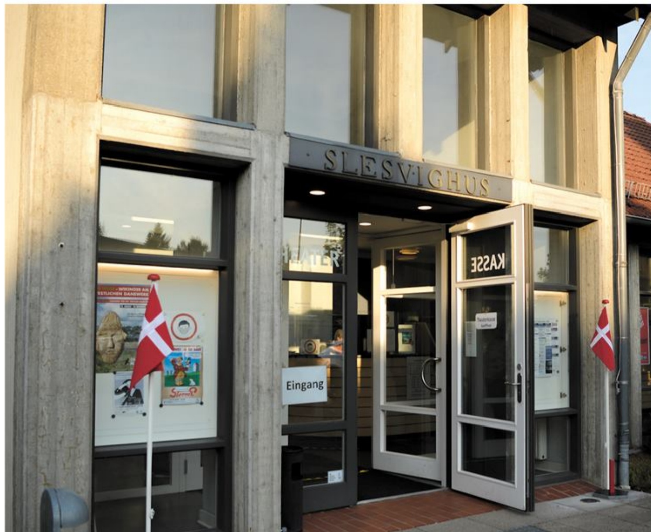
Slesvighus i Slesvig danner i år rammen om SSFs landsmøde, der lykkeligtvis atter kan gennemføres fysisk 13. november.