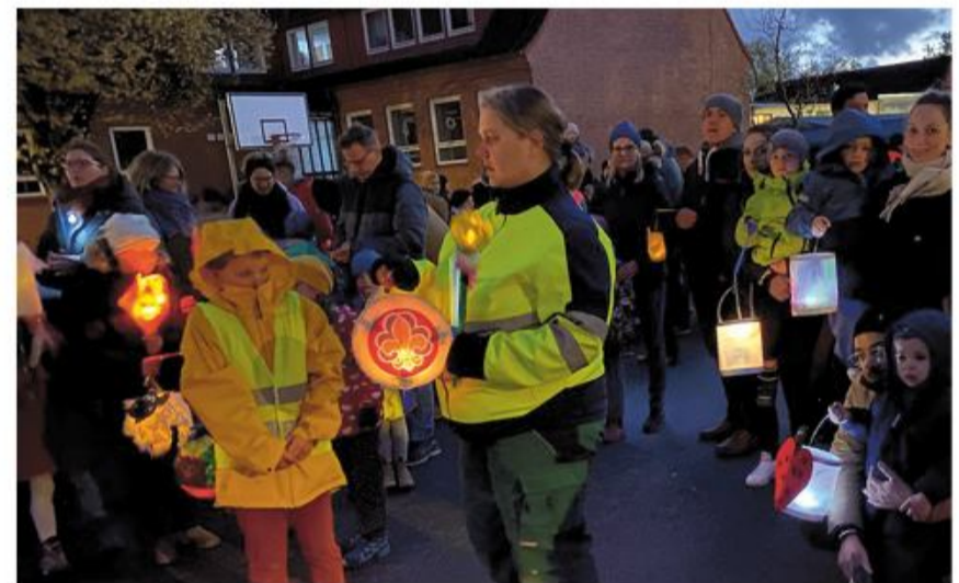
Tusmørket sænker sig...