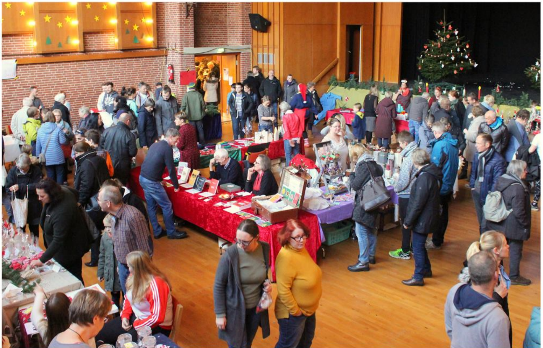
Julemarkedet i Husum plejer at være godt besøgt.