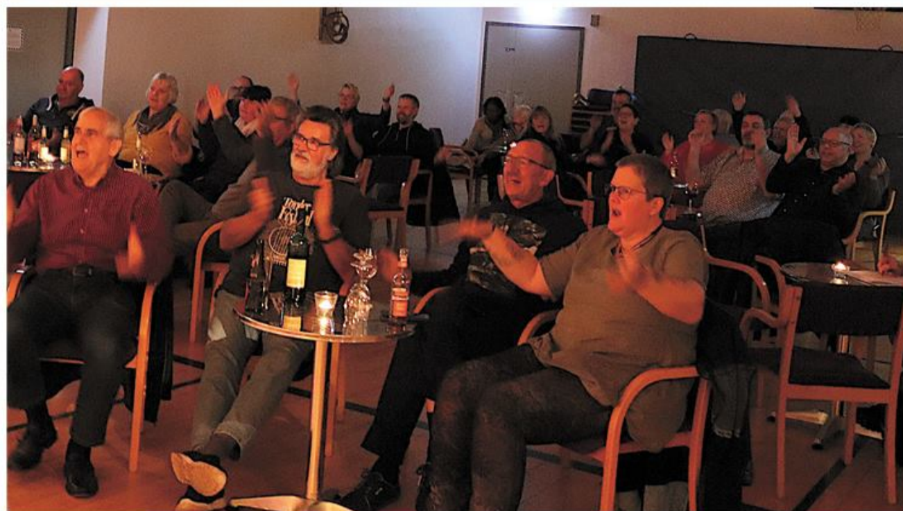
Publikum var med fra start til slut.