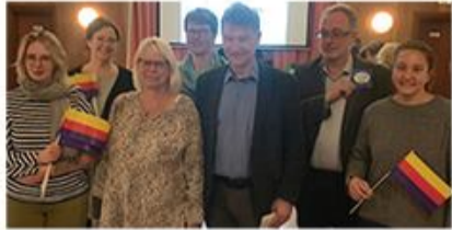
Der neue Vorstand von Friisk Foriining.

Auf der Mitgliederversammlung am 28. Oktober in Risum-Lindholm bekam die Friisk Foriining eine neue Vorsitzende und einen weitgehend neuen Vorstand.