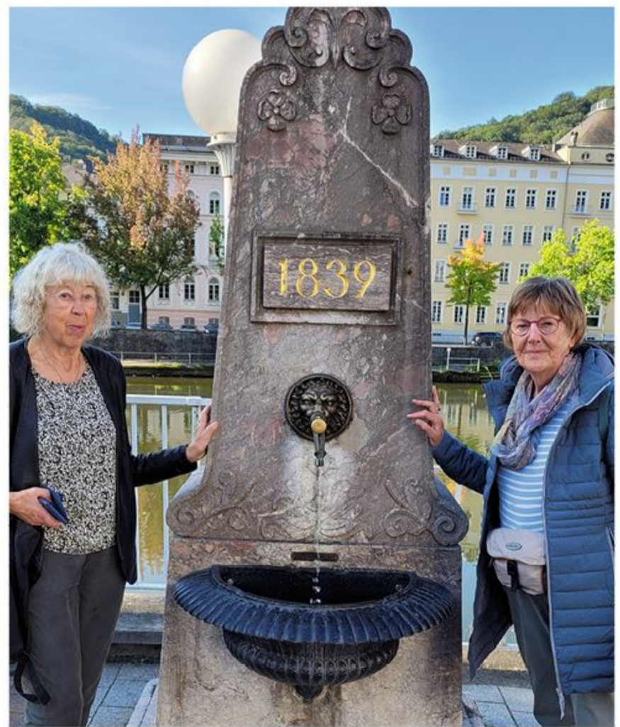
Her var der dog kun vand at hente.