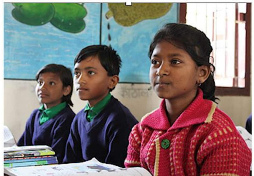
Nogle af børnene i Saraswatipur.