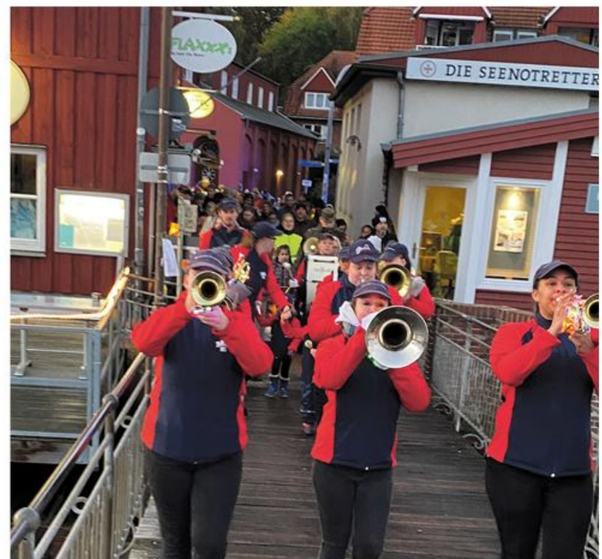
Og afsted med musikkorpset i spidsen.

Efter turen kunne der købes pølser og sodavand i skolegården, mens der blev danset og vipet med lanterne i takt til Rendsborg Musikkorps' gode musik.