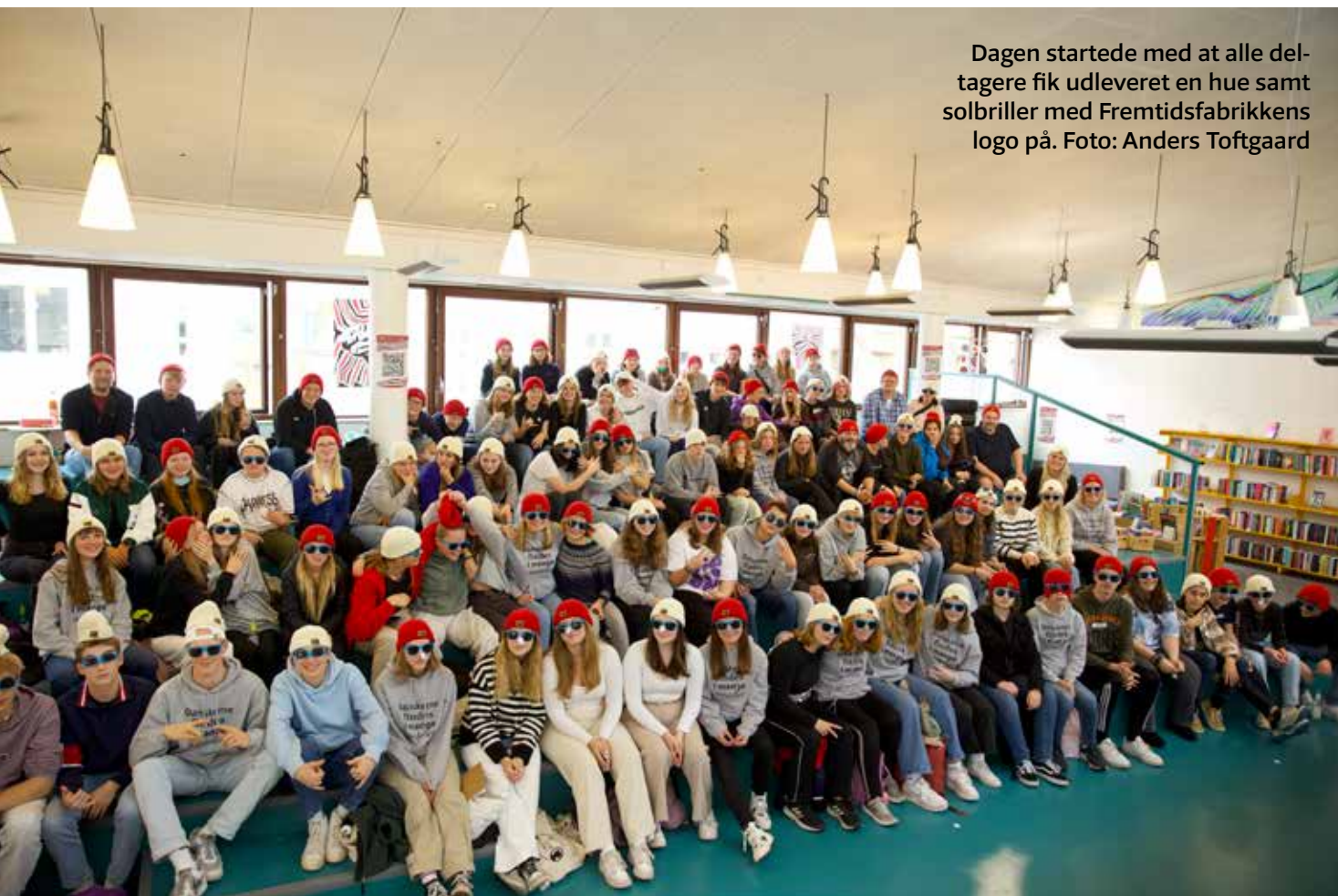
Dagen startede med at alle deltagere fik udleveret en hue samt solbriller med Fremtidsfabrikkens logo på.

- De nuværende elever på vores danske skoler udgør en væsentlig del af mindretallets fremtidige voksne medborgere. Hvis vi vil have et stærkt mindretals-sam-