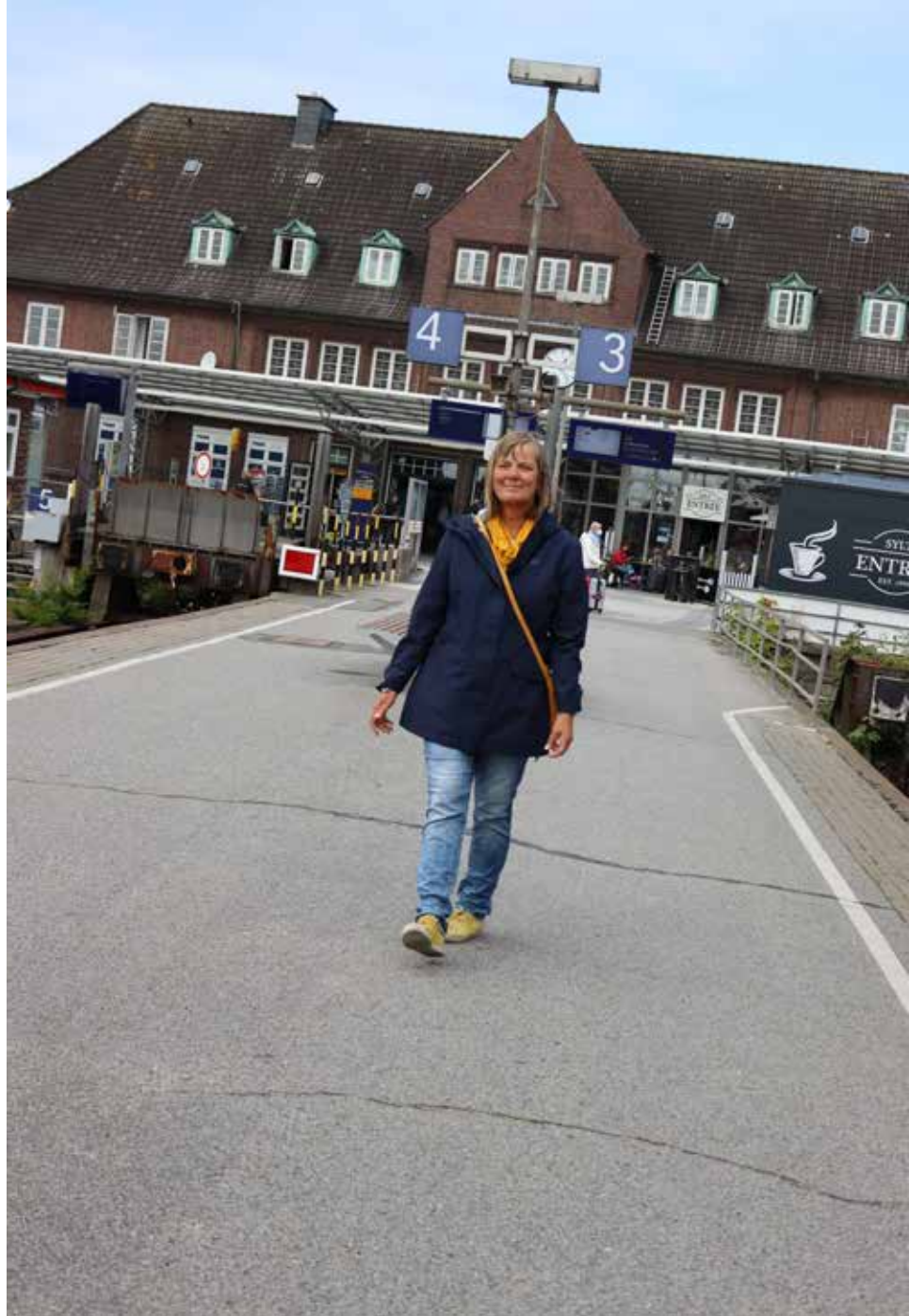
Togrejser til fastlandet er en del af livet, når man har tillidshverv i mindretallet.

Når man taler for en prinsesse, føler man sig virkelig dansk.