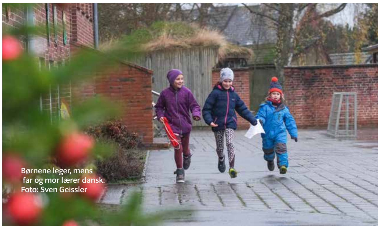
Børnene leger, mens far og mor lærer dansk.