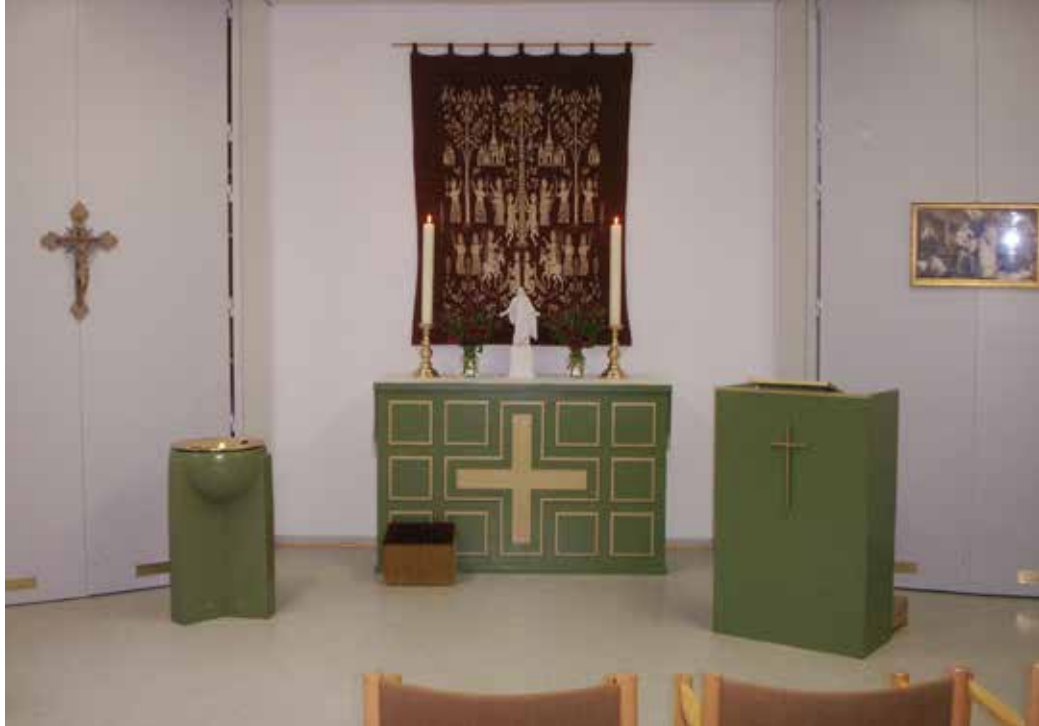
I Hatsted bliver der stadig af og til holdt gudstjenester i forsamlingshuset.

Først 17 år senere i 1969 fik de danske menigheder igen adgang til de tyske sognekirker. Men da havde mange menigheder gjort så meget ud af deres skolekirke og vænnet sig til dem, at man ikke var klar til at opgive dem. Og dog. Ønsket om en stor, flot, RIGTIG kirke, hvor man var herre i eget