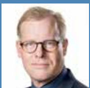
Carl Holst, MF Fhv. minister