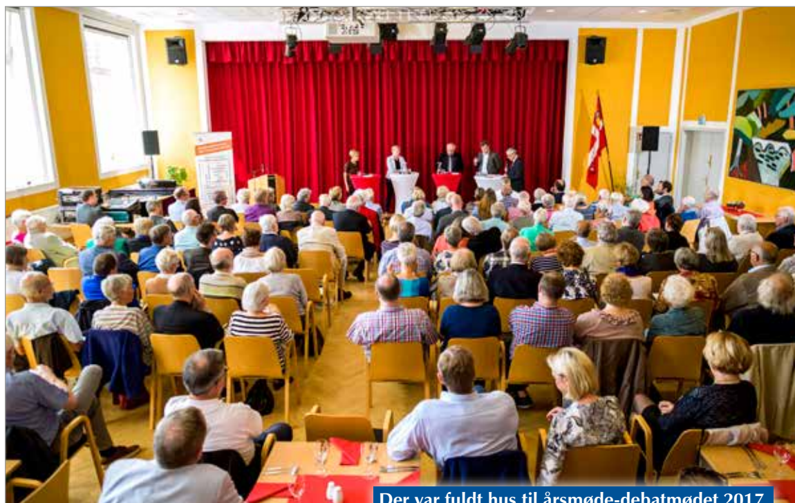
Der var fuldt hus til årsmøde-debatmødet 2017