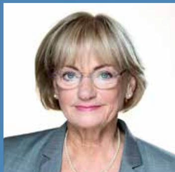
Pia Kjærsgaard, MF Folketingets formand