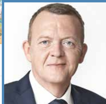
Lars Løkke Rasmussen Statsminister