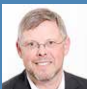
Mette Bock, MF Kultur- og kirkeminister