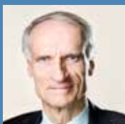
Bertel Haarder, MF Nordisk Råd, fhv. minister