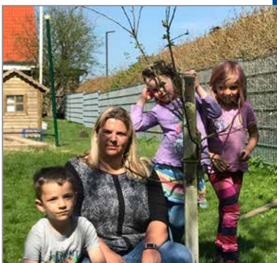
Ejdersted amt: Garding Danske Børnehave

Den gamle danske æblesort fra 1700-tallet stammer oprindeligt fra slotshaven ved Gråsten Slot. Træerne skulle illustrere den frugtbarhed og foryngelse, der kom til udtryk i årsmødemottoet 2017 "Fornyelse skal der til".