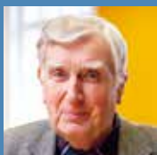
Torben Rechendorff Fhv. minister