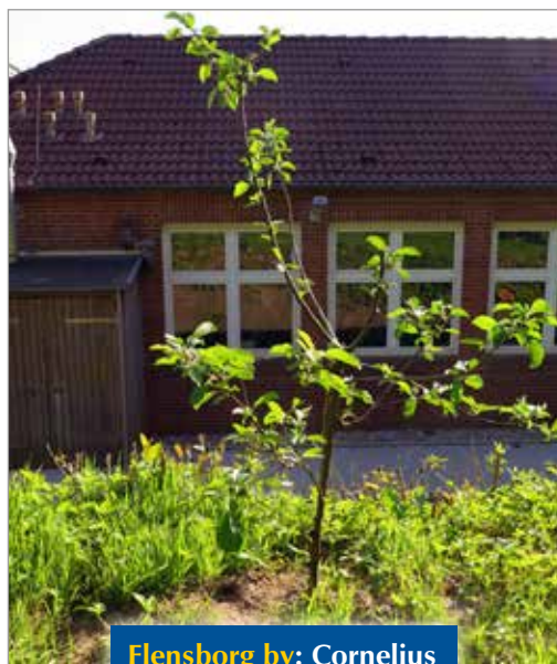
Flensborg by: Cornelius Hansen-Skolen