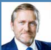
Anders Samuelsen Udenrigsminister