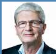
Holger K. Nielsen, MF Fhv. minister