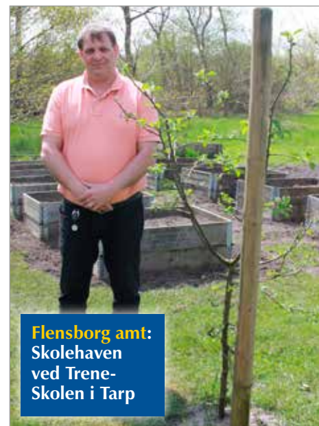
Flensborg amt: Skolehaven ved Trene-Skolen i Tarp