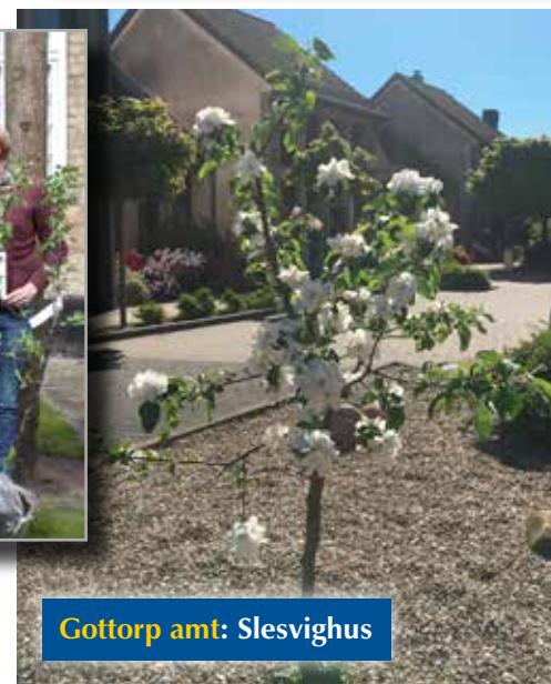
Gottorp amt: Slesvighus

I forbindelse med årsmøderne 2017 overrakte årsmødeudvalget amtskonsulenterne et Gråsten-æbletræ hver.