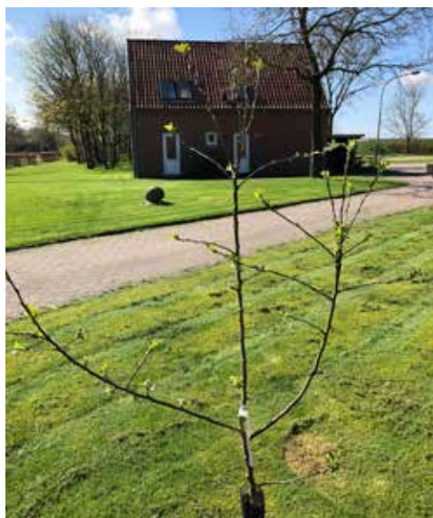
Sydtønder amt: Skolehaven i Ladelund