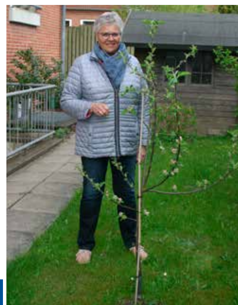
Rendsborg-Egernførde amt: Pensionistboligerne Egernførde

Det gode budskab: Fornyelsen er på vej. Alle træer har overlevet og har i de sidste uger stået i fuld blomsterflor.