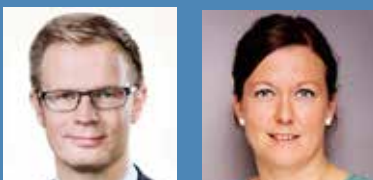
Benny Engelbrecht, MF fhv. minister