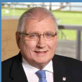
Klaus Schlie, MdL Landdagspræsident