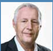
Henrik Dam Kristensen, MF Folketingets næstformand