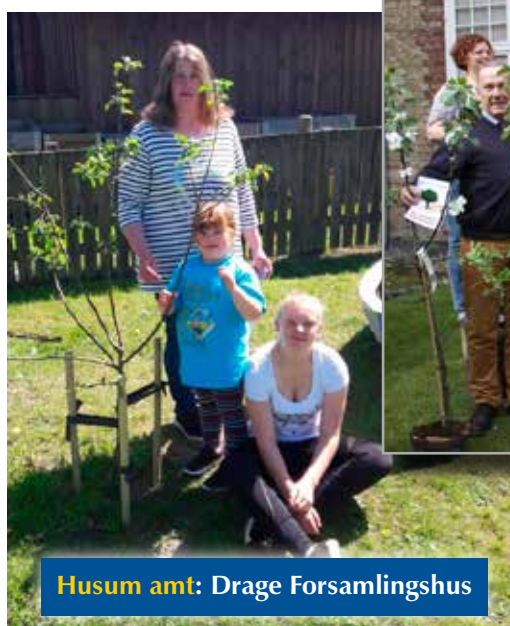
Husum amt: Drage Forsamlingshus