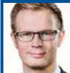
Benny Engelbrecht MF (S), fhv. minister