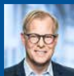
Carl Holst, MF (V) fhv. minister