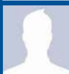
Søren Timm spejderleder