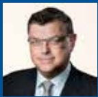
Mogens Jensen MF (S) fhv. minister formand for Foreningen Norden i Danmark