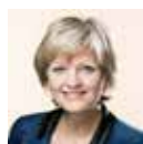
Eva Kjer Hansen (V), minister for fiskeri, ligestilling og nordisk samarbejde.