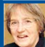
Gudrun Lemke SSW-formand borgmester