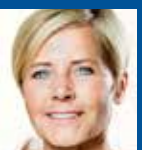
Mette Bock MF (LA) kirke- og kulturminister