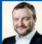
Magni Arge MF (Tjoöveldi)