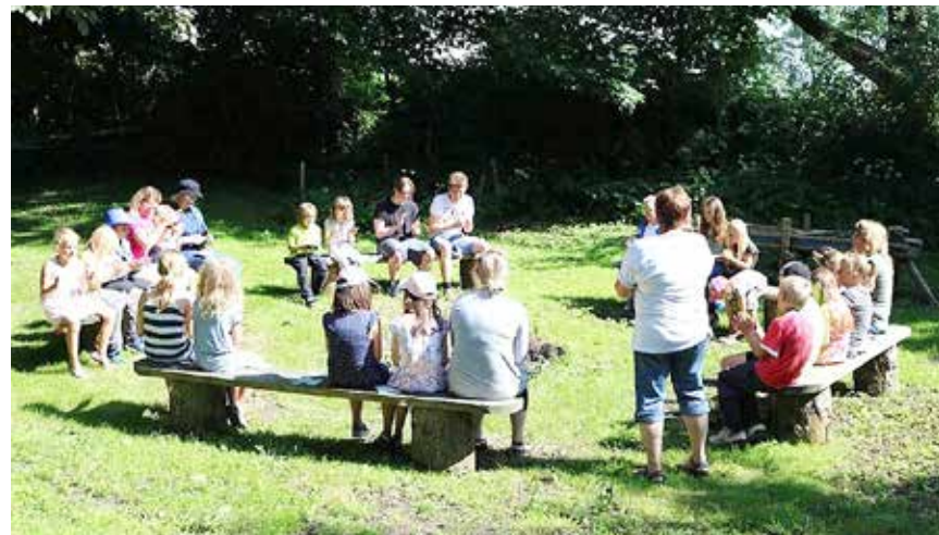
Fællessang inden mødet går i gang. Det gode sommervejr gav mødet en helt særlig stemning.