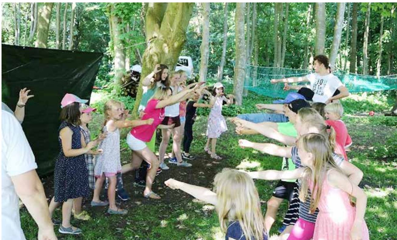
Intet FDF møde uden leg. Børn i alle aldre og voksne starter med at lege en deluxe udgave af sten-saks-papir.