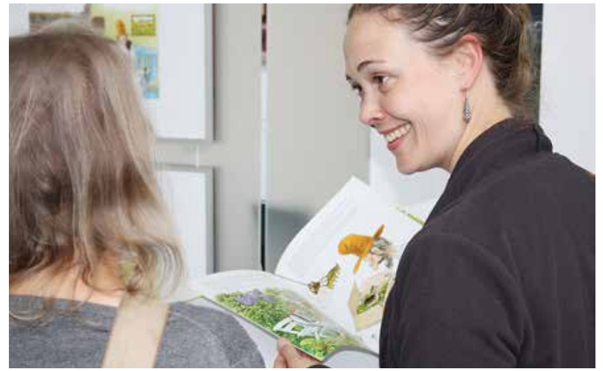
Tegningerne om den charmerende kat Findus med de grønne smækbukser appellerer også til de mere voksne børnebogs-læsere.