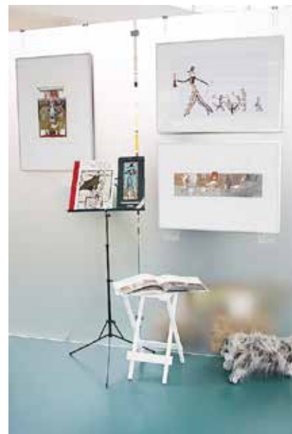
Flere af de originale illustrationer udstilles sammen med en original udgave af den tilhørende børnebog, der selvfølgelig er slået op til den helt rette side og med tekst og historie på originalsproget.