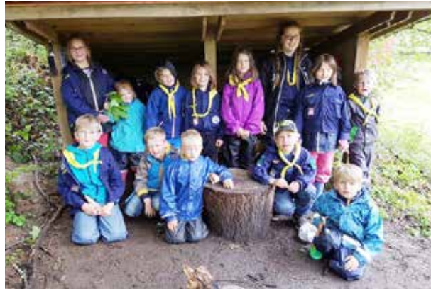
I løbet af det næste års tid skal disse friske Ulve- og Bæver-spejdere fra Karsten Thomsen Gruppe i Langbjerg overnatte under åben himmel mindst én hver måned, så de alle sammen kan sy det eftertragtede Shelyt-mærke på ærmet af deres spejderuniform.

[KONTAKT]Spejderne i Karsten Thomsen Gruppe i Langbjerg, der har eksisteret siden 1982, og som hører under Dansk Spejderkorps i Sydslesvig, er tilsyneladende gjort af et ganske særligt stof.