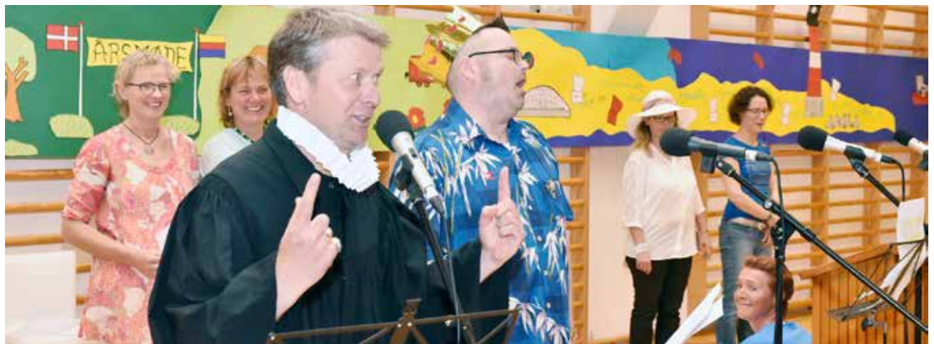
Dialogen mellem 'den lokale præst' og Prinsgemalen, med udsigt til at blive ny generalkonsul i Flensborg, var et af årsmøde-revyens ubetingede glansnumre.