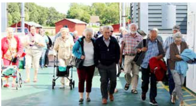
Trods startvanskelighederne først på dagen, nåede deltagerne alligevel helt ud på Årø. Her på vej ombord på den lille ø-færge.