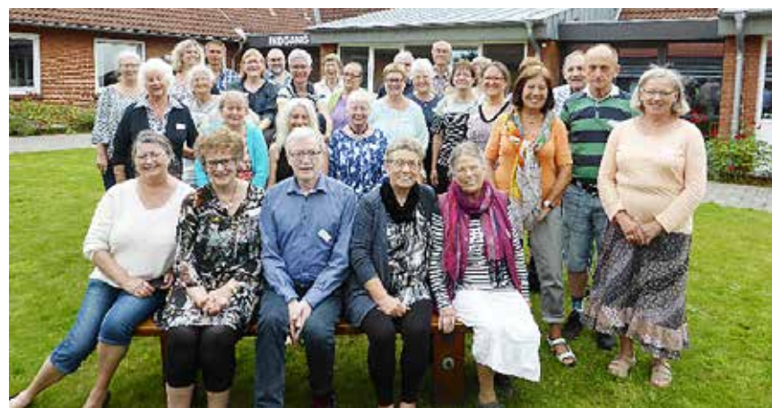
Her ses deltagerne fra sidste års sommer-ugekursus i intensiv korsang på Jaruplund Højskole.

Der er gratis adgang til koncerten. I ugens løb har de deltagende korsangere også kunnet se frem til nogle hyggelige timer i Hamborg med en indlagt balletforestilling i Staatsoper.