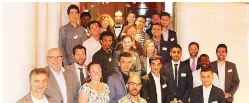
Die »Festmacher« der ersten Runde - hier mit den Vertretern der Ausbildungsbetriebe - starten ab September in ihre Ausbildung.

Weitere Informationen und Bewerbungsunterlagen auf: www.ihk-sh.de/festmachen-auf-sylt