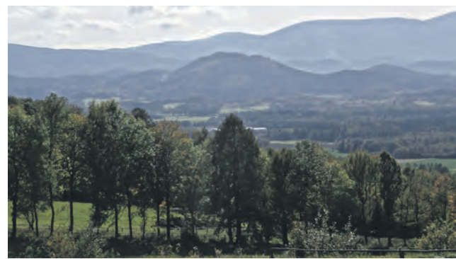
Det smukke og kuperede bjerglandskab Riesengebirke indgår også som en del af programmet på næste års fællestur til Polen; arrangeret i fællesskab af Grænseforeningen Kreds 20 og SSF Flensborg Amt.