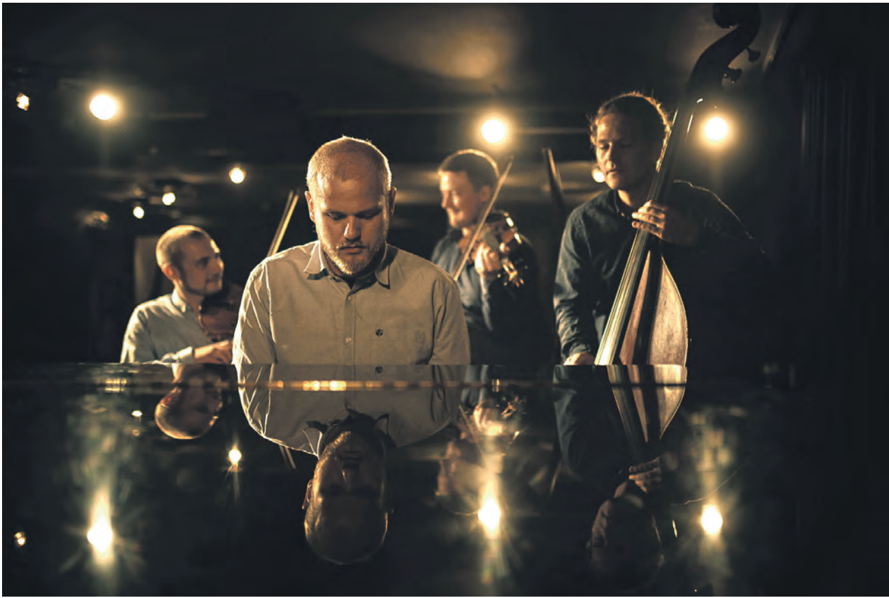
Det spændende og nydanske folkband Trias, der lige nu også er pladeaktuel med sin anden pladeudgivelse "Efter horisonten", giver torsdag aften i næste uge koncert i Menighedshuset på Adelby Kirkevej i Flensborg.