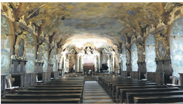
Deltagerne får også mulighed for at opleve den smukke baroksal Aula Leopoldina ved Universitetet i Wroclaw.