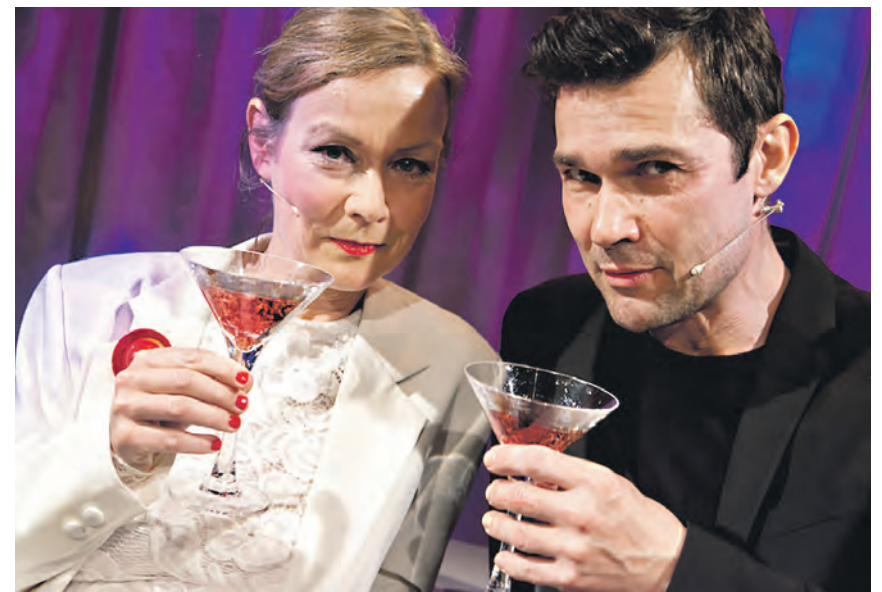
Er der mon stadig en sjat af ungdommen tilbage i cocktail-glassene fra de glade 80'ere, hvor danske Sneakers satte nye musikalske standarder i en tid, hvor der var fart over feltet. Med mere end 30 års tilbageblik har Café Liva opsat cabaret-forestillingen "Efter Festen", som kan opleves på Harreslev Danske Skole.

Arrangør: Sydslesvigsk Forening. Billetter: sss-billetten.de (0049 461-14408125), via SSF's sekretariat, Aktivitetshuset, sh:z Ticketcenter og ved indgangen.