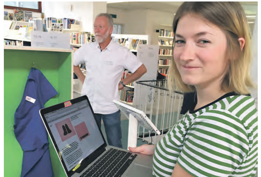
Historien om de enkelte genstande, der indgår i udstillingen Wunderkammer, kan også opleves digitalt via Lisa-Lotta Adomeits personlige hjemmeside.