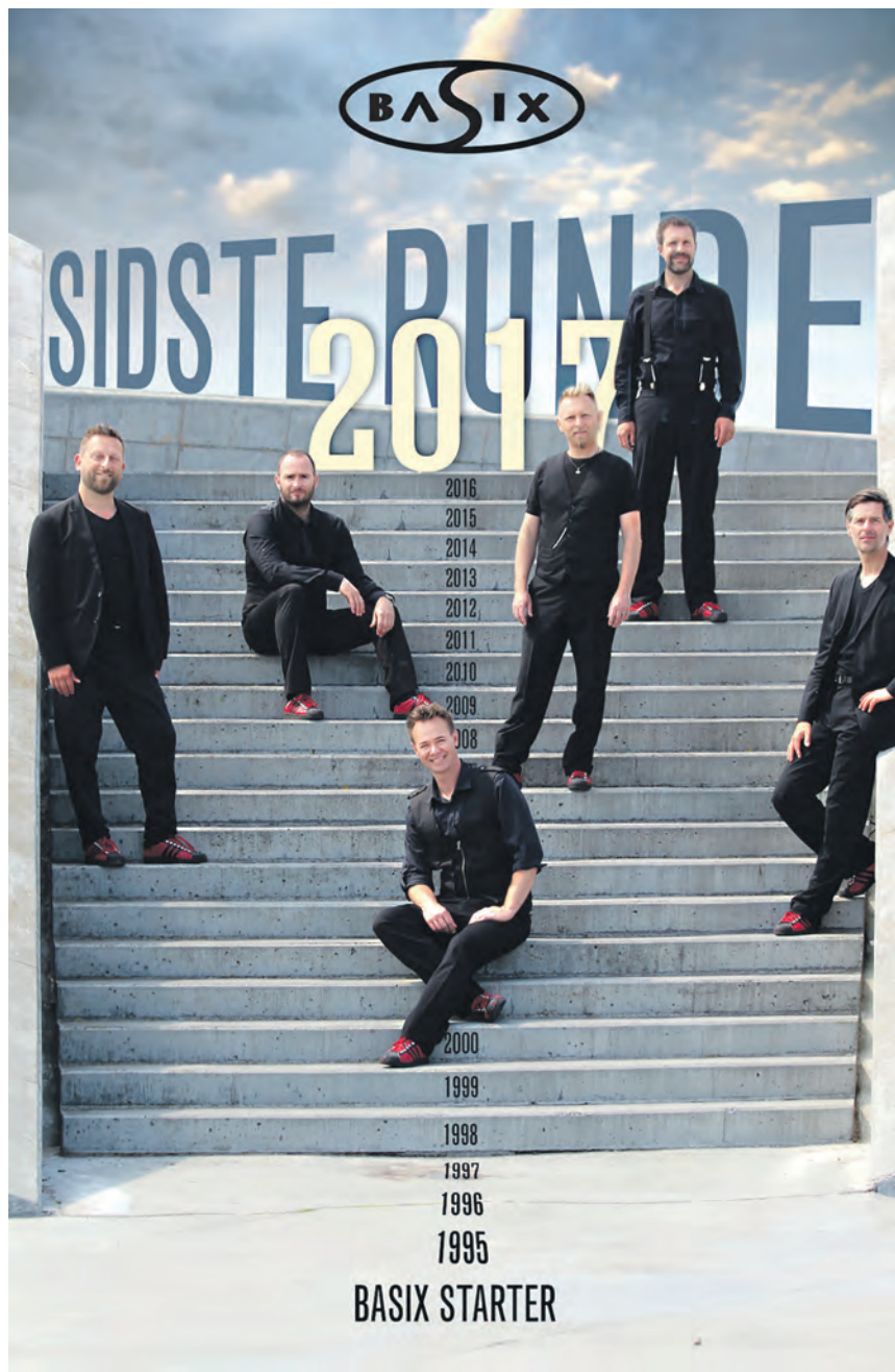
Vokalensemblet Basix optræder på Flensborghus fredag den 29. september. Koncerten er en del af gruppens afskedsturné, da de seks velsyngende herrer har besluttet at indstille karrieren efter 22 år fortræffelig samklang.