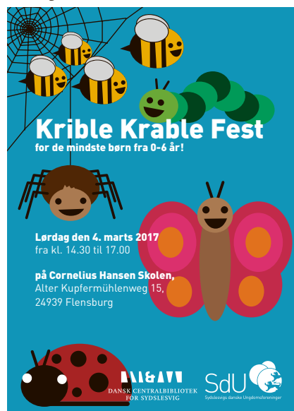
Kribble Krable plakat .

[KONTAKT] Under overskriften 'Kribble Krable Fest' er Sydslesvigs danske Ungdomsforeninger (SdU) og Dansk Centralbibliotek for Sydslesvig klar med en helt forrygende eftermiddag for de allermindeste, hvor alle kan synge, danse og hoppe til en perlerække af børnevenlige sange og musik. Bandet Stjernekuufferten optræder med en såkaldt Lille Peter Edderkop-koncert, hvor repertoiret og sangvalget er plukket direkte fra børnenes elskede sangbog 'De Små Synger'. Undervejs kan børnene også tumle og lege i hoppeborgen og på airtrack-matten, kaste med bolde og ærteposer eller slås med bløde skumpuder. Kribble Krable Festen finder sted Cornelius Hansen Skolen. Tid: Fredag 4. marts 14.30.17.00. Gratis entré. Et arrangement, der primært henvender sig til børn i 0-6 års alderen.