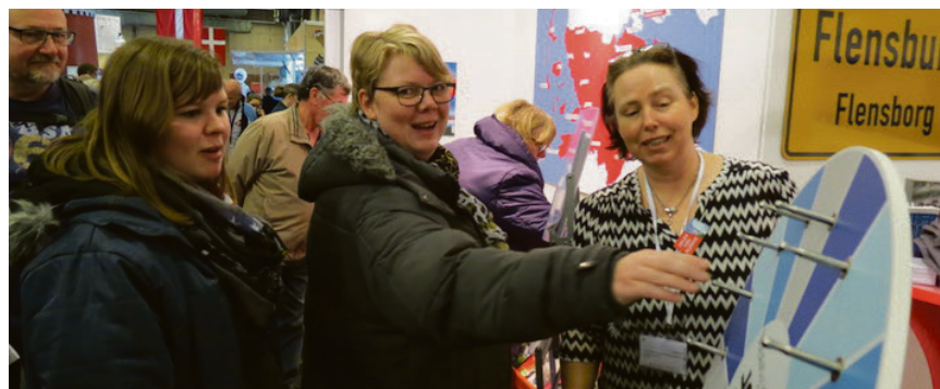
Lykkehjulet er altid en populær aktivitet på vores udstillingsstand under rejsemessen Ferie for Alle i Herning.