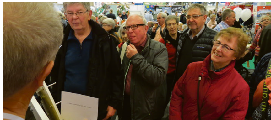
Messesgæsterne kan også deltage i en konkurrence om at vinde to weekendophold for to personer på Kursuscentret Christianslyst.

Sydslesvig Forening og Grænseforeningen udstiller i Hal C på standplads nr. 2520.