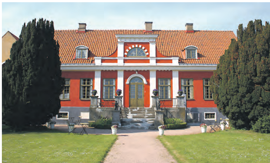
Christinehof Slot beskæftigede i midten af 1700-tallet ikke færre end 900 medarbejdere og var suverænt Sydsånes største arbejdsgiver.

største arbejdsgiver med mere end 900 ansatte på selve slottet og i det tilhørende landbrug. Tredje dag står på et daglangt besøg på Krapperup Slot, der ligger i en meget romantisk park med rislende vandløb, smukke bække og eksotiske træer. På turens fjerde og sidste dag, hvor der tjekkes ud fra Hotel Scandic Malmø City, indgår et besøg på Malmøhus, der både fungerer som byens museum og kunstmuseum og som hvert år viser cirka ti udstillinger med nordisk og international kunst udover sine egne faste udstillinger. Hele denne herlige tur til Sydsåne koster – inklusiv bropenge, entré-billetter og tre hotel overnatninger med tilhørende morgenmad og aftensmad – 505 euro for medlemmer af Foreningen NORDEN i Sydslesvig, mens ikke-medlemmer skal slippe 555 euro. Ekstragebyr på 125 euro for de deltagere, der insisterer på enkeltværelse. Sidste frist for tilmelding til Sverige er mandag 20. marts ved turlerder Inge Juech på telefon 0461-30966 eller mail: inlojuech@versanet.de