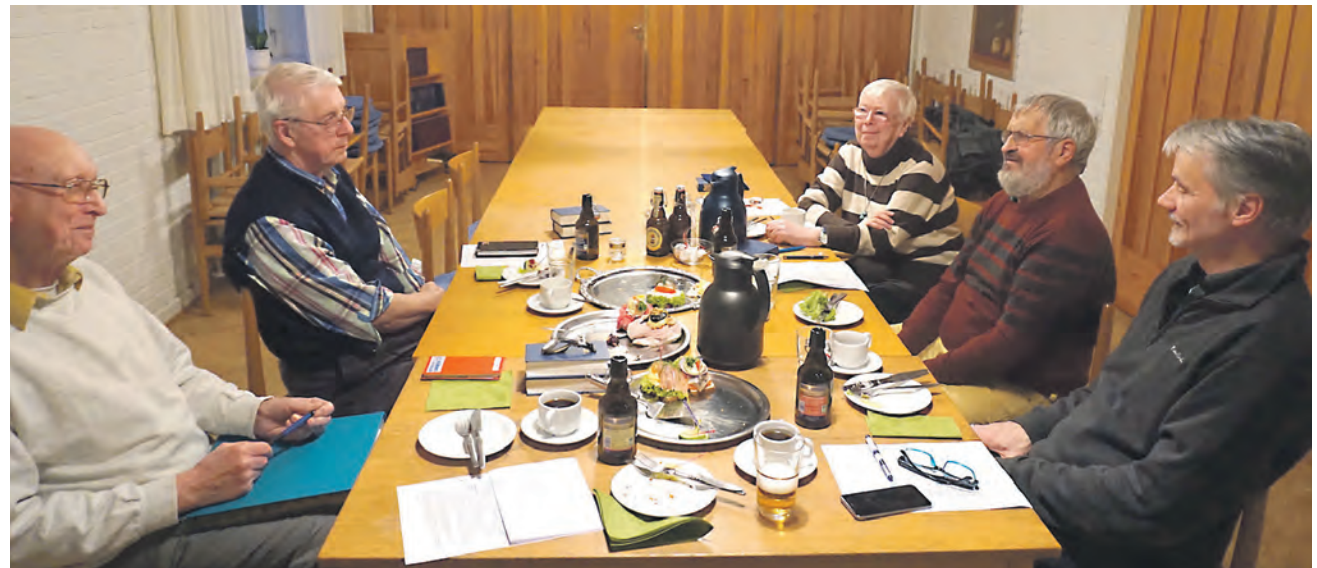
Bestyrelsen for støtteforeningen KFUM og KFUK i Sydslesvig må konstatere, at enden er nær. På den seneste generalforsamling blev det besluttet at nedlægge og opløse foreningen med virkning fra 2018.

En lang og glørværdig historie er dermed forbi, selv om opgaven med at drive kristent og kirkeligt ungdomsarbejde naturligvis stadig er aktuel.