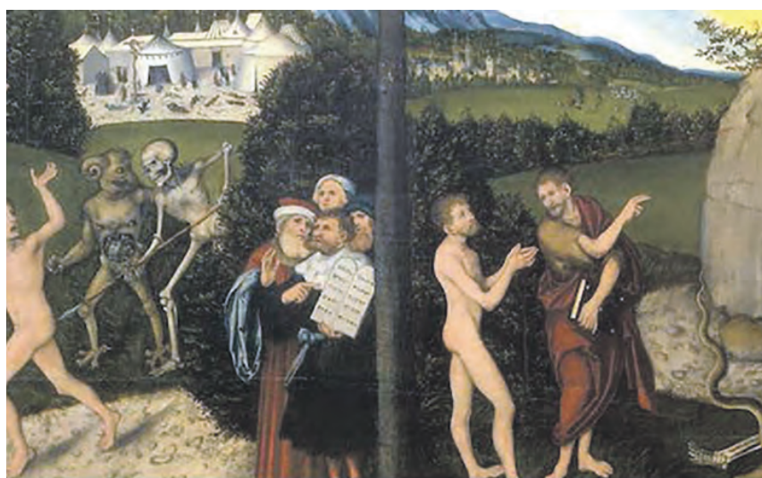
Lov- og Nåde-motivet fra slutningen af 1520'erne. Et oplagt eksempel på kirkekunstens mere pædagogiske rolle efter reformationen, hvor motivernes mission blev at anskueliggøre troen på Kristus.