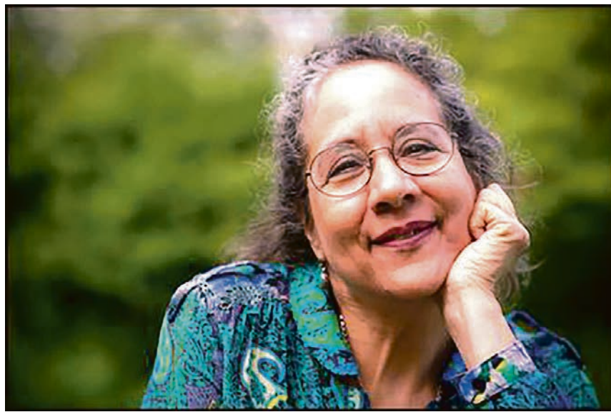
Fredag den 24. november er Slesvighus tur til at nyde godt af Marilyn Mazur musikalske og livsbekræftende mangfoldighed. I midten af januar måned optrådte hun for fulde huse og foran et begejstret publikum på Flensborghus, og det var godt.