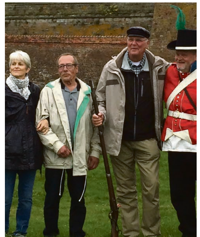
I Danmark møder man altid mange imødekomme og snakkesaglige mennesker.