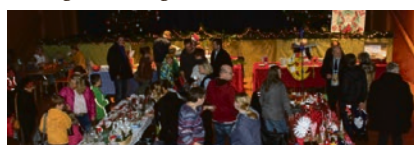
Julemarkedet på Husumhus er altid et tilløbsstykke.