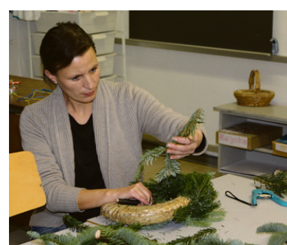
I Bredsted kan man selv få lov.