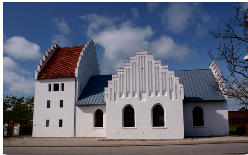
Mariekirken i Bøvlingbjerg, tæt på Lemvig i Viborg Stift. Her holder Bøvling Valgmenighed til

DER ER IKKE så langt fra Valsbøl over Paris til Bøvlingbjerg som man skulle tro! Nok er Eiffeltårnet skiftet ud med DTU's vindmøller, som dog også blinker om natten. De tyske og franske gloser er skiftet ud med de vestjyske, og ordet grænseland er vejet for udkant og vandkant. Der er tale om tre slags mindretalskirker; den historisk forankrede, den dansk/protestantiske kirke i et fransk