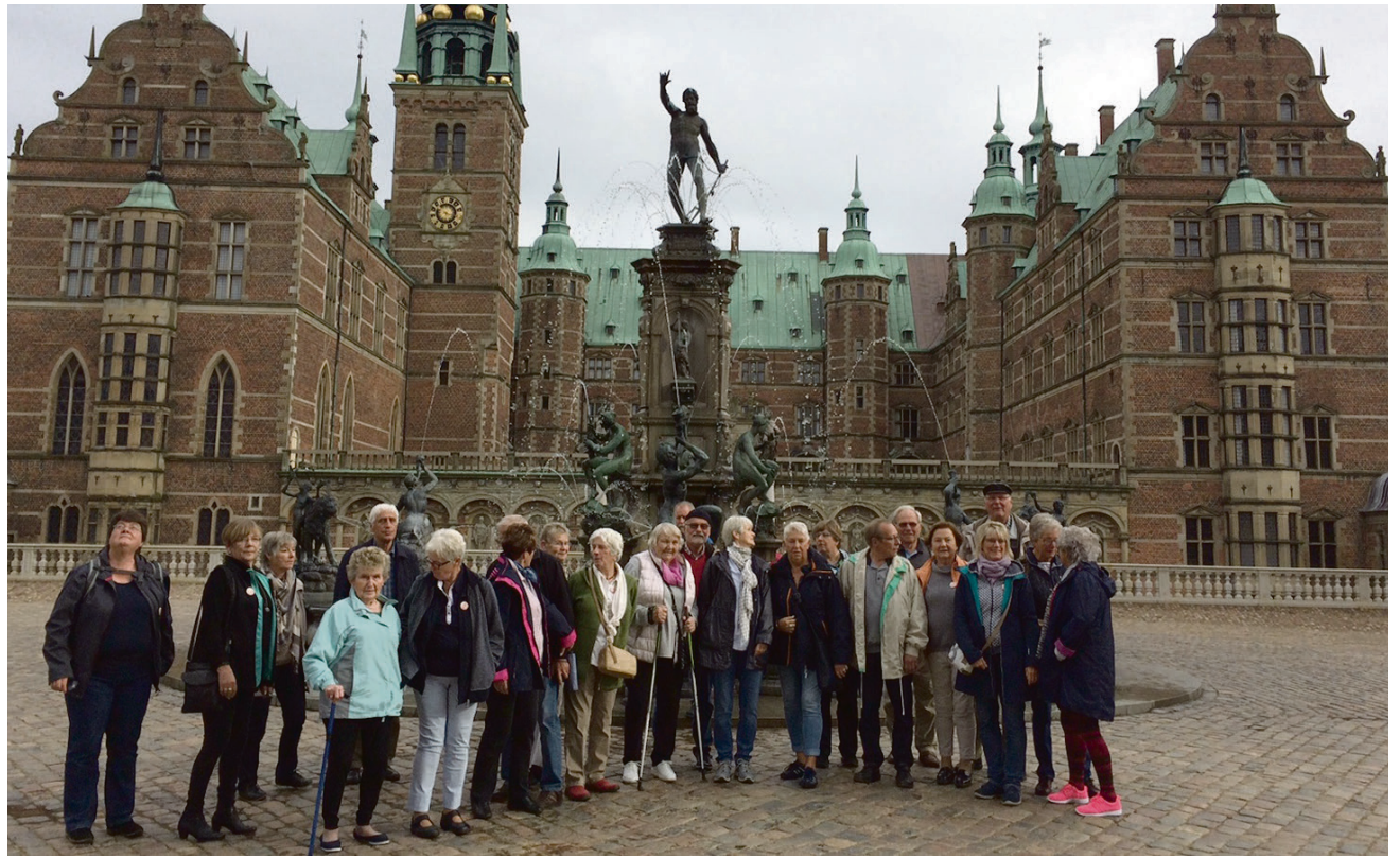
Hele rejseselskabet foran Frederiksborg Slot.