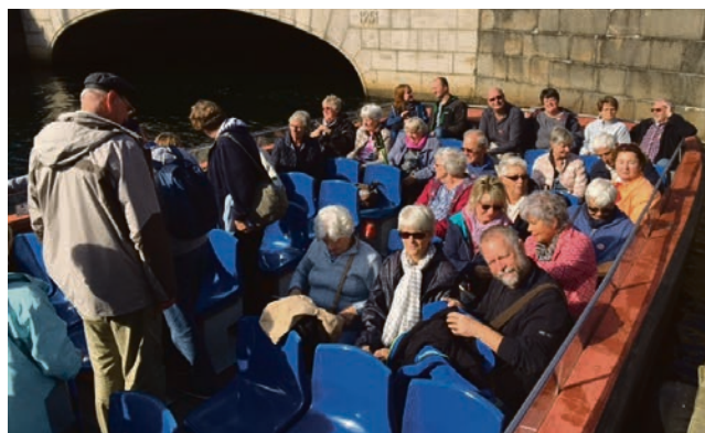
Den obligatoriske kanalrundfart i Københavns havn var også et must.