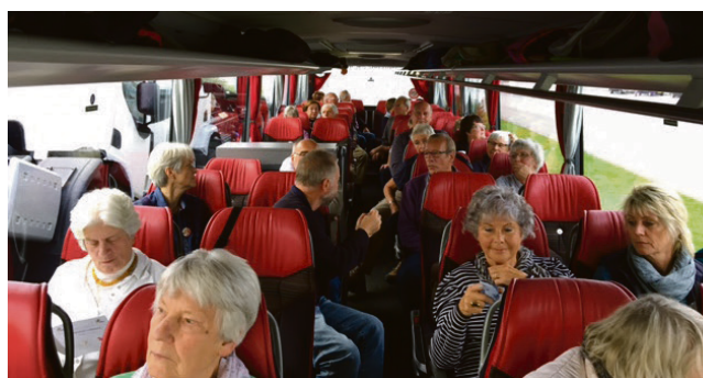
Hyggestemning i bussen begge veje.