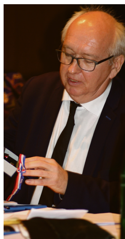
En lille fin gave fra det officielle Slesvig-Holsten.