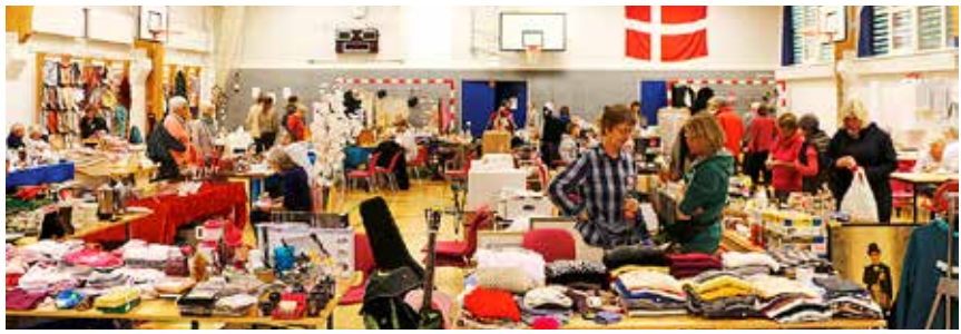
En hal fuld af lopper.