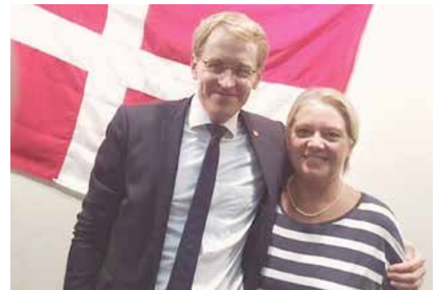
Lige inden billedet skulle taget, kom ministerpræsidenten til at rage flaget ned fra væggen bagved. Men han insisterede selv på at hænge det pænt på plads igen. Dog med en ekstra håndsrækning fra SSF's næstformand.