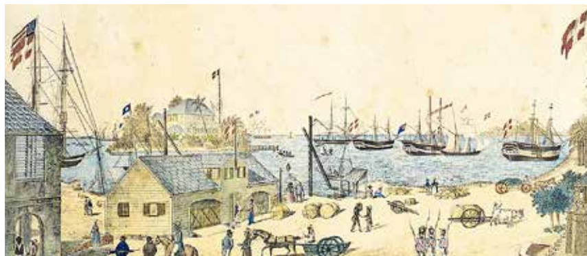
Under kolonitiden blomstrede Flensborg gevaldigt op som en af Nordeuropas førende havnebyer og det smittede af på velstanden i hele Sønderjylland og Slesvig. (Illustration: Grænseforeningen)