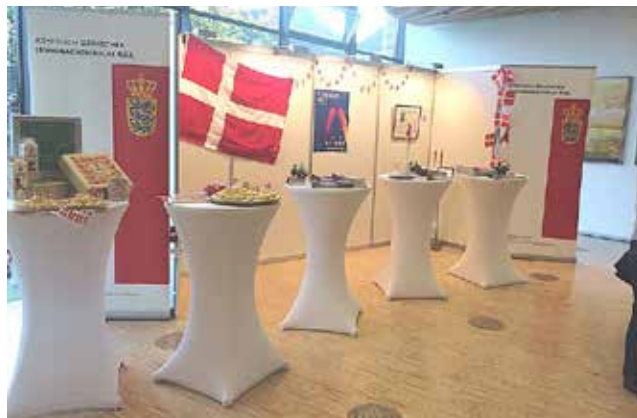
Den danske stand med smagsprøver og andre godbider fra moderlandet mod nord.