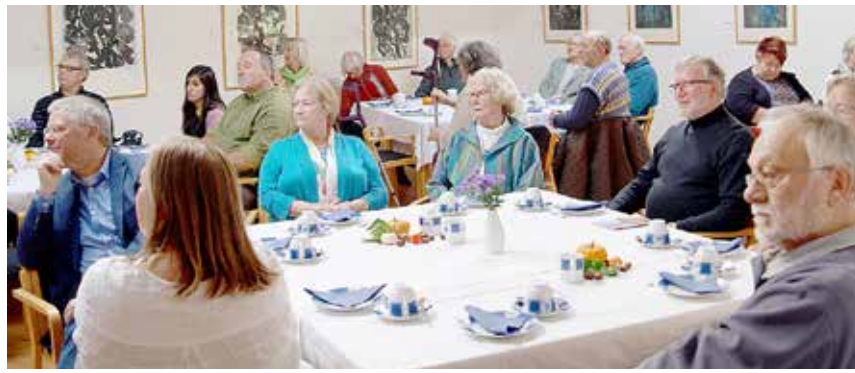
Tilhørerne befandt sig tydeligvis godt i selskab med H.C. Andersens 'baronesser' og de to veloplagede oplæsere fra støtteforeningen Mikkkelbergs Venner.