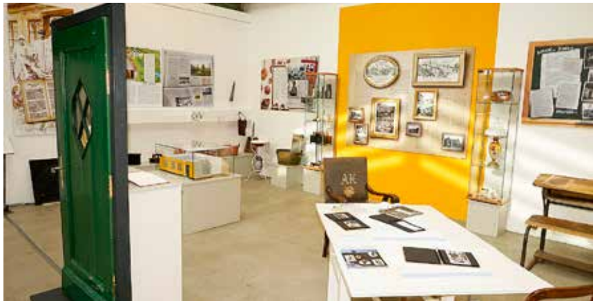
Et udsnit af den nye afdeling på Kobbermølle Industrimuseum, der kan ses under den aktuelle udstilling.

vilkår, skoleforhold og foreningslivet. Udstillingen kan til og med den 29. oktober ses onsdag til søndag kl. 13-17. Og fra den 1. november til udgangen af april 2018 på lørdage og søndage kl. 13-17. Dog ikke omkring jul og nytår. Grupper fra 8 personer er efter aftale velkomne hele året alle dage på alle tidspunkter. Inkluderet en rundvisning. Kontakt: Tlf. 0461-407 71 25 (brug telefonsvareren) eller send en mail til museum@kabelmail.de.