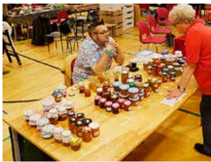
Hvad med et glas hjemmelavet marmelade?

Nu er man godt rustet til både de små og store arrangementer. Når erfarne husmødre siger: "Køkkenet fungerer fint", så kan det ikke gøres