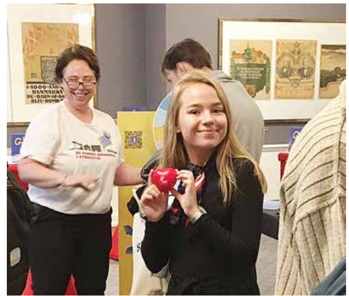
Sydslesvig havde også denne gang noget på hjerte. Blandt andet denne helt nye præsentationsfolder om det danske mindretal.