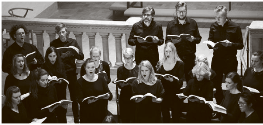
Koret Paradox, der tæller cirka 35 sangere, holder til i Mariakirken på Istedgade i København, og deltager jævnligt i forskellige velgørenheds-arrangementer. Den sidste fredag i september optræder koret i Flensborg Bibliotek.