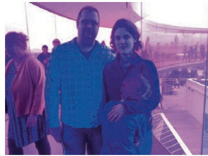
Familien Busch fik en lidt anden kulør i regnbuegangen.