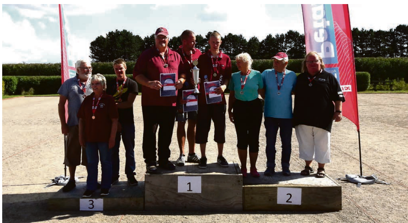
Stolte bronzemedaljemodtagere fra Sydslesvig efter en overraskende sejr over storfavoritterne fra DGI Sydvest i den afgørende kamp om tredjepladsen.