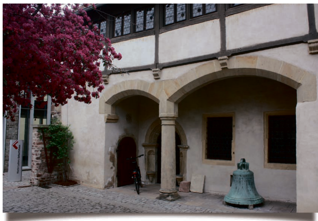
Luthers fødested i Eisleben. Cyklen ved døren er næppe hans.

IKKE LANG TID efter Luthers død måtte den protestantiske kirke gå ind og stoppe en upassende tilbedelse og brug af Luthers efterladte møbler, bøger og klæder.