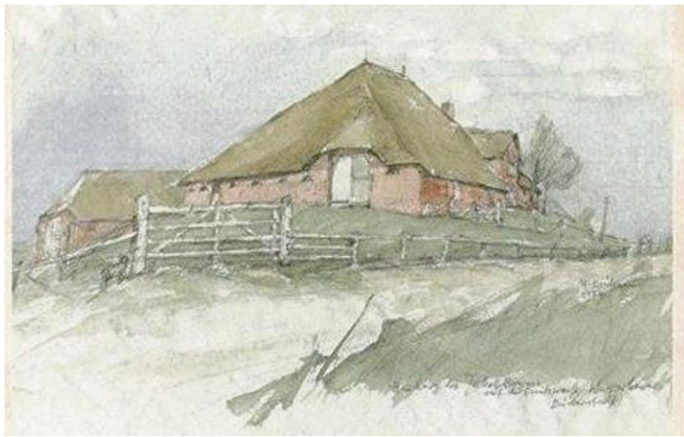
Fra mandag i næste uge og hele oktober måned kan biblioteksbrugere i Slesvig blandt andet få mulighed for at nærstudere dette smukke husmotiv fra Husum og flere andre kunstværker fra den dansk-frisiske kunstmaler Margareta Erichsen.