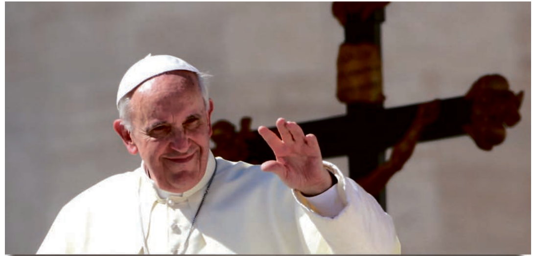
Biskop af Rom og den katolske kirkes overhoved, pave Franciskus

B: Ja, der kan være mange årsager til, at folk vælger at blive skilt, så det er der slet ikke noget usædvanligt i.