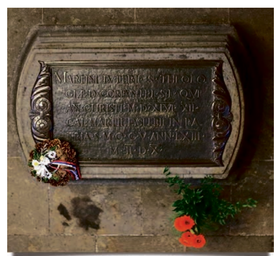
Luthers sidste hvilested i Slotskirken i Wittenberg. Her ligger han og kan ikke andet. Den opmærksomme læser vil se at der er fejl i romertallene.

Så når folkekirken i dag bruger betegnelsen luthersk, burde den så ikke skamme sig?