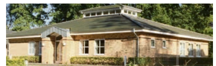
Det Danske Hus i Sporskifte, som blev opført og indviet i 2007, er blevet ti år, og det lille jubilæum markeres først-kommende søndag eftermiddag. Mød op og vær til at hylde det smukke og velfungerende omdrejningspunkt for de danske aktiviteter i Sporskifte.

kurser og møder. Sammen med det nye spejderhus, der havde rejsegilde tidligere på sommeren, og som snart står færdigt og klar til brug, udgør Det Danske Hus og den lokale danske vuggestue en perfekt tre-enighed for det danske arbejde i Sporskifte. SSF Sporskifte står for søndagens jubilæums-arrangement og håber, at mange vil finde tid og lyst til at være, når Det Danske Hus bliver fejret søndag eftermiddag mellem kl. 15.00-17.30.