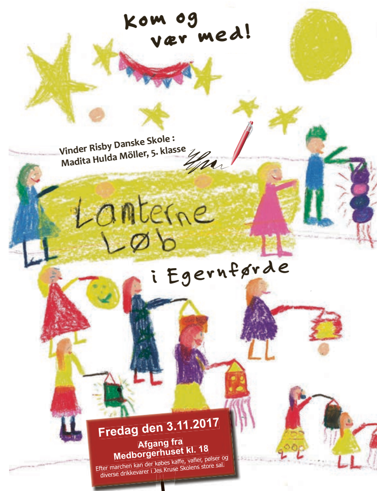
Arrangører: Borreby Barnehave • Egernførde Barnehave • SSF Egernførde • SSF Aldreklubben • Dansk Kirke Egernførde Egernførde Barne- og Ungdomshus • SSW Egernførde • Aktive Kvinder Egernførde • Risby Danske Skole • IF Egernførde UF Egernførde • Jes Kruse Skolen • En hal for alle e.v.