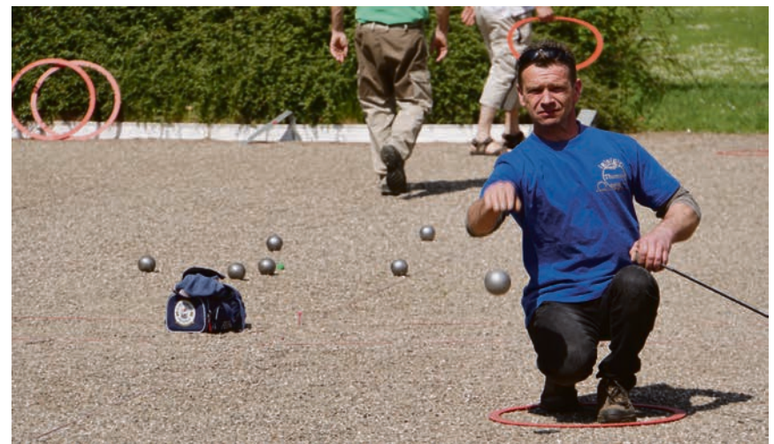
Det kræver præcision og koordinering at få stål-kuglerne til at lande præcist dér, hvor de skal, når man spiller petanque. Det kræver også præcision og koordinering at arrangere et stort weekendstævne for alle de bedste seks-mands-hold fra både nord og syd. Men SdU har styr på tingene forud for weekendens mesterskaber i Flensborg.

[KONTAKT] Samarbejde med DGI Petanque i Vingsted er Sydslesvigs danske Ungdomsforeninger (SdU) i denne weekend vært for de afsluttede landsmesterskaber i petanque, hvor sæsonens bedste seks-mands-hold fra Danmark og Sydslesvig dystes om retten til at kunne kalde sig landmestre i det næste års tid. Finalstævnet indledes i morgen med ankomst og indskrivning af de deltagende mandskaber, som også får lejlighed til at prøvespille petanque-baner i Idrætsparken (DGF-pladsen) i Flensborg med en afslappende og uhøjtidelig opvarmingsrunde, hvor der er rødvin på højkant til de mest træfsikre. Lørdag og søndag går det for alvor løs med de indledende puljekampe for at finde deltagerne til de altafgørende finale-runder søndag eftermiddag. For de fleste af deltagerne er der gratis overnatning i DGF-bygningen, på Gustav Johannsen-skolen og på Ungdomskollegiet, der tilsammen kan huse omkring 50 deltagere. De øvrige spillere må selv sørge for indkvartering på de nærliggende campingpladser, vandrehjem og hoteller.