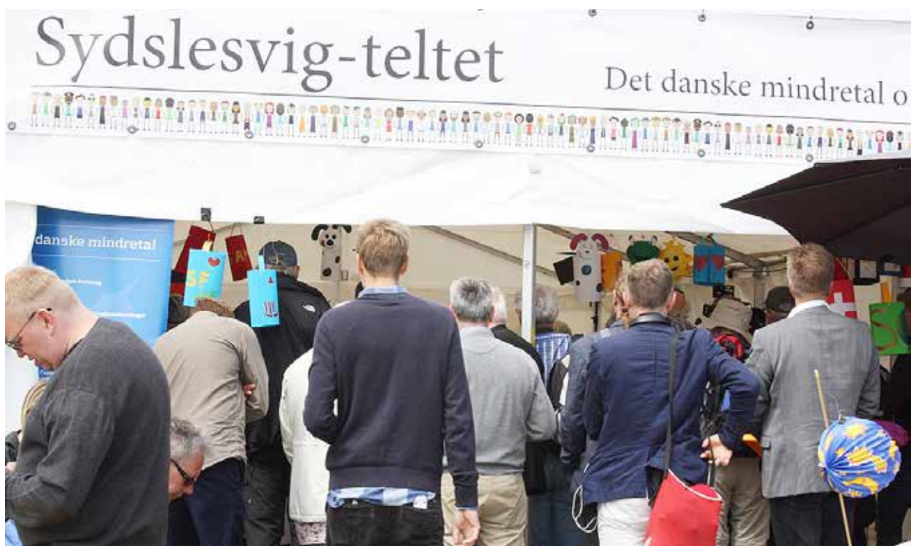
Tilhørerne samlede sig hurtigt om Sydslesvig-teltets indgang, hver gang et nyt debattmøde gik i gang.