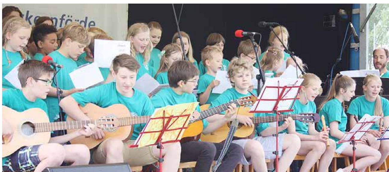
Elever fra musikskolen i Egernførde havde sammensat et smukt program af forskellige numre, som de opførte under årsmødefesten i Egernførde lørdag eftermiddag.