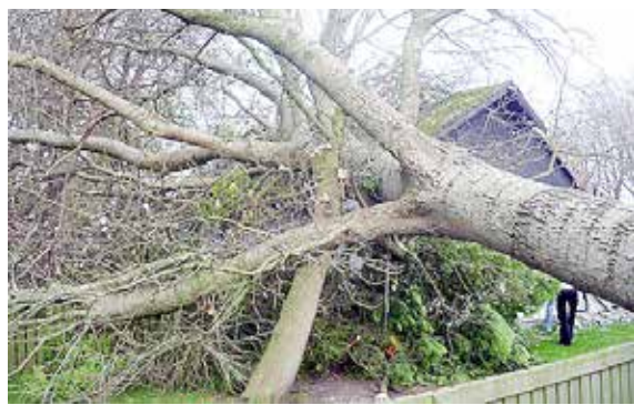
Under efterårsstormen i 2014 væltede dette store træ ned over Den Danske Børnehaven i Drage. Nu har børnehaven og det danske som det frisiske mindretal i byen imidlertid fået et nyt – og knapt – så farligt årsmøde-træ fra Sydslesvigsk Forening (SSF)-

– flot fremmøde med et klart og tydeligt dansk indhold. Og når børnene i børnehaven samtidig påtaget sig at passe træet, er der jo endnu en god grund til at frede Drage Børnehaven, hvis nogen senere hen skulle få lyst til at svinge sparekniven over daginstitutioner.