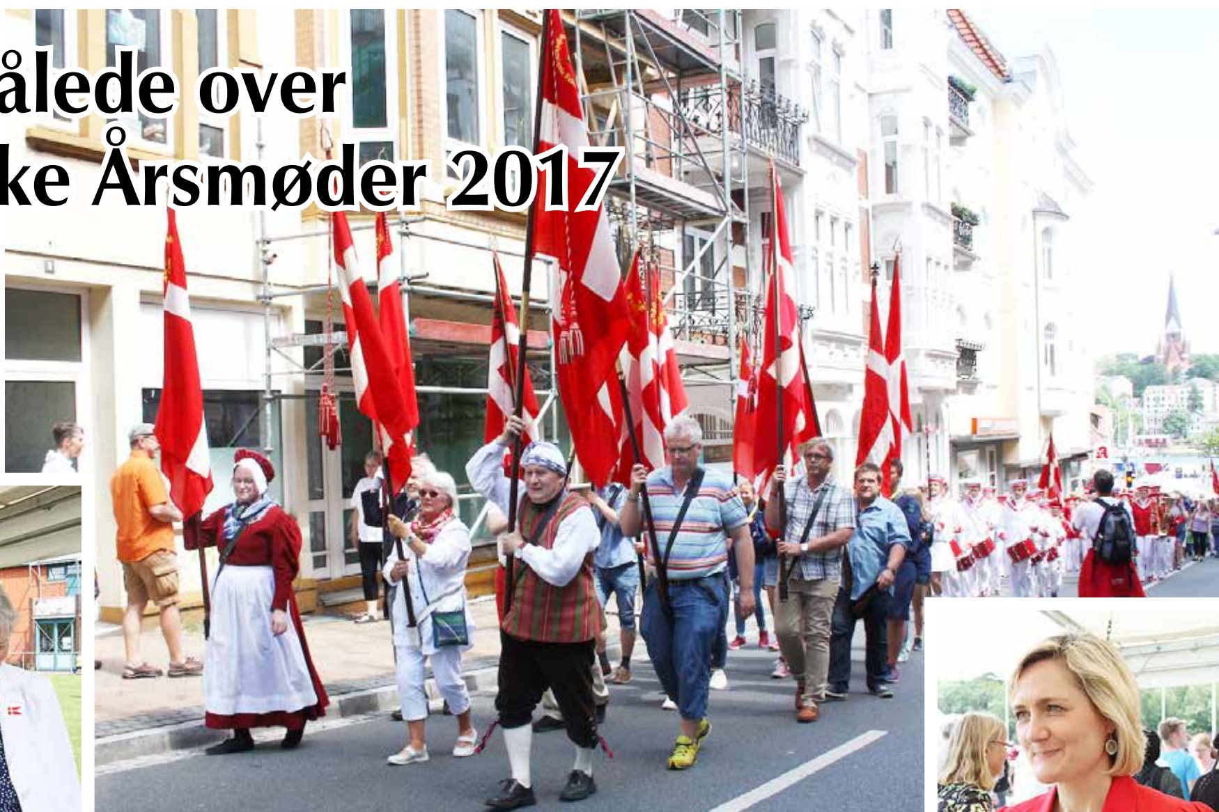
Fanebærere i front for det store optog under opstigningen af Toosbuygade i Flensborg forrige søndag.

(KONTAKT)Vejrguderne var i den grad på de dansksindede sydslesvigeres side, det danske mindretal i gennemførte sine traditionsrige årsmøder i Sydslesvig forrige weekend. En varm fornøjelse, der hurtigt fik humøret til at stige et par ekstra grader under søndagens store friluftsmøder med tilhørende optog. Billederne på disse sider er et udpluk fra årsmøde-festerne i Flensborg, Harreslev og Egernførde.