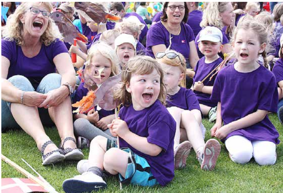
Masser af glade og forventningsfulde børn var – sammen med deres forældre og øvrige familie – med til at gøre søndagens friluftsmøde i Flensborg til et tilløbsstykke.