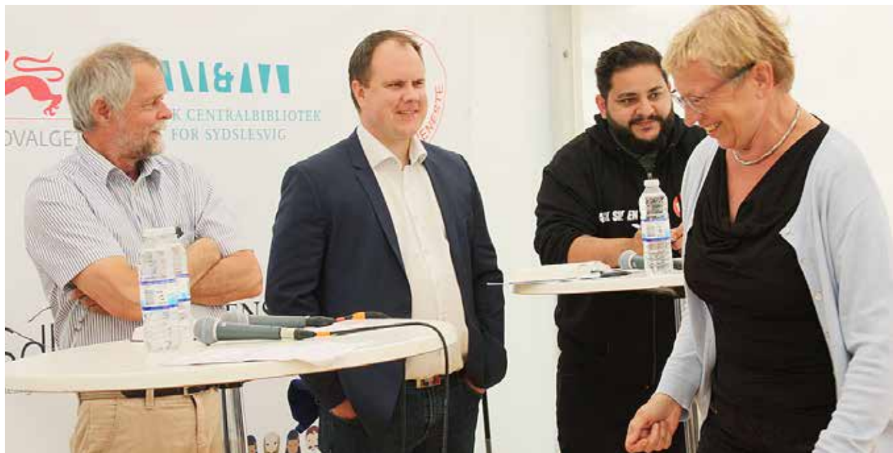
Stemningen var munter og afslappet omkring debat-mikrofonen, trods mangfoldigheden og de forskellige meninger og politiske holdninger.