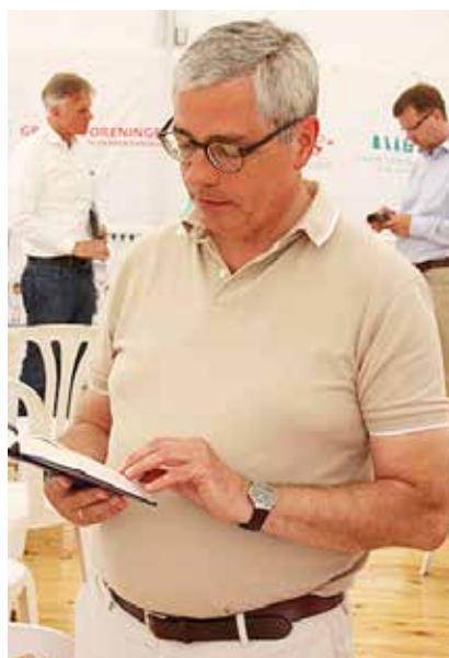
Højskolesangbogen blev naturligvis flittigt brugt i Sydslesvig-teltet. Men hvad skal vi nu lige synge som indledning til næste debattmøde...?