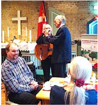
Forhenværende undervisningsminister med mere, Bertel Haarder, viste sig en sangglad herre med styr på de gamle sønderjyske sange under forrige fredag årsmøde-arrangement i Sct. Jørgensby.

at holde sin bebudede årsmøde-tale, der ganske som varskoet på forhånd handlede om at behovet for også at tilbyde og udbyde erhvervsuddannelser for unge i Sydslesvig. Godt 100 fremmødte deltog denne gang i årsmøde-arrangementet i Sct. Jørgensby. 30 flere end sidste år.