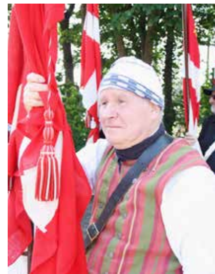
En stolt og myndig fanebærer, der var været med i mange, mange år og gået i spidsen for optoget gennem byen adskillige gange.