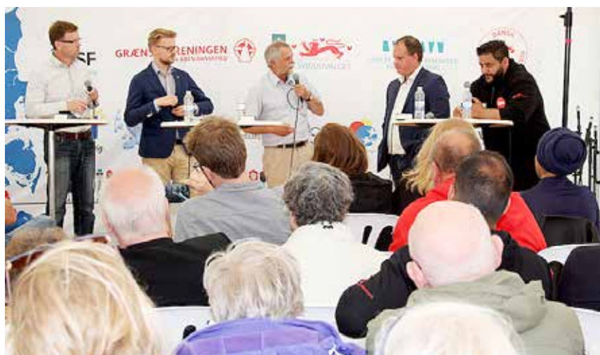
Debatten om mindretal og minoriteter blev fulgt med stor opmærksomhed.