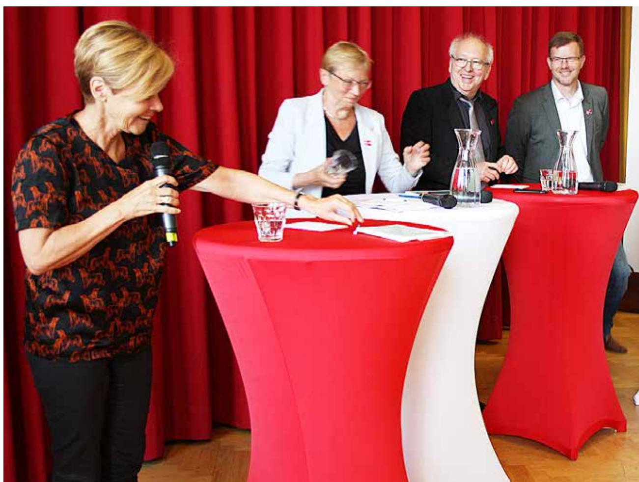
Deltagerne under paneldebatten på Flensborghus var tydeligvis i godt humør.