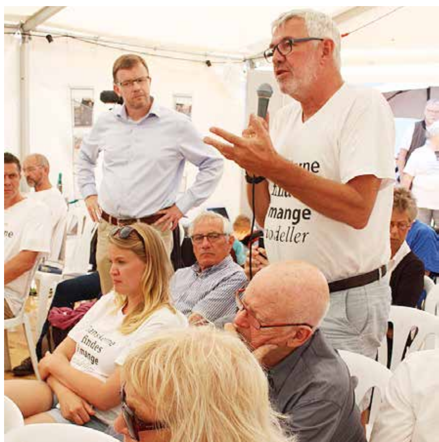
Stor og engageret spørgelyst fra salen.