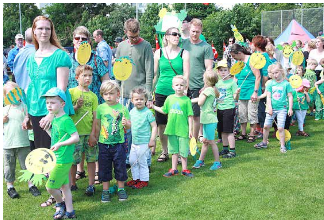
Børn og personale fra flere børneinstitutioner fra Flensborg havde forberedt sig godt, flot og kreativt på at være med ved friluftsmødet.