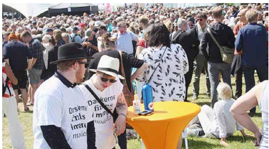
Med Folkemødets hovedscene som nærmeste nabo, var der med jævne mellemrum tusindvis af mennesker indenfor rækkevidde.