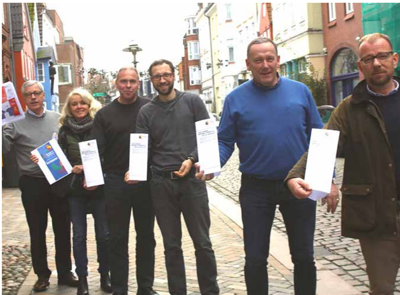
Her ses et udvalg af den særlige Task Force, som lørdag vil være synligt til stede i gadebilledet i både Flensborg, Husum, Slesvig og Egernførde for at få endnu flere underskrifter i hus til det fælleseuropæiske mindretals-initiativ Minority Safepack Initiative (MSPI).