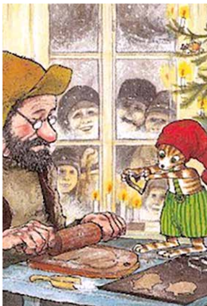
Katten Findus er i den grad i julehumør, når børneafdelingen ved de danske biblioteker i Flensborg og Husum.

Tilmelding - Flensborg bibliotek (mail: sc@dcbib.dk ) - senest 28. november. Tilmelding - Husum bibliotek (mail: imbe@dcbib.dk ) - senest 11. december.