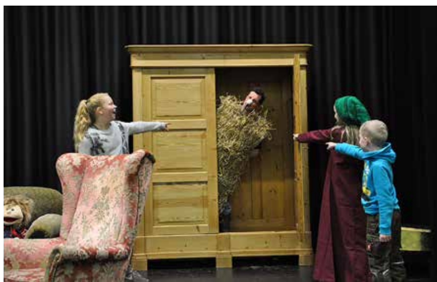
Hier sind Bilder von den Proben.

unter www.teooter.de . Et Nordfriisk Teooter wird gefördert aus Mitteln der Bundesbeauftragten für Kultur und Medien, Slesvigsk Samfund und der Friisk Foriining.