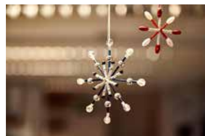
Lav smukke tråd-stjerner med perler.