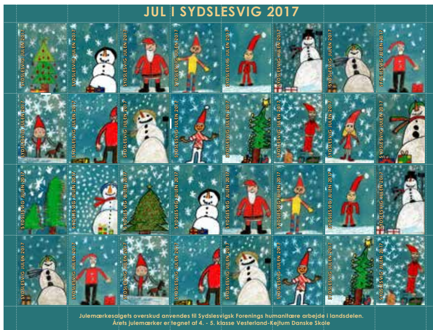
Julemærkesalgets overskud anvendes til Sydslesvigsk Forenings humanitære arbejde i Landsdelen. Årets julemærker er tegnet af 4. - 5. klasse Vesterland-Kejtum Danske Skole