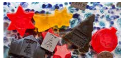
Lav dit eget juleguf. Det sker alt sammen i Aktivitetshuset på Nørregade

I baggården bliver julens hygge givet på en appellerende måde, som lægger op til hyggeligt samvær, og i selve info-området lige indenfor døren bliver der lagt an til en speciel oplevelse. Alle kan være med uanset alder, og det koster kun fem euro. Tilmelding til årets julehygge i Aktivitetshuset sker via mail til akti@sdu.de .