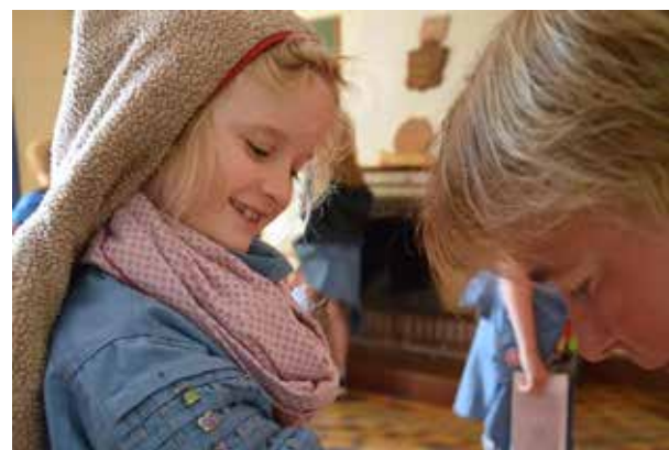
Kernen i FDF er fællesskabet, både for børn og for børn og voksne. Det at lege, hygge, grine og tale sammen, og at blive mødt med respekt uanset baggrund, alder eller evner.