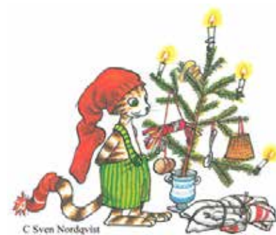
C Sven Nordqvist

Det drejer sig om katten Findus fra de populære børnebøger om Findus og Peddersen, der også har et stort publikum blandt børnefamilierne syd for grænsen. Både på børneafdelingen ved Flensborg Bibliotek og i Husum bliver der indrettet en særlig Findus Julestue, de yngste børn mellem tre-seks år kan spise pebernødder, drikke julesaft, pynte det skæve Findus-juletræ med