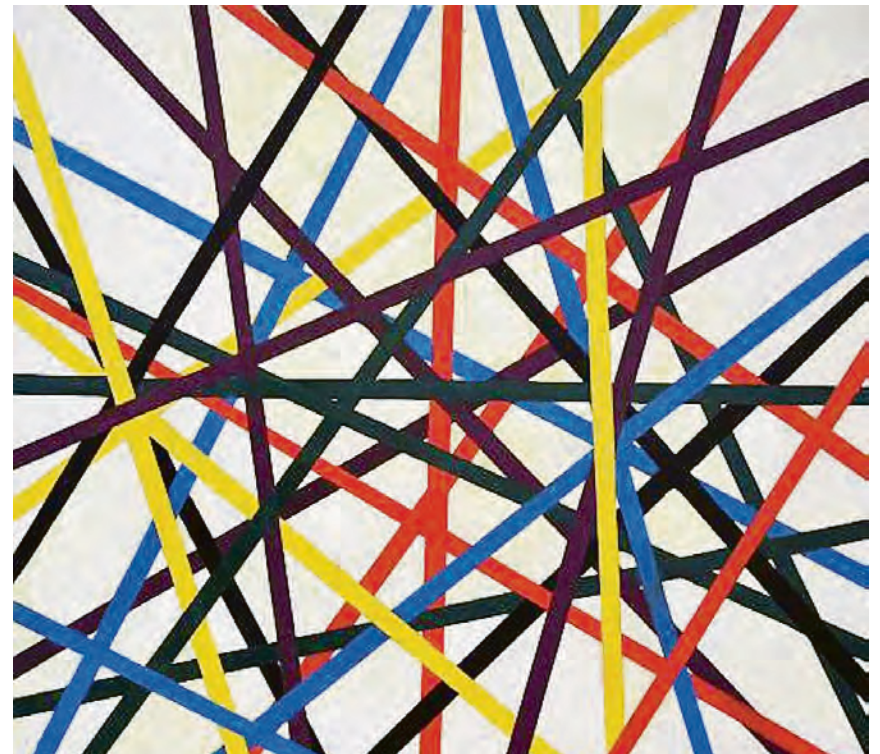
Vaagsvold den yngre – Joon Vaagsvold – er visuel maler med speciale lyd-billede og abstrakte motiver i stramme geometriske former.