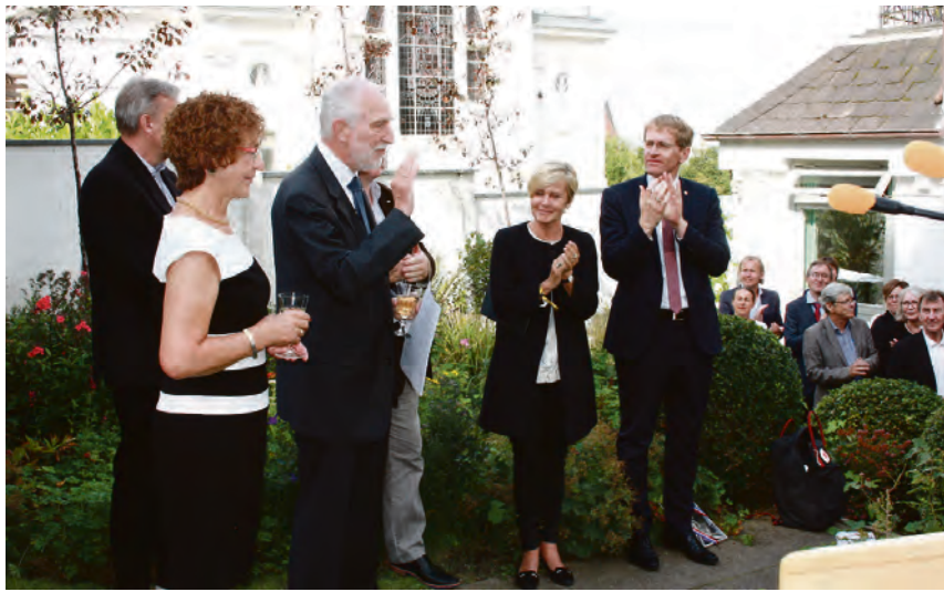
Indtil flere gange blev generalkonsulen og hans hustru klappet ud af Det Danske Generalkonsulat under sidste uges officielle afskedsreception.