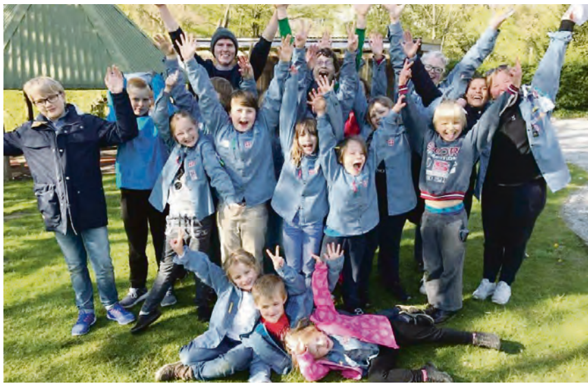
Glade FDF'ere på sommerlejr. Denne gang også med inviterede kammerater, som ikke er FDF'ere til daglig.