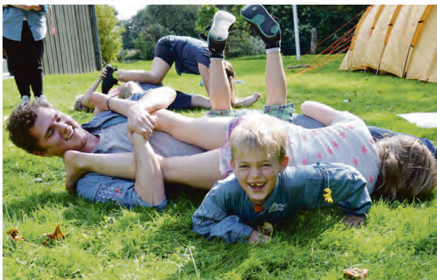
Til en hver sommerlejr hører der også leg og højt humør.