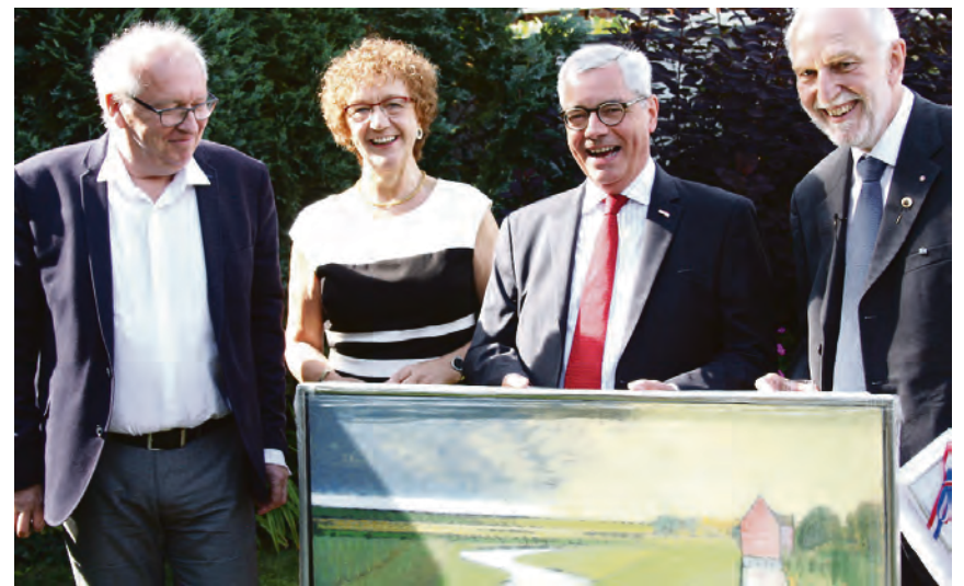
Som en særlig gave fra Sydslesvigsk Forening fik parret overrakt dette kunsværk af Dan Thusen fra 2016. Et motiv fra marsken med titlen ”Ny Frederikskog”.