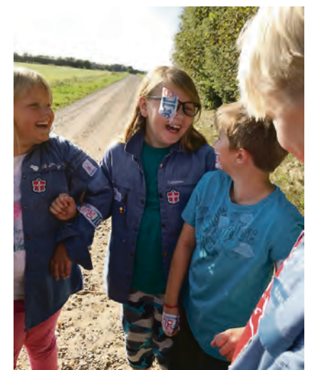
Vandpjask og gode grin hører naturligvis med på en rigtig sommerlejr. Også selv om vejret inviterer til regnslag og våde gummistøvler.