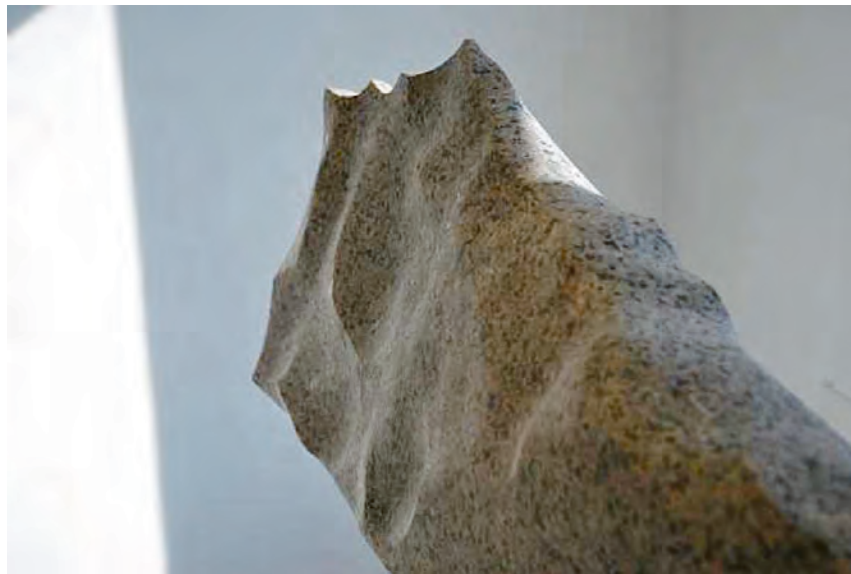
Vaagsvold den ældre – Alfred Vaagsvold – er selvklæret billedhugger med lamineret træ, sten og glas som sine foretrukne materialer.