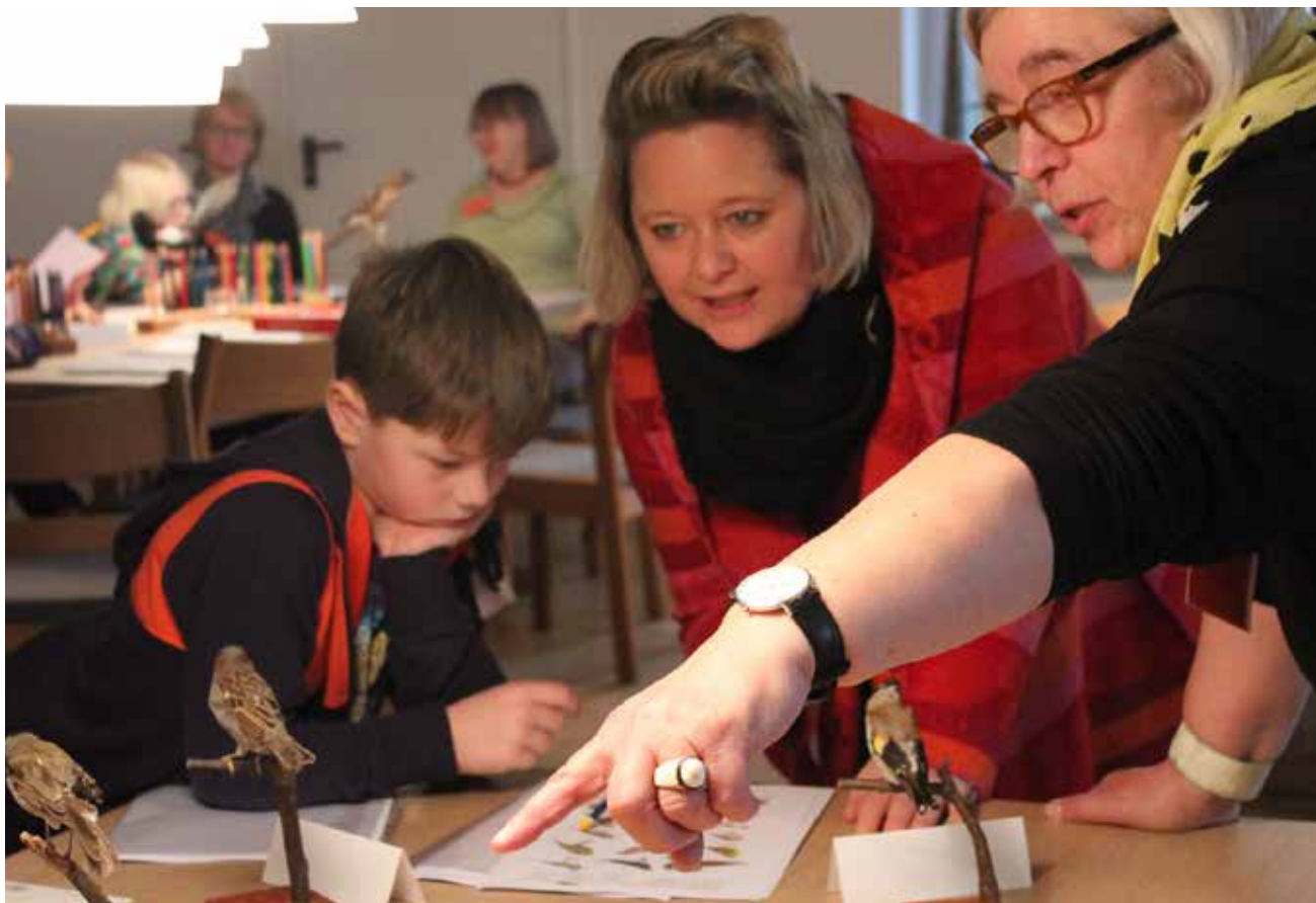
Der læres dansk via emnet "Vinterfugle".