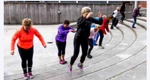
Er dét lykken?

KONTAKT. Der er opstået en spritny fase i livet mellem voksen og gammel. Den er så ny, at den endnu ikke har fået et navn. Og så ny, at den heller ikke er let at få øje på - og at flytte ind i. For selvom man føler sig på toppen af sin ydeevne som 60+er, kan det være svært helt at se bort fra at blive stemplet som gammel og affældig, blot man har rundet "det skarpe hjørne". Men hvad er livskvalitet for den enkelte? Det er meget forskelligt også for de, der nærmer sig de 60. For alle er den nye livsfase på flere måder en ny begyndelse. Nye, uvante og ukendte roller som hjemme-gående og bedsteforælder presser sig på, samtidig med at man må give slip på rodfæstede sociale roller som arbejder og forælder. Det er for mange tale om en overraskende mental, social og fy-sisk rutsjebanetur, som ikke alle klarer uden at blive rundtossede eller svimle langt ind i identiteten. Tidligere har man troet, at blot man fik styr på økonomien som pensionist, gik resten. Men flere og flere har erfaret, at aspekterne i livsfasen efter arbejdslivet er langt vigtigere at få vendt og drejet. Og netop dét er målet med dette foredrag: At åbne vinduet til de mange aspekter i den nye begyndelse som 60+er for derved at finde vej til, hvad der er livskvalitet for den enkelte.