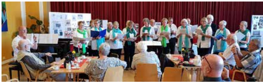
Torsdagskoret i fuldt vigør.