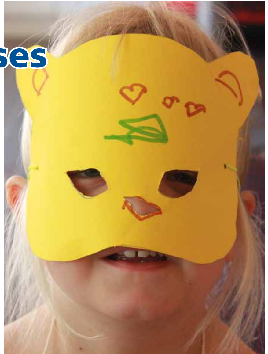
Børneaktivitet på et tidligere kursus.