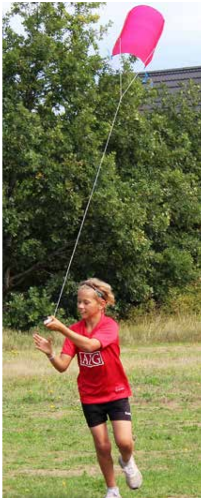
Få havde samme held som Miko Caspersen med at få dragen i vejret.