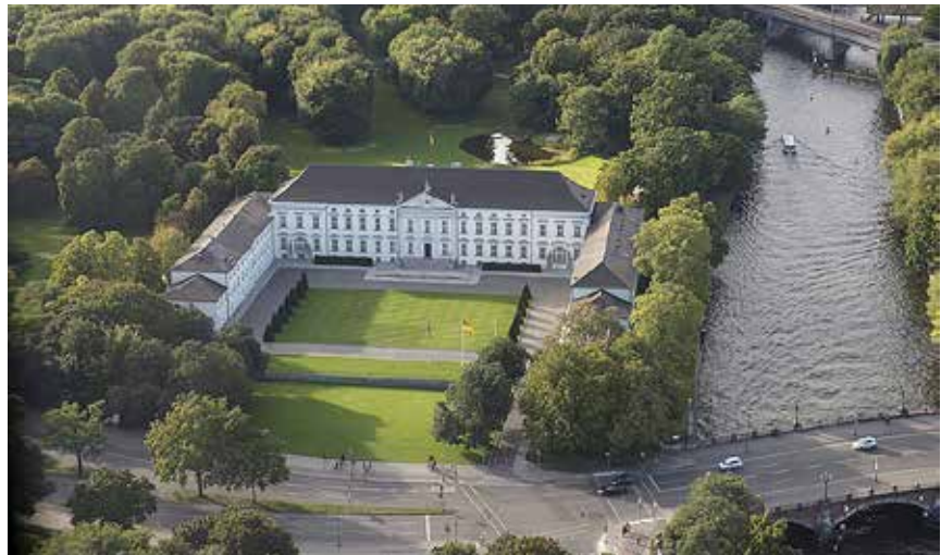
Schloss Bellevue, Amtssitz des Bundespräsidenten.