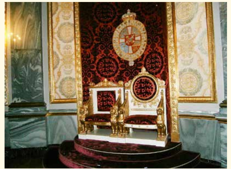
Tronerne bruges ikke mere.