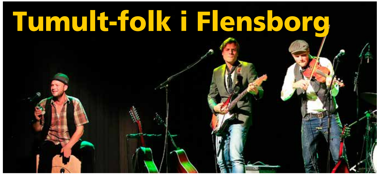
Tumult på scenen – 27. september på Adelby Kirkevej 34 i Flensburg.

KONTAKT. Kan dansk folkemusik være hip? Er folkrock en død sild? Og hvordan lyder elektrisk folk? Det kan man selv bedømme ved en koncert med denne spillevende trio, som SSF Sct. Jørgen-Mørvig i Flensburg arrangerer torsdag den 27. september kl. 20 i Menighedshuset på Adelby Kirkevej 34 i Flensburg – med rødvin og andet. De leverer dansk folkemusik fra den