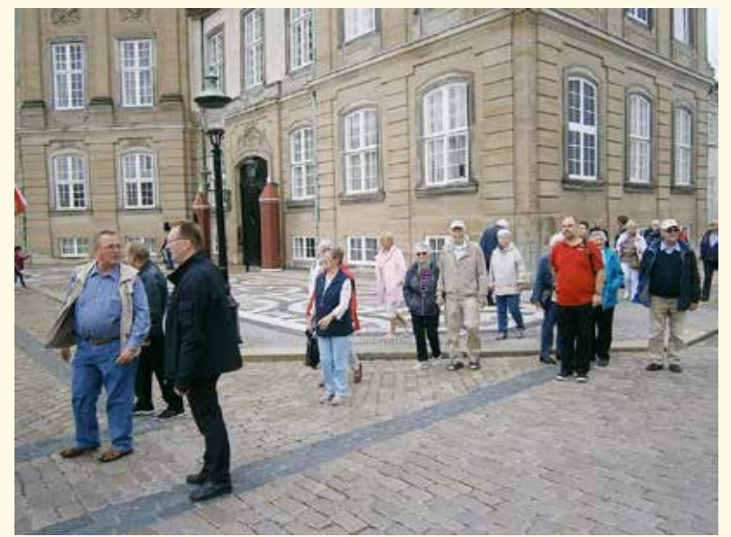
28 SSFere ankommer på Amalienborg.