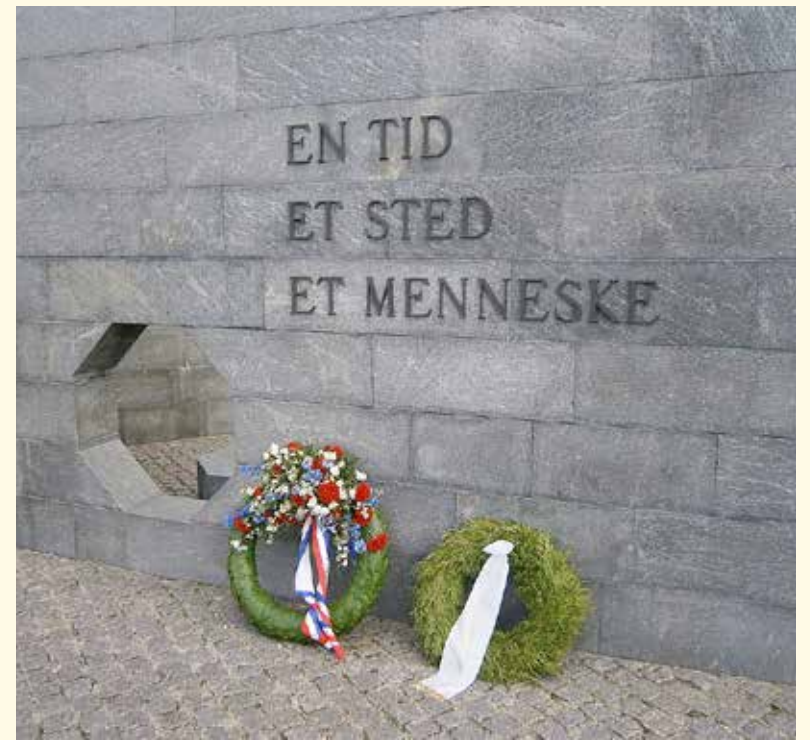
Mindesmærket for de udsendte faldne efter 1948.