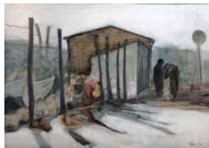
Holger Hattesen, 1982: Schrottplatz am Flensburger Hafen. Kaseinfarve på karton Schiffahrtsmuseum Flensborg

Billederne havde museerne iøvrigt selv valgt på en udstilling, der fandt sted i fjor i den flensborgske Kunsthandlung Messerschmidt. leb