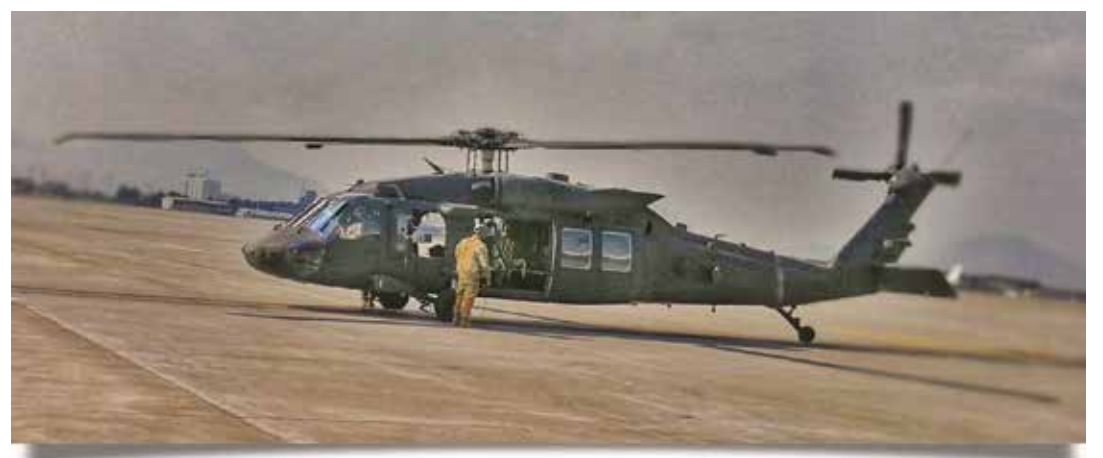
På travle dage eller når trafikken står stille i Kabul, kan man være heldig at få et lift med en Blackhawk