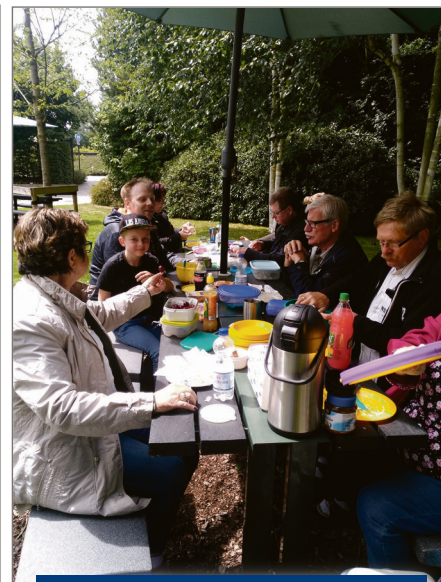
Der var godt humør, spændende aktiviteter og god mad, da SSFs Isted-Jydbæk distrikt tog på sommerudflugt til videnskabsparken Universe.