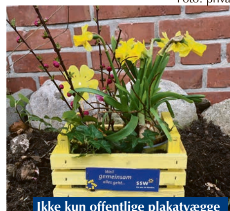
Ikke kun offentlige plakatvægge og lygtepæle tages i brug. Engagerede kandidater bruger også deres private have til at gøre opmærksom på SSW.

emneområde på dagsordenen. "Vores politikere beskæftiger sig med alle politiske emner mellem himmel og jord. Vi har vores egne byggeeksperter, kulturfolk og socialpolitikere, akkurat som andre partier. SSW er et fuldgyldigt parti, der råder over erfaringen og kompetencen til at gøre vores kommune til et bedre sted for mindretallet og også for flertals-samfundet." Det håber SSW nu at rigtig mange vælgere vil erkende og honorere til valget den 6. maj.