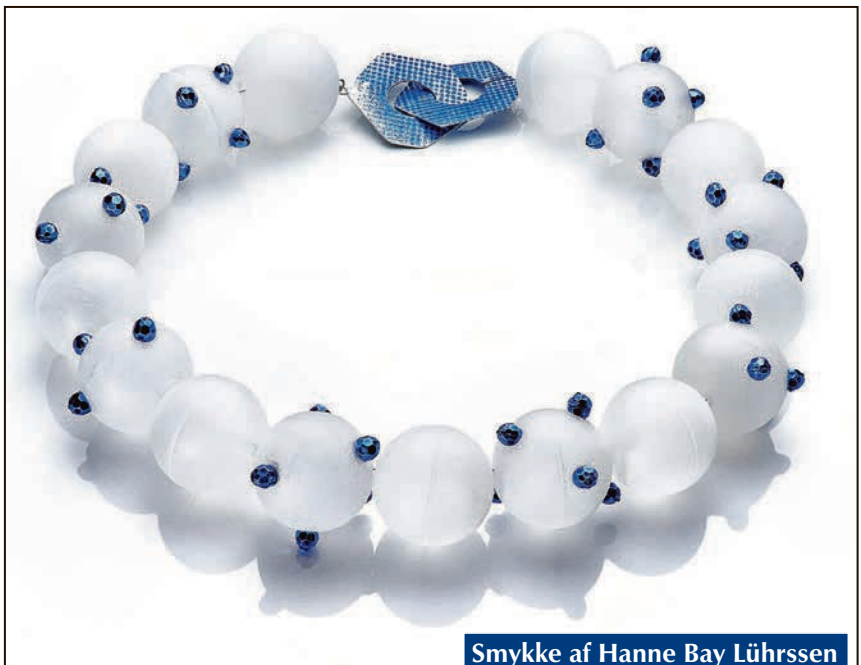
Smykke af Hanne Bay Lührssen der kan ses i Holland.