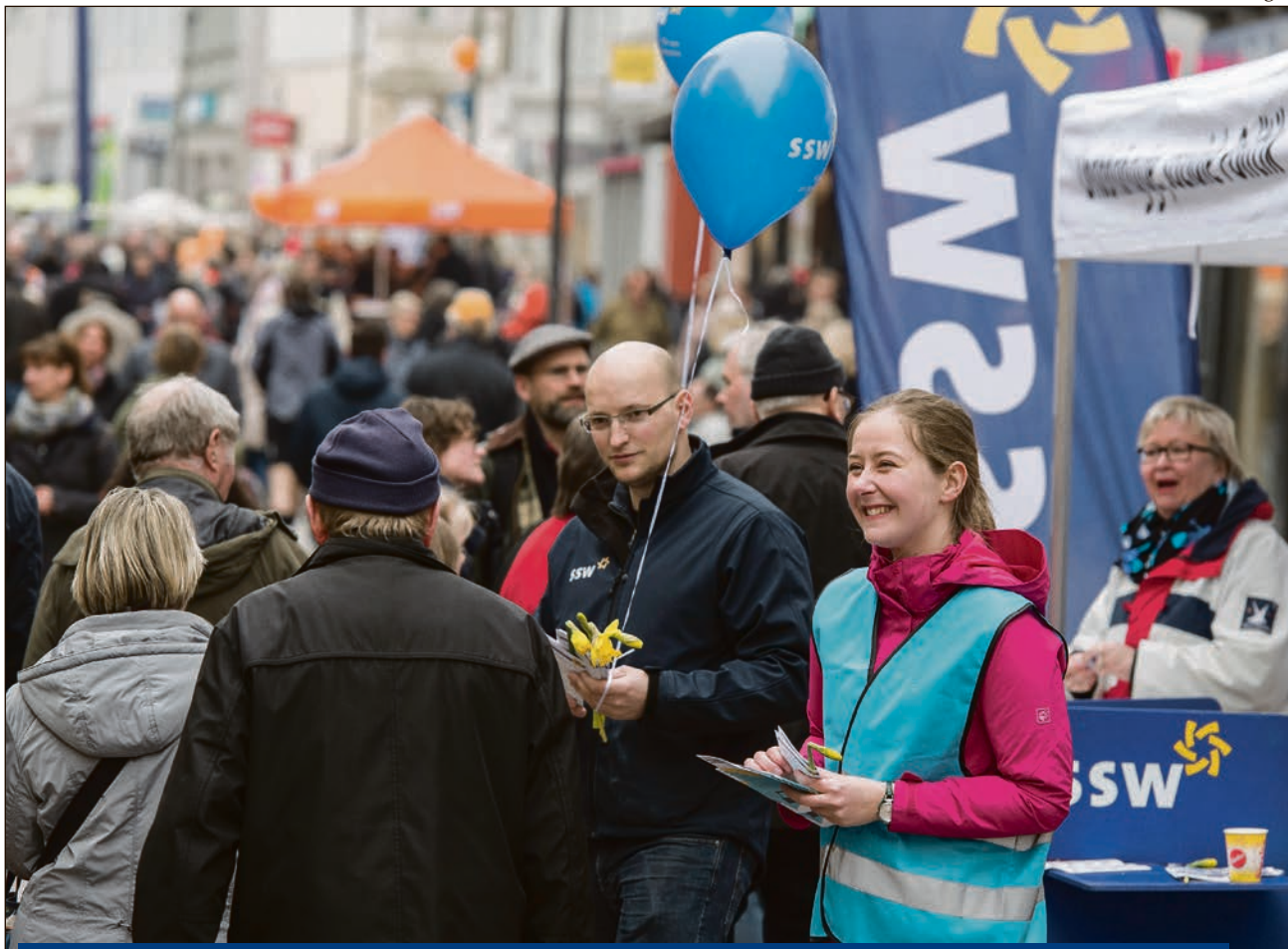
Gadevalgkampen blev mange steder skudt i gang i sidste weekend. Her er det på gågaden i Flensborg.