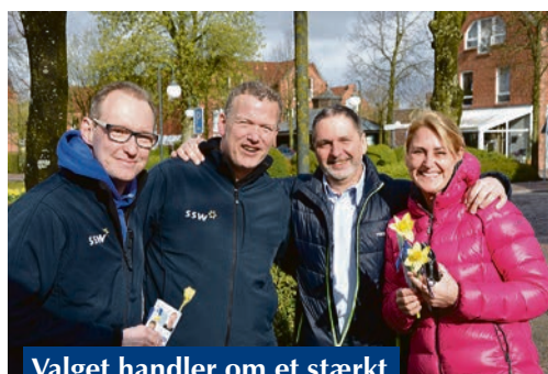
Valget handler om et stærkt sammenhold i mindretallet.

Især i weekenderne strømmer kandidaterne ud på gader og stræder for at være synlige, få vælgerne i tale