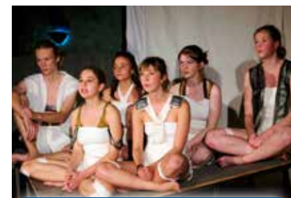
Skaberwerkets unge talenter fra Roskilde Gymnasium