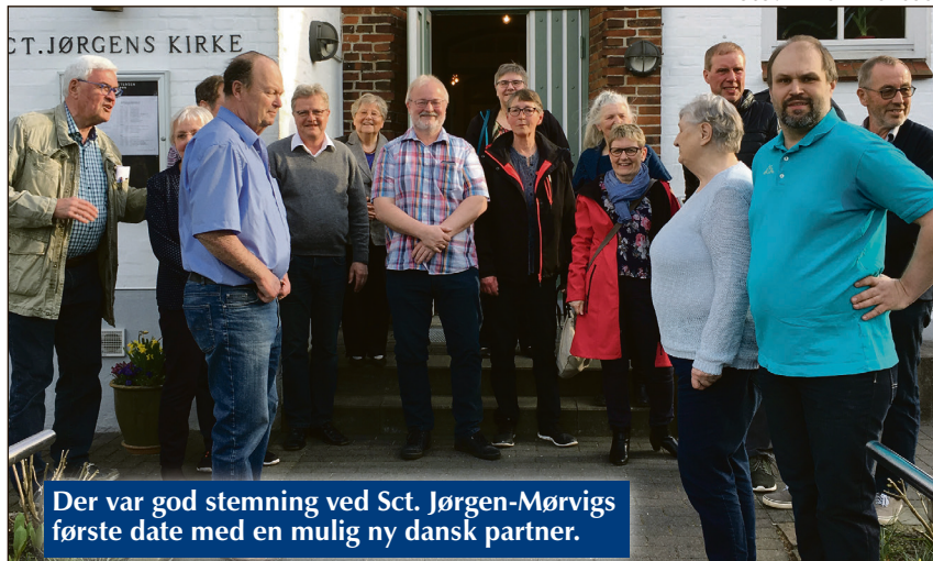
Der var god stemning ved Sct. Jørgen-Mørvigs første date med en mulig ny dansk partner.

fik forklaret lidt om foreningslandskabet i Sydslavisk, og sydslaviserne lærte lidt om "landsbylaug" og om eksistensen af "Landsbyforum" i Sønderborg Kommune, der samler alt frivilligt arbejde under sig.