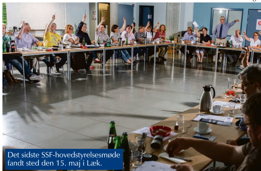
Det sidste SSF-hovedstyrelsesmøde fandt sted den 15. maj i Læk.