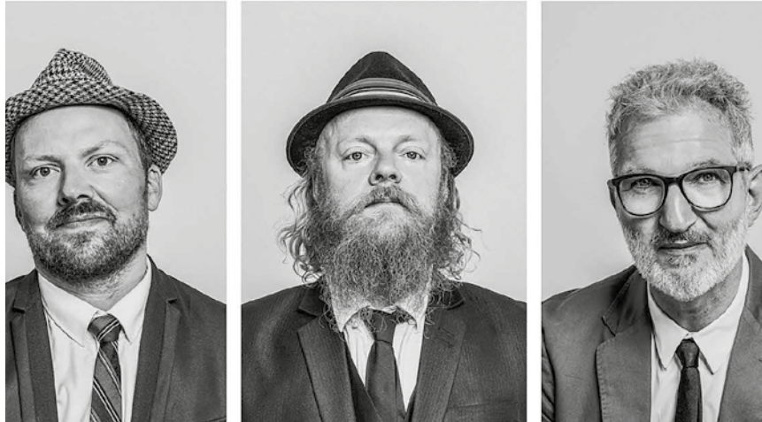
Swinghouse Orchestra-portrætter.