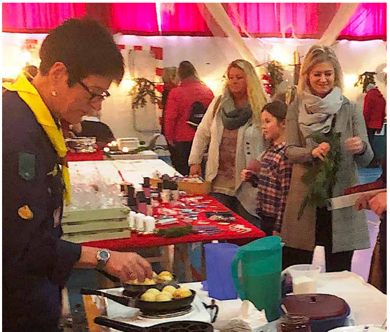
Helt fra Frederiksstad kom de for at smage spejdernes lækre æbleskiver.