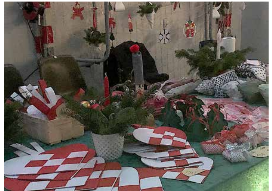
Hjemmelavet julepynt er indbegrebet af dansk juletradition.

Markedet har tidligere fortrinsvist været holdt på Husumhus, men bliver fremtidigt holdt på skift mellem Husum Danske Skole og Husumhus.