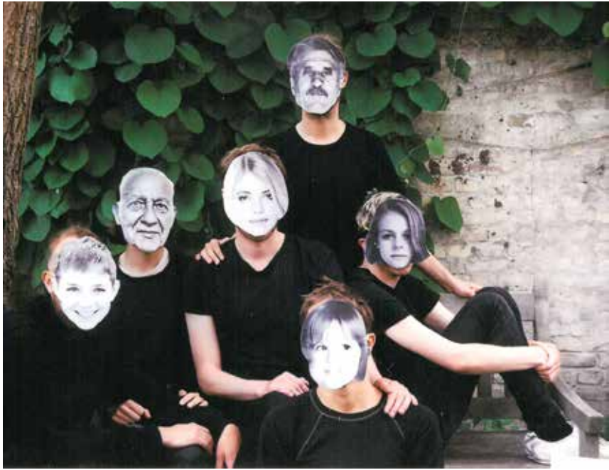
"Klimaforandringer", et band fra København, giver koncert i Flensborg 4. december.