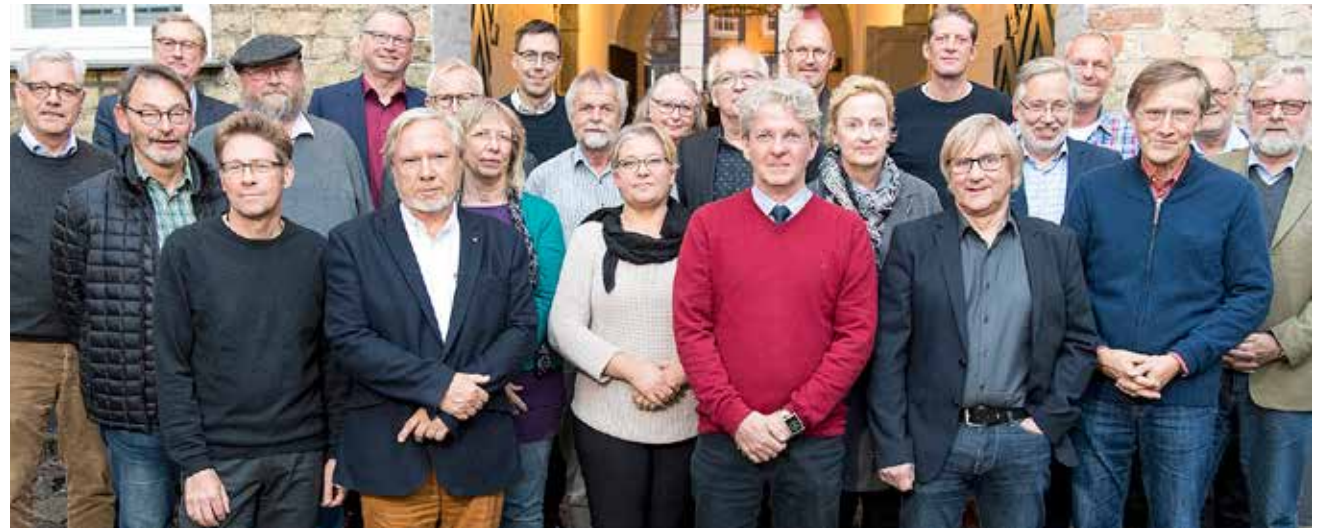
Det Sydslesvigske Samråd beder om, at de danske sydslesvigere bakker op om en juleaktion til fordel for syge børn i Sydslesvig og Sønderjylland.