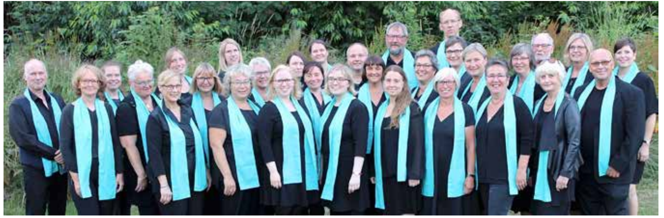
Northern Gospellights giver julekoncert i Slesvig og Flensborg.