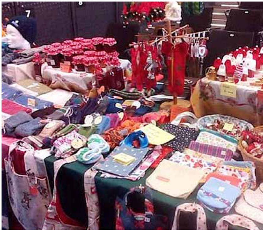
Stort udbud af alskens dekorationer venter – som her på billedet fra et tidligere Slesvighus-julemarked.