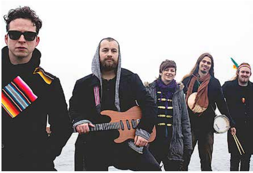
Los Fuegos kommer fra Mexico, Colombia, Bosnien og Danmark