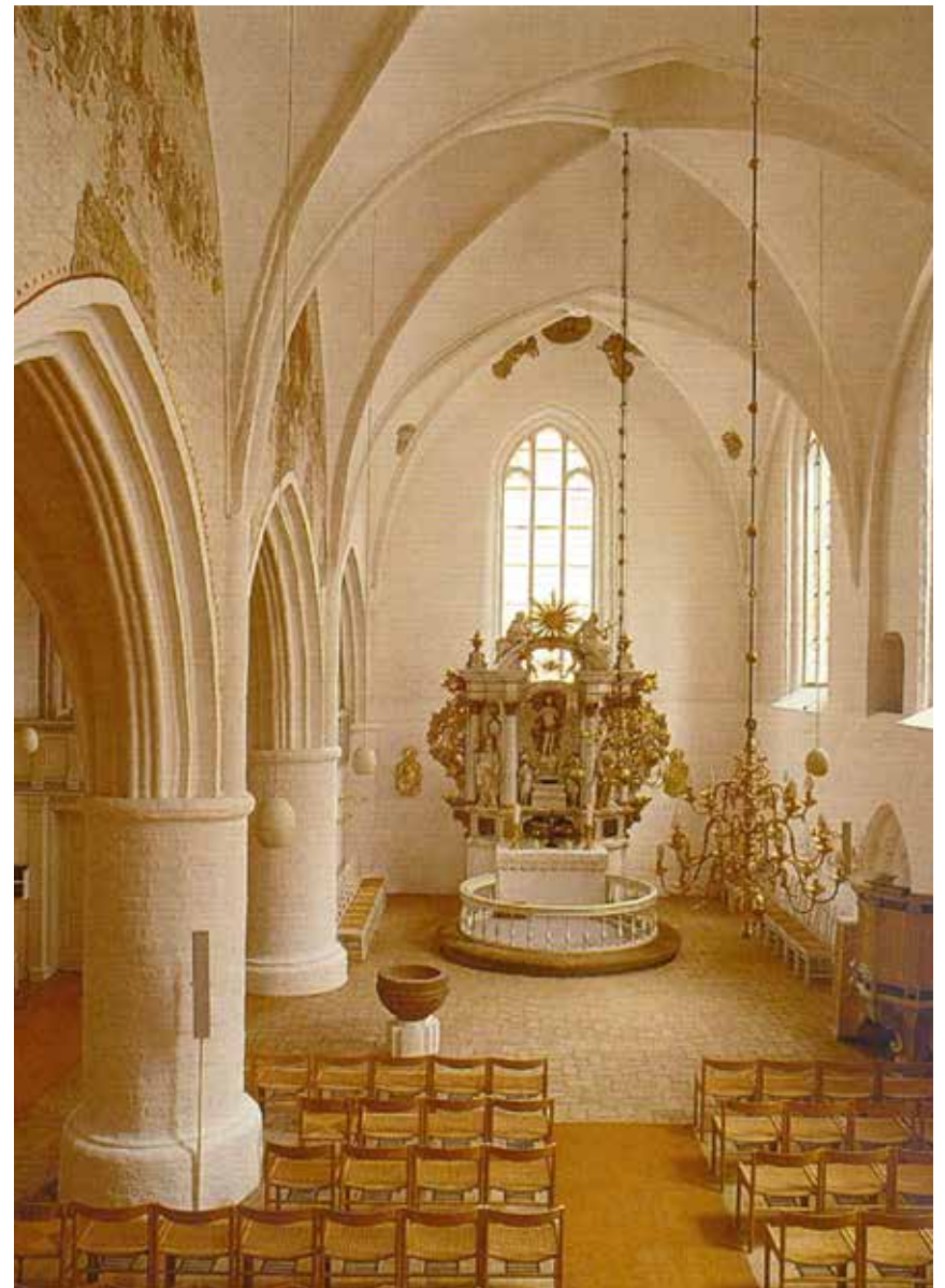
Helligåndskirken i Flensborg danner rammen om en række før-julekoncerter.