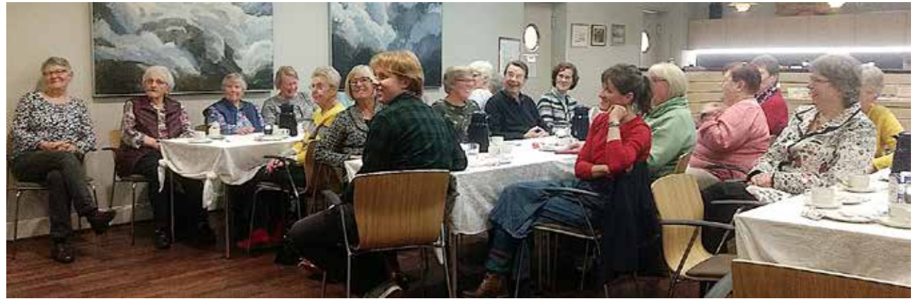
Der blev grinet og klappet – og sunget.