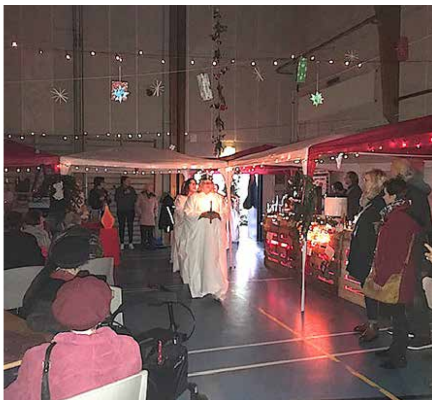
Luciaoptog i halvmørke.