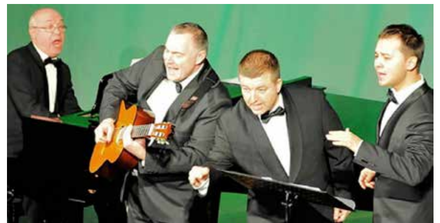
Russiske Peters Quartett synger sammen med deltagerne i julesang-arrangementet i Slesvig Roklub i aften.