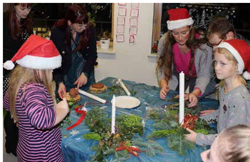
Der bliver udfoldet megen kreativitet med gran og lav og lys.

Marcipankonditoriet i HFO'en er altid et hit.