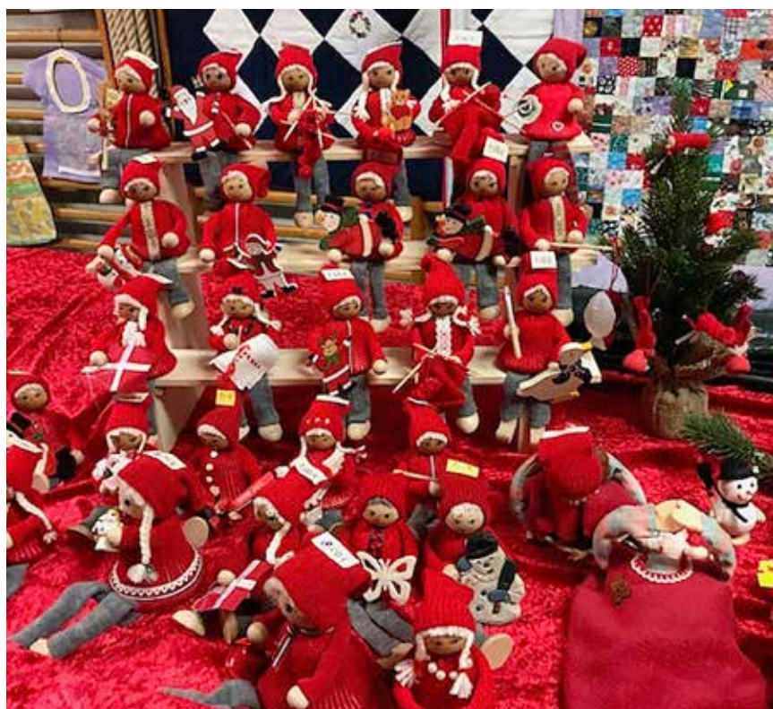
Masser af nisser.