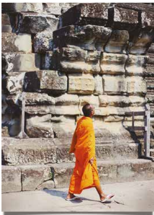
Buddhistisk munk i tempel i Nepal

Buddhismen har tre hovedretninger: Theravada-, Mahayana- og Vajrayana-Buddhisme. Derudover har buddhismen også tilpasset sig de samfund, hvor den er blevet hovedreligion, og derfor findes der mange slags buddhisme i dag. Alle buddhister er dog enige om troen på de tre juveler. Disse er Buddha (Gautama