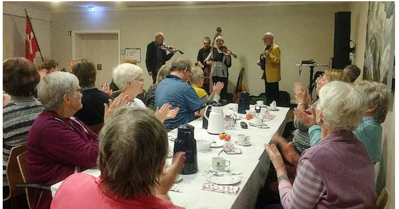
Spillemandsorkestret Kantüddel stod for underholdningen.