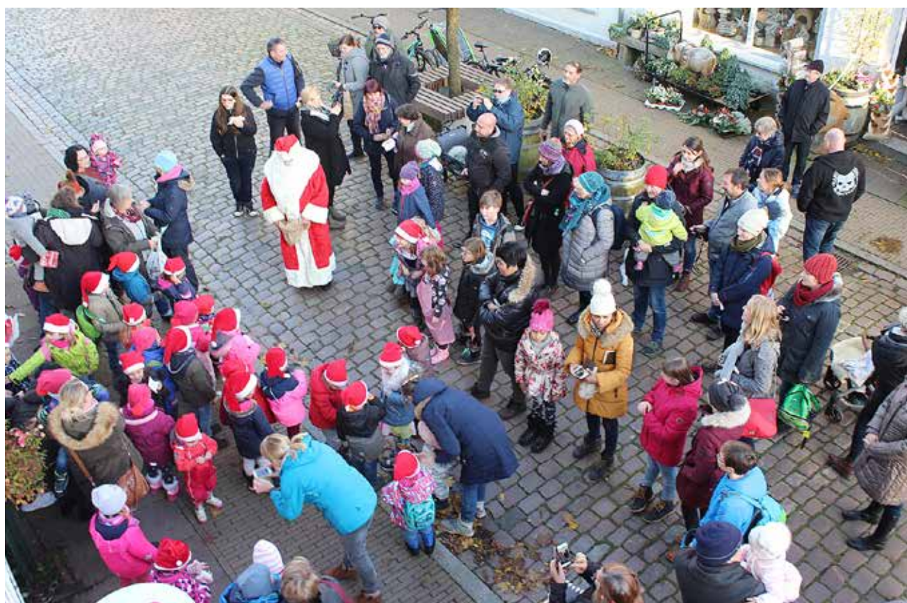
Børnenes sang udenfor Paludanushuset er altid basar-dagens højdepunkt.