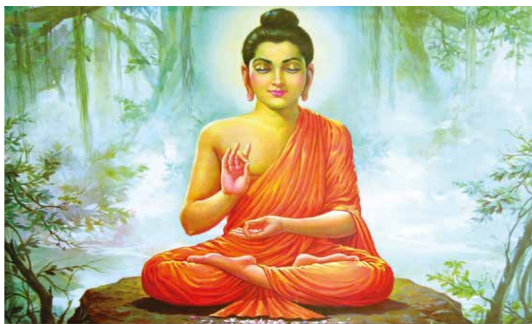
Den unge Siddharta i færd med at meditere i figentræets skygge

Historien om Buddha og buddhismen strækker sig næsten 2.500 år tilbage i tiden, og Buddhas borgerlige navn var Siddharta Gautama. Formentlig blev han født ca. 563 f. Kr. i Lumbini i det nuværende Nepal, og han var søn af kong Suddhodhana og dronning Maya. Hans forældre har måske været en smule overbeskyttende, for ifølge legenden stiftede Siddharta først i en alder af 29 år bekendtskab med verden uden for paladsets mure. Mødet med fattigdom, sygdom og død fik ham til at indse at det liv han hidtil havde levet, var en illusion, og livet var i virkeligheden fuldt af lidelse. Et møde med en munk fik Siddharta til at beslutte sig for at leve et strengt asketisk liv, og i seks år boede han i skoven, udførte bordsøvelser og spiste i perioder kun et enkelt riskorn om dagen. I den buddhistiske mytologi modstod han i denne periode angreb og fristelser fra Mara; det buddhistiske sidestykke til Djævelen.