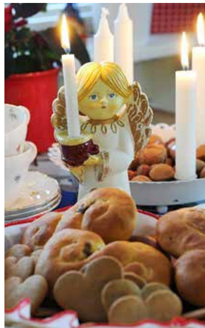
Luciadag på biblioteket.