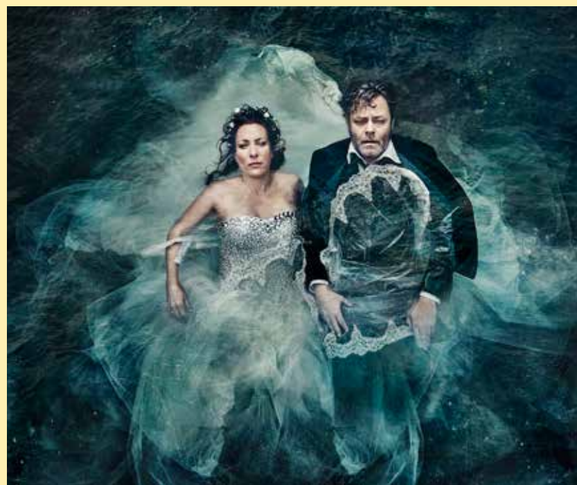
Scenefoto fra den absurde tragikomedie „Dæmoner“ – på lørdag på Flensborg Teater.

Arrangør: SSF. Billetter: www.ssf-billetten.de , tlf. 0461-14408125 - SSFs amtssekretariat - Aktivitetshuset - sh:z Ticketcenter - eller ved indgangen.