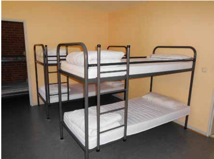
Her ser man tydeligt, hvilken forskel renoveringen har gjort: Sovemiljø i Skipperhusets annekset før...