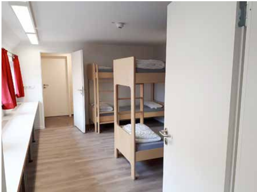
... og efter renoveringen.