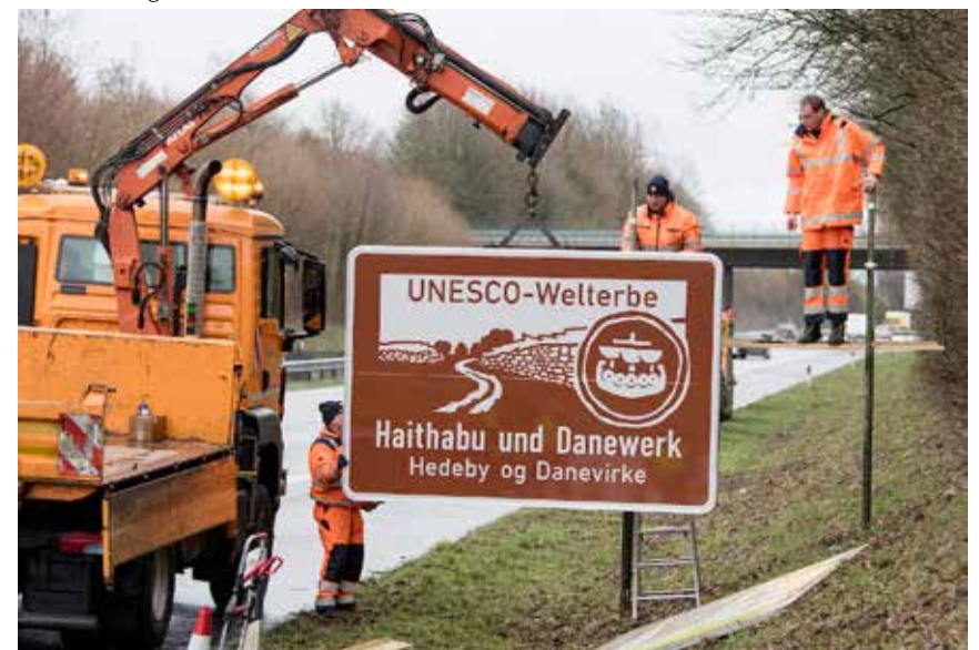
Det første af de nye skilte blev sat op i mandags.