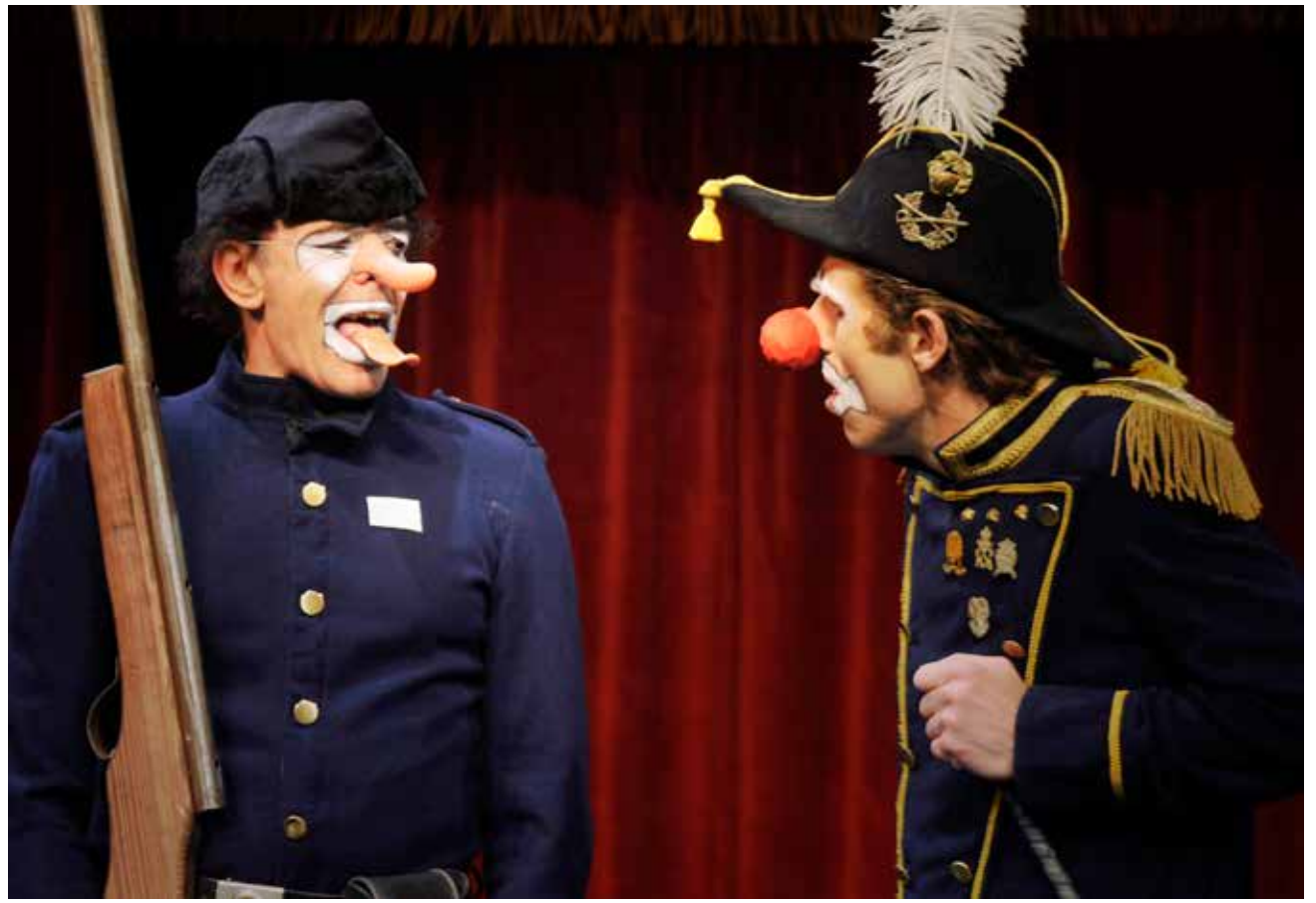
Kom i god tid, når Paolo Nani Teater næste uge torsdag kl. 15 spiller stykket »Kunsten at dø« på Flensborghus: Der er ingen pause i stykket, så der serveres kaffe og lidt sødt inden forestillingen.