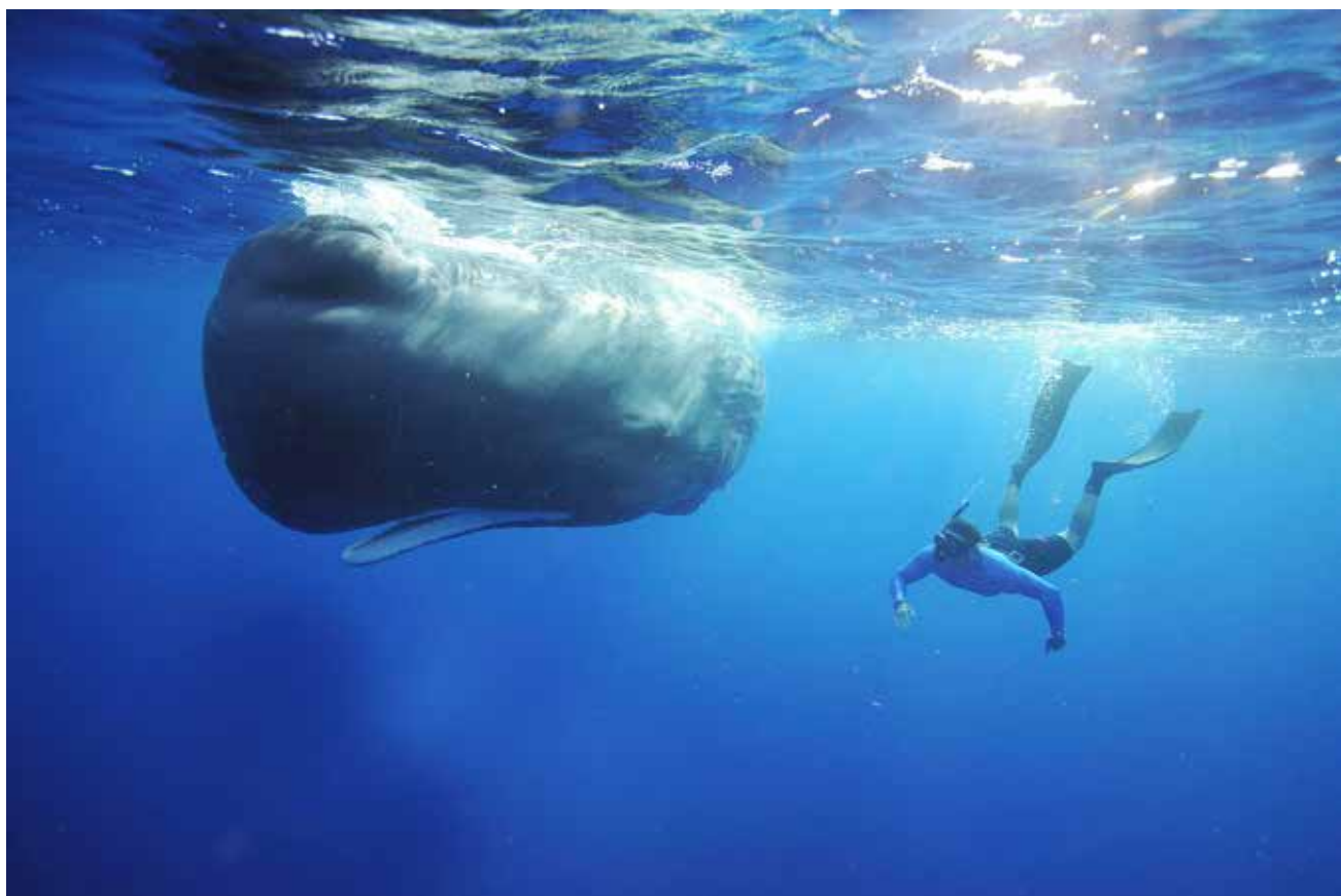
Ny teknologi har givet forskerne enestående muligheder for at studere hvalernes fysiologi og adfærd langt til havs.