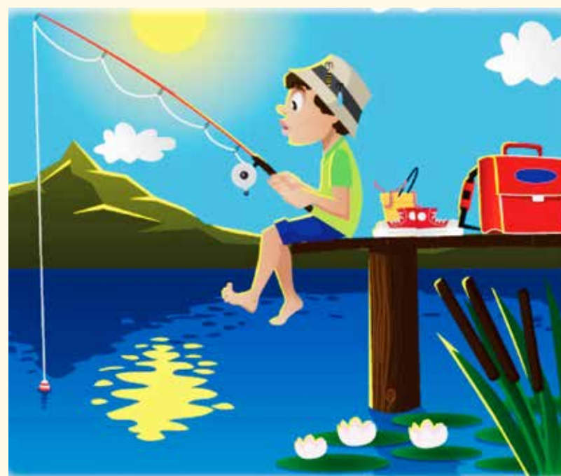
SSF Egernfælde indbyder de 6-12-årige morgenfriske til fiskekursus. (Ill.: SSF Egernfælde)