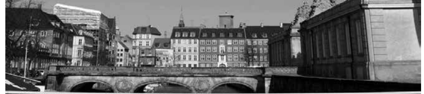
Højskolen er et kunstnerisk mødested med seks kreative linjer: Design, Arkitektur & Kunst, Forfatter, Dokumentarfilm, Teater & Scenekunst, Musik & Sangskrivning, samt en række spændende valgfag.

DOKUMENTARFILM / TEATER & SCENEKUNST / JOURNALIST & FORFATTER / MUSIK / DESIGN / ARKITEKTUR & KUNST / URBAN MOVEMENT /