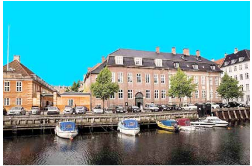
Johan Borups Højskole ligger ved Frederiksholms Kanal nær Christiansborg.

DOKUMENTARFILM / TEATER & SCENEKUNST / JOURNALIST & FORFATTER / MUSIK / DESIGN / ARKITEKTUR & KUNST / URBAN MOVEMENT /