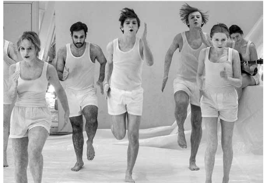
Eleverne er typisk mellem 18-30 år og kommer fra hele Norden.