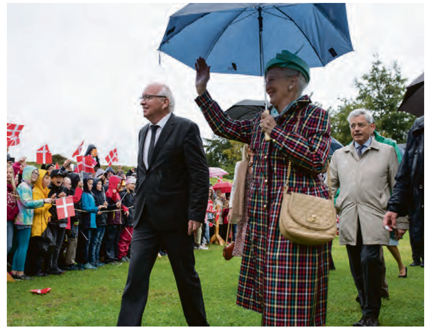
Over 1000 børn fra de danske skoler på østkysten i over 20 busser og en hel del voksne havde taget turen til Danevirke og det våde ophold der for at opleve et historisk moment: hilse på Dronningen.