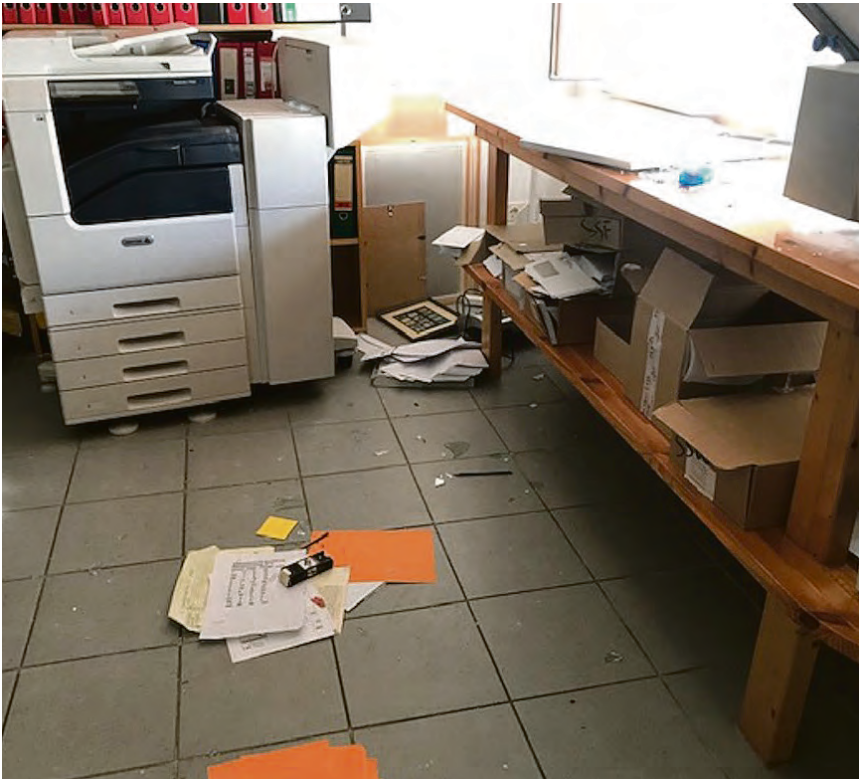
Om maskinerne skal skiftes ud med nyt grej, er endnu ikke helt gjort op.