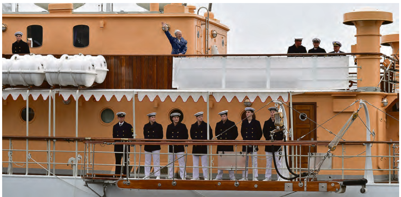
Majestæten viste sig på øverste dæk og vinkede farvel, mens Kongeskibet blev ledsaget ud af havnen af talrige sejlere.