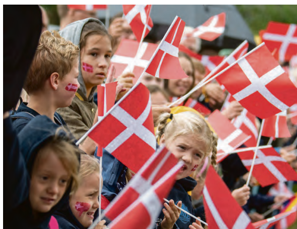
Forventningsfulde børn med flag overalt – trodsende vind og vejr.