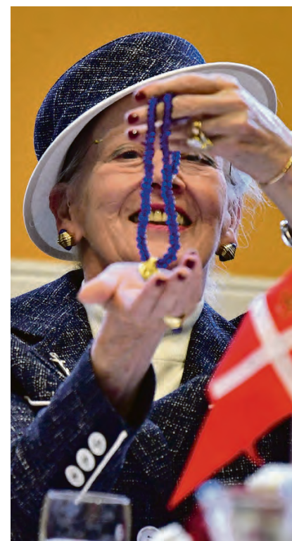
En glad majestæt og gaven, hun lige havde fået, en kopi af et fund, et smykke, hun dagen forinden havde set originalen af på Danevirke.