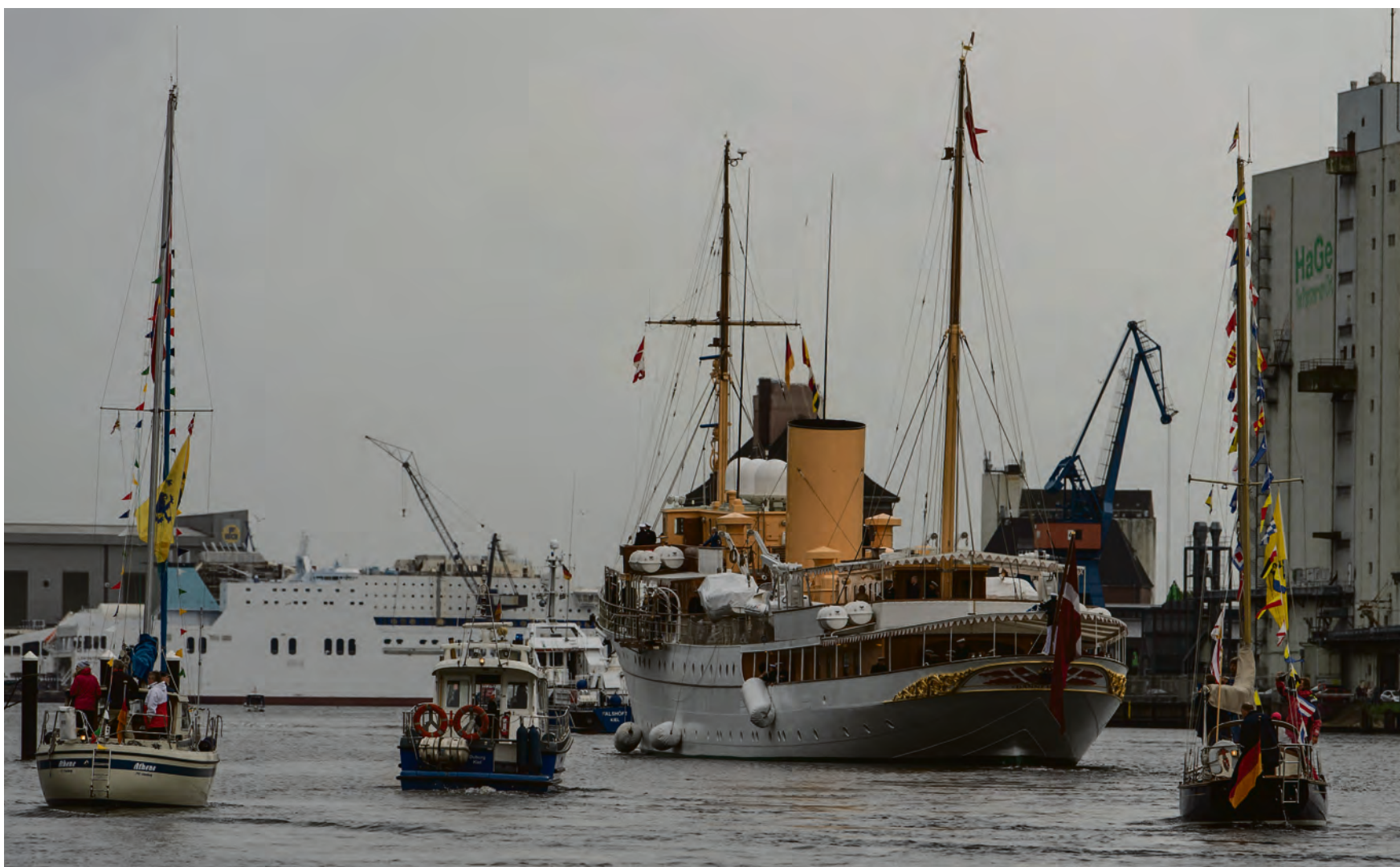
Dronningen stod længe på øverste dæk, efter at Dannebrog havde lagt fra kaj – nok et udtryk for, hvor meget besøget hos det danske mindretal og i delstaten Slesvig-Holsten 3.-6. september betød for hende.

Flere tusinde mennesker var mødt op på Flensborg havn i fredags for at se Dronningen forlade Sydslesvig igen med kongeskibet Dannebrog. Et stort kor bestående af danske kor og sanggrupper fra området sang for Margrethe, der blev stående ved rælingen for at lytte til »Hvor smiler fager den danske kyst«. Mens flere og flere ved kajen faldt ind i de følgende sange - SSF havde uddelt sangblade - gled Dannebrog langsomt fra kaj.