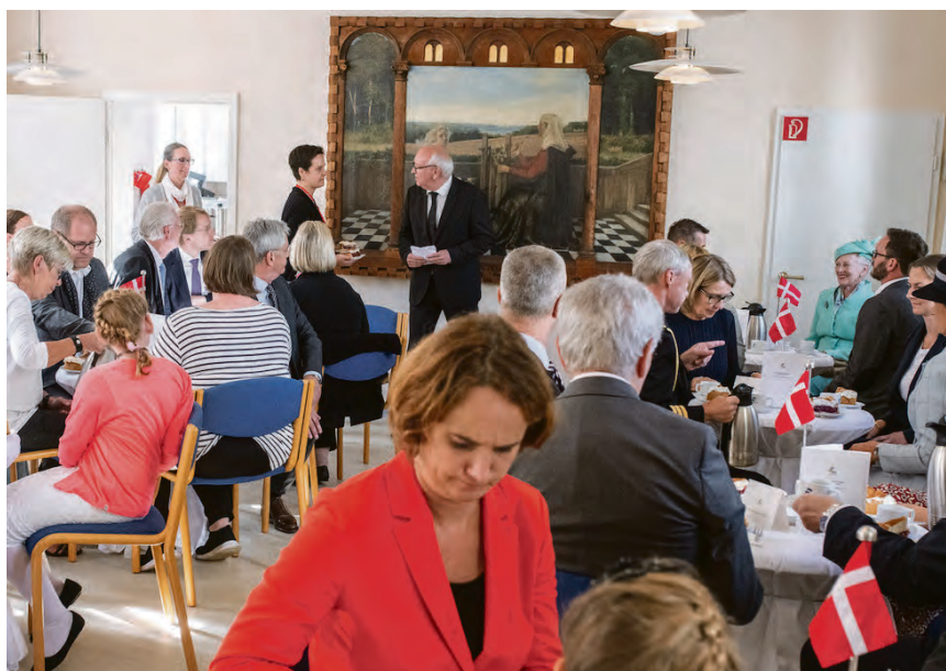
Hendes Majestæt er budt til bords i Panludanushuset i Frederiksstad som SSFs og de andre danske organisationers og institutioners gæst.