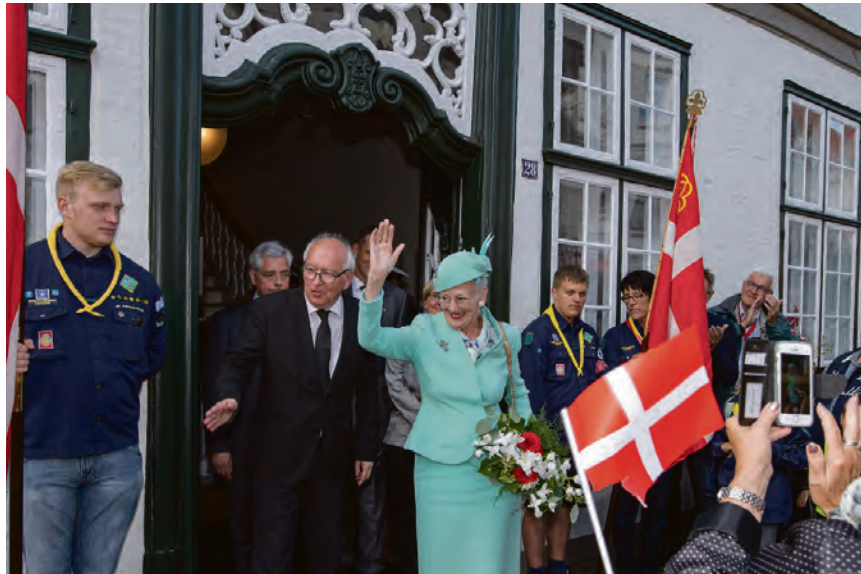
Margrethe II. havde nydt samværet med de danske over en kop kaffe i Paludanushuset og forlod siden SSFs forsamlingshus flankeret af spejdere og SSFs og SSF Husum amts ledelse.