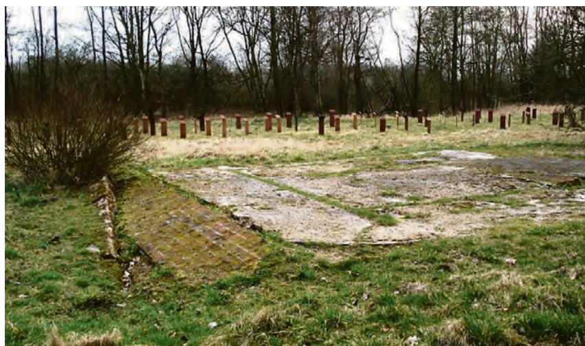
Fundamentrester og mindesteler på mindstedet for koncentrationslejren Svesing.