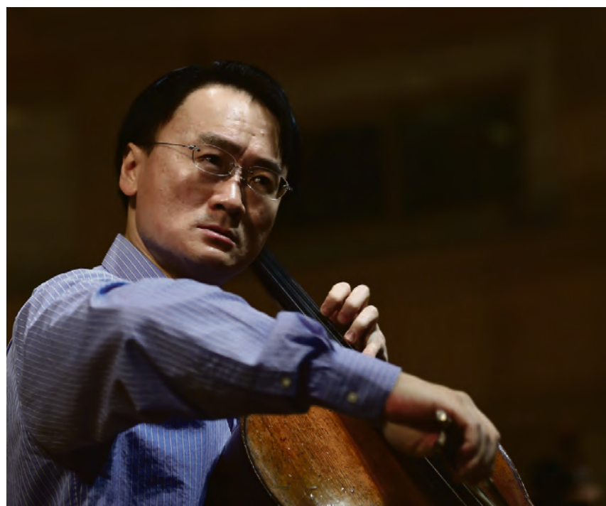
Celloslisten Jian Wang.