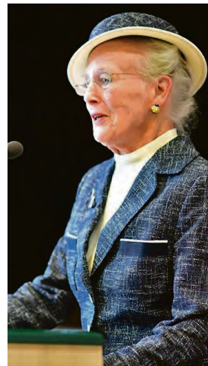
En rørt Majestæt takker for fire dages oplevelser bl.a. med ordene "I er så sandelig ikke glemt".