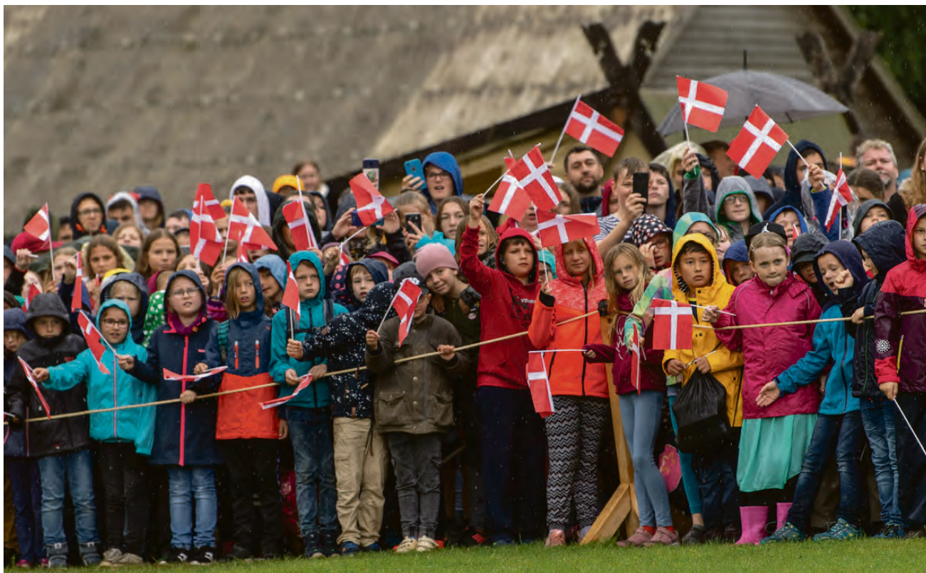
Våde men glade: Skolebørn fra hele østkysten til dronningebesøg på Danevirke.