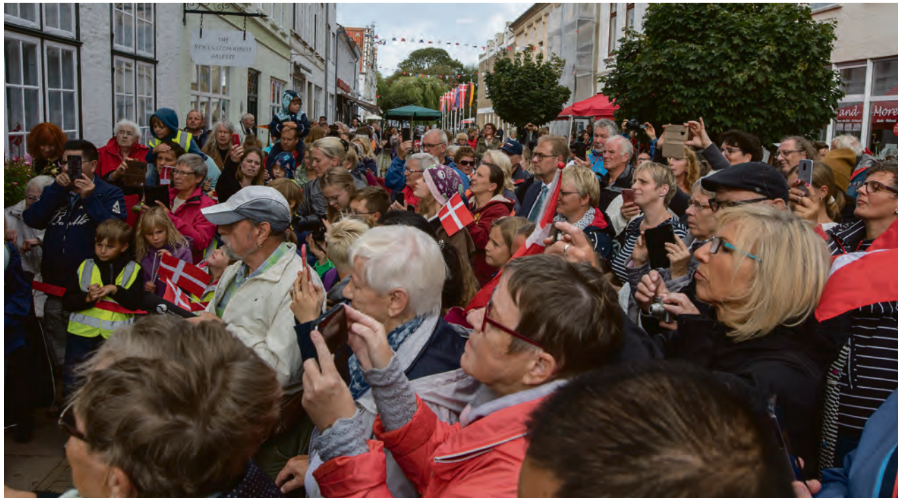
Alle ville have et glimt af den høje gæst fra Danmark