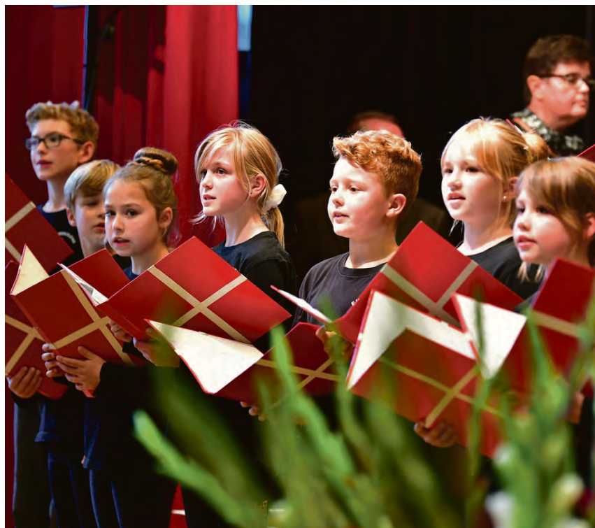
For underholdningen den eftermiddag på Flensborghus stod bl.a. Ejderskolens Kor fra Rendsborg.