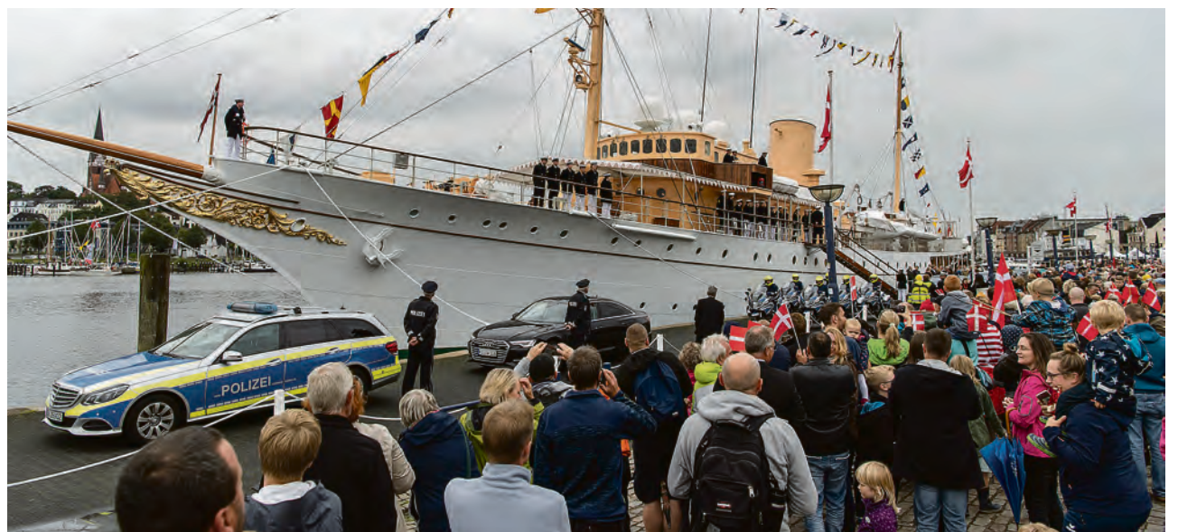
Flere tusinde var kommet for at takke Dronningen for besøget.