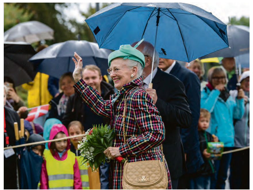
De fik et stort dronningesmil som tak.