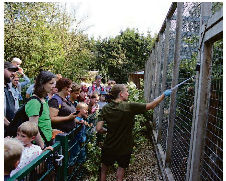
Det her er ingen abekat, men en kat. En los. Den kunne få lyst til endnu mere frisk kød, så her fodres med pincet og på behørig afstand.