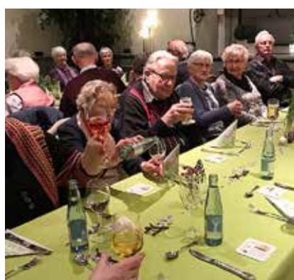
Seniørerne hyggede sig på en restaurant i Flensborg.