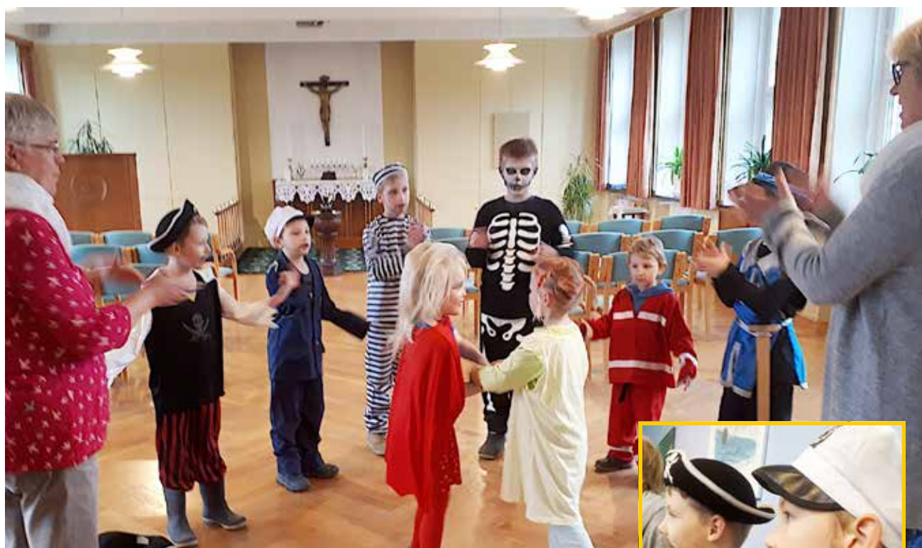
Der var sang og dans efter gudstjenesten.