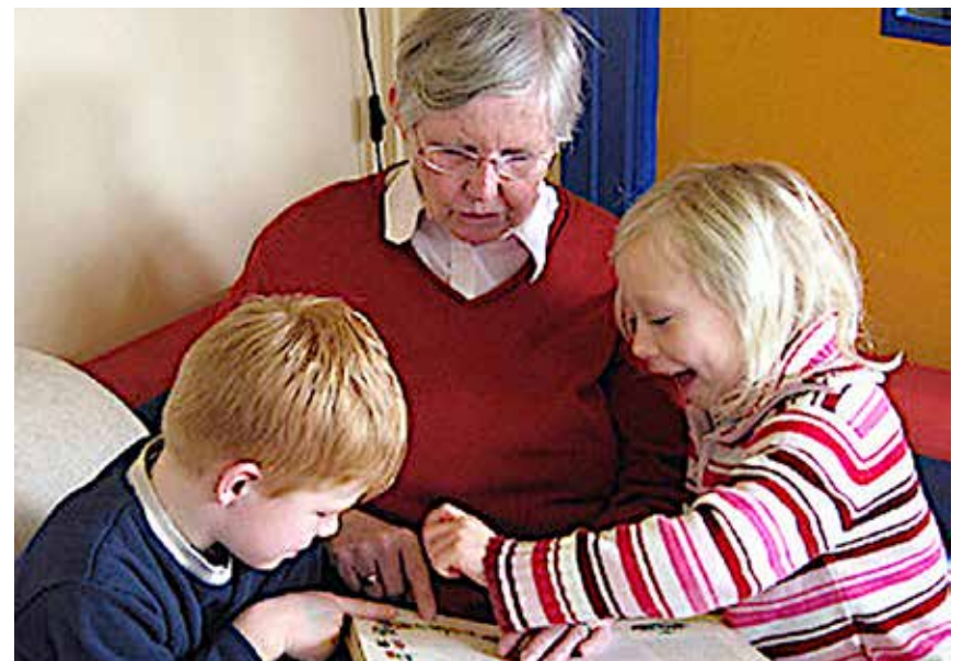
Kirsten var elsket af alle – såvel børn som ældre.

Tilmelding senest 20. marts hos m.mannes@me.com eller 0174 9316 033.