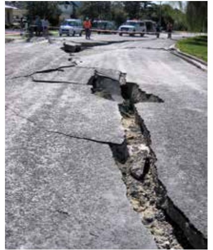
Jordskælv er som regel ret så voldsomme. (Arkivfoto)