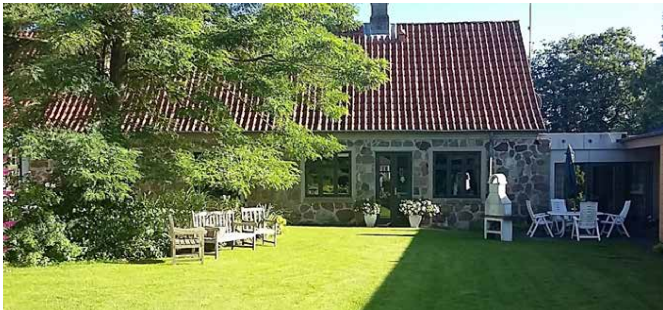
Hvile- og rekreationshjemmet Bennetgaard er klar til en ny sæson med ældre fra Sydslesvig. (Arkivfoto)