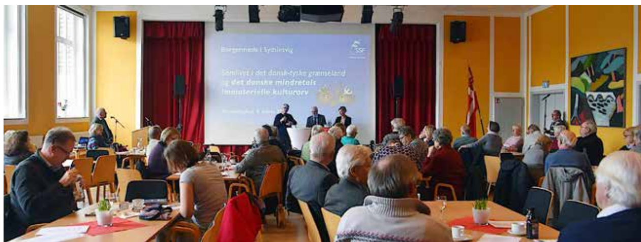
Borgermødet på Flensborghus i lørdags var velbesøgt - men uden unge.