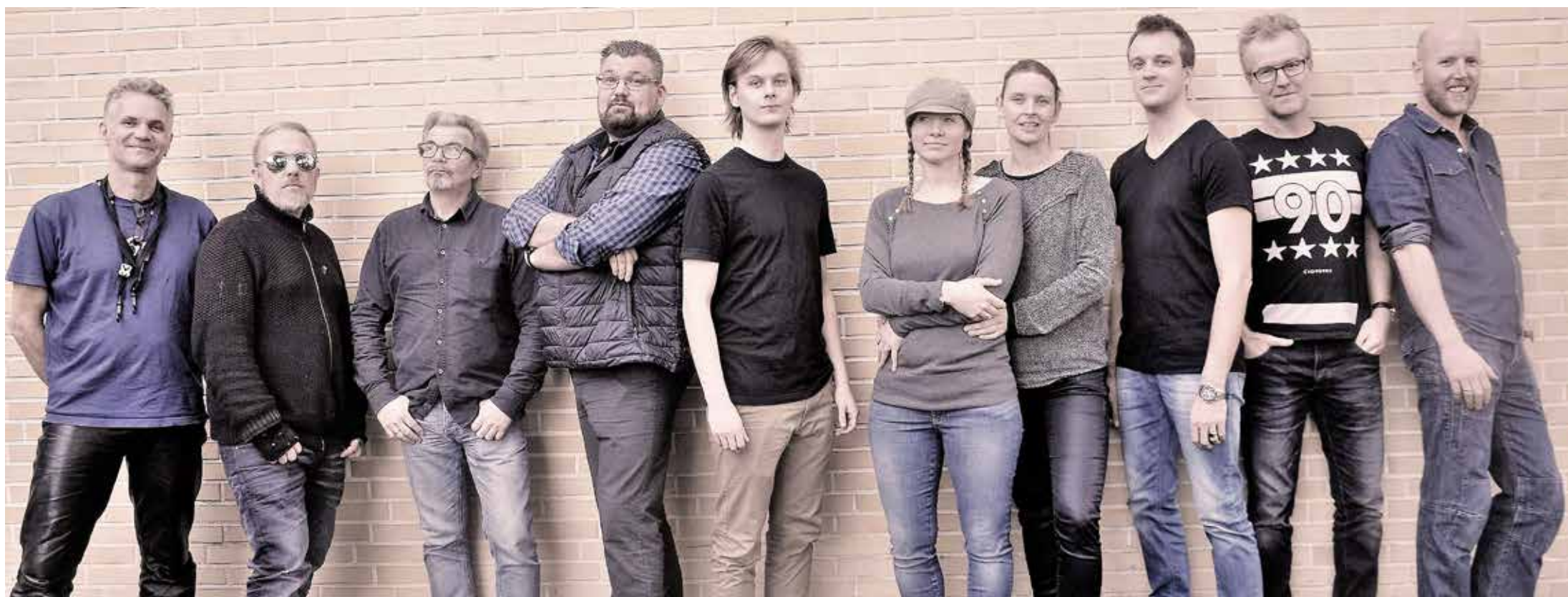
10 musikere på scenen: 22. marts på Flensborghus.