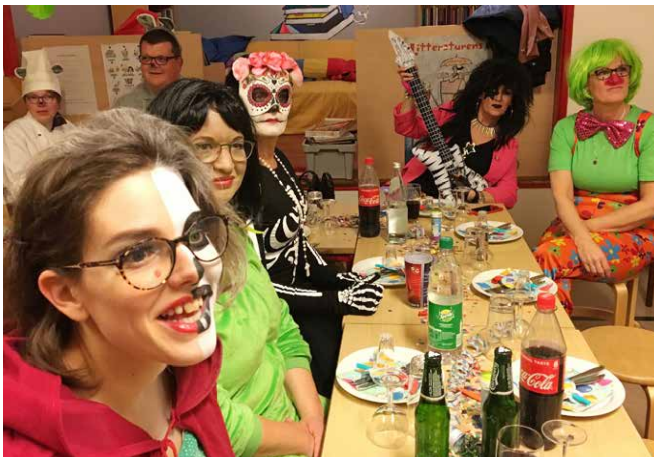
Festligt stemte fastelavns-voksne.