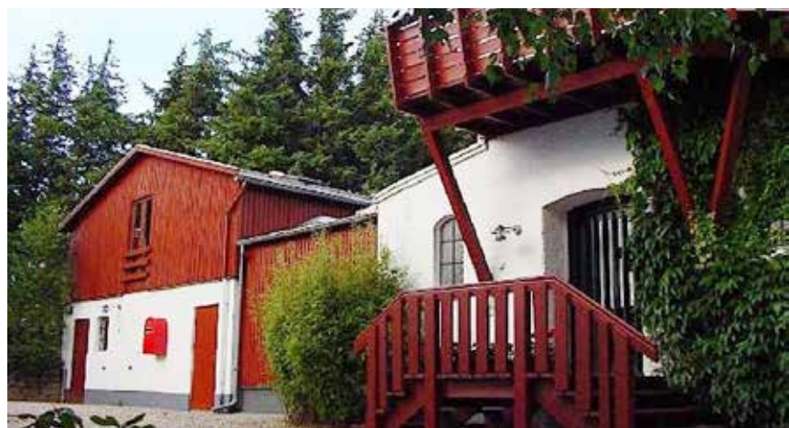
Mikkelberg i Hatsted søger en leder.