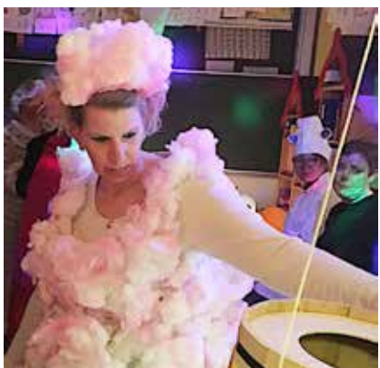
Mon jeg kan klare den....?