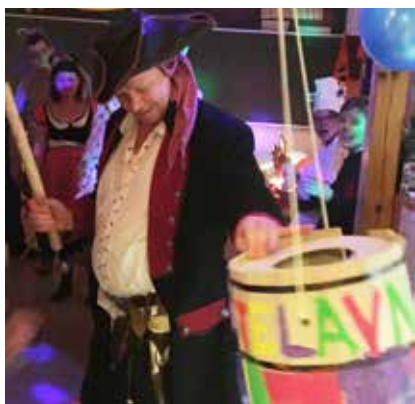
Man kan da prøve...