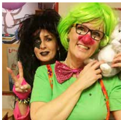
Smil til fotografen...