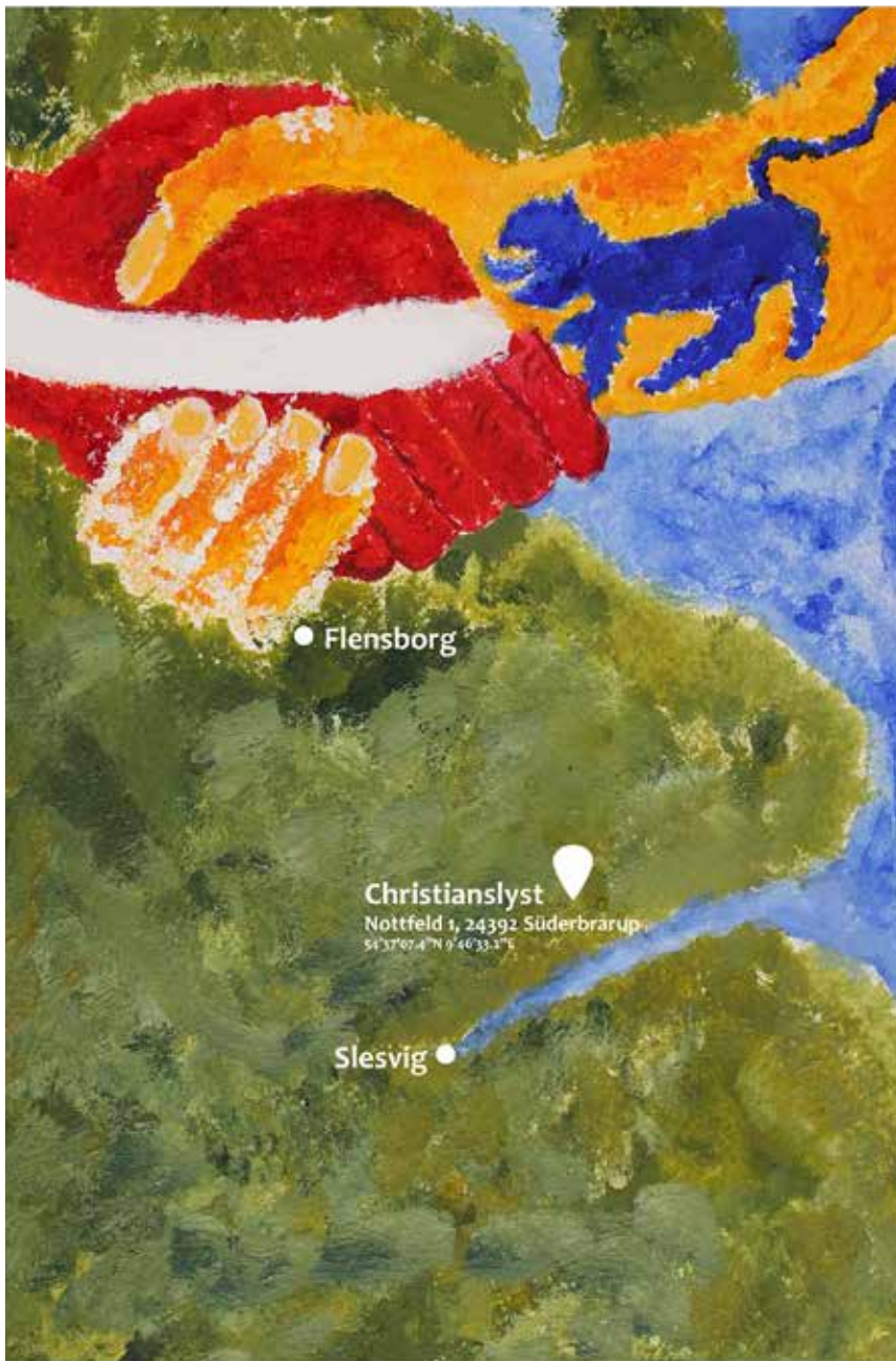
Plakaten er tegnet af 5. klasses elever fra Balle Billedskole.