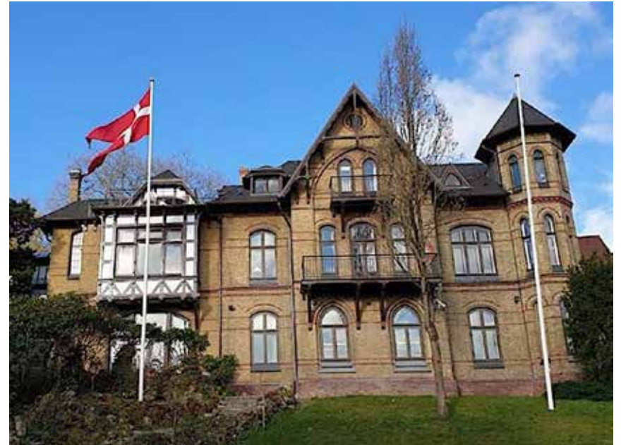
Studieturen afsluttes på Dansk Generalkonsulat i Flensburg.