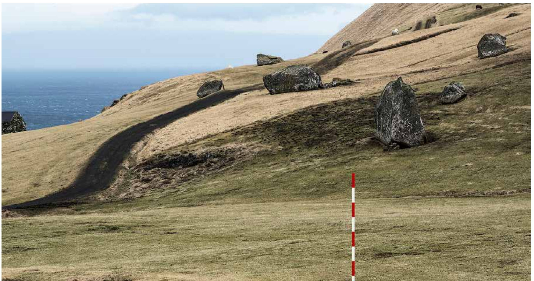
Ein färöisches Landschaftsmotiv.