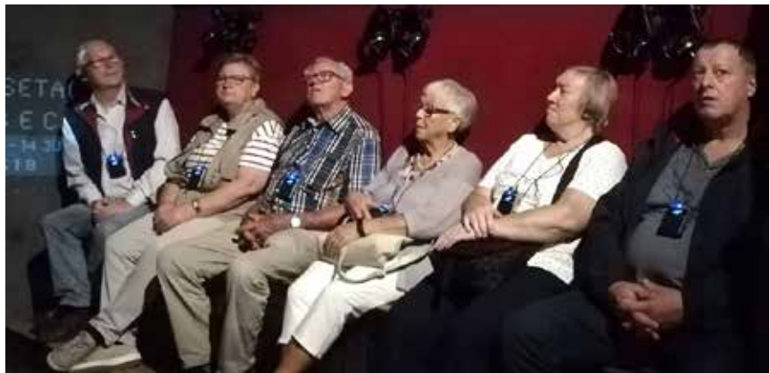
Nogle af deltagerne.