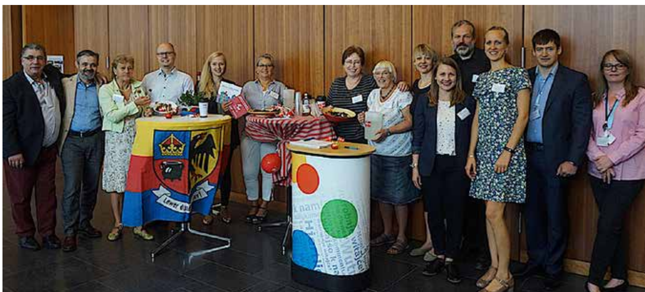
VertreterInnen der nationalen Minderheiten, der AGDM und der niederdeutschen Sprachgruppe letztes Jahr.