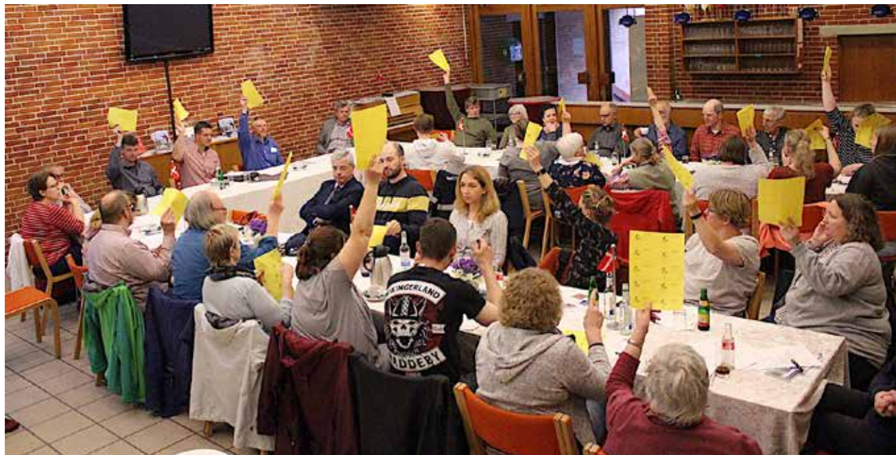
Beretningen blev enstemmigt godkendt, og alle valg var enstemmige.