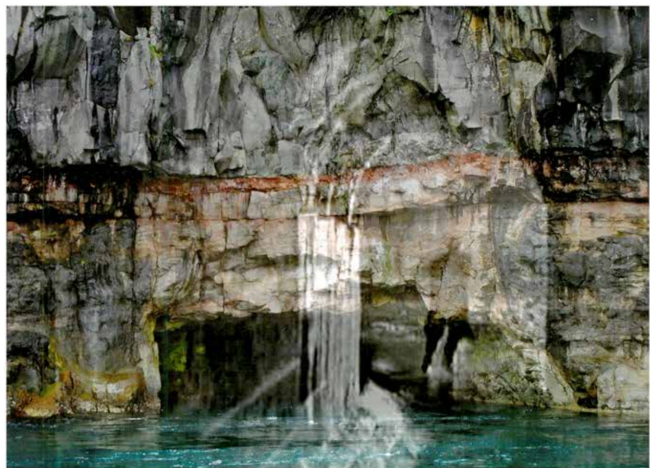
Viggo Böhrnsen-Jensen deltager med bl.a. dette klippemotiv fra serien "Borealis".