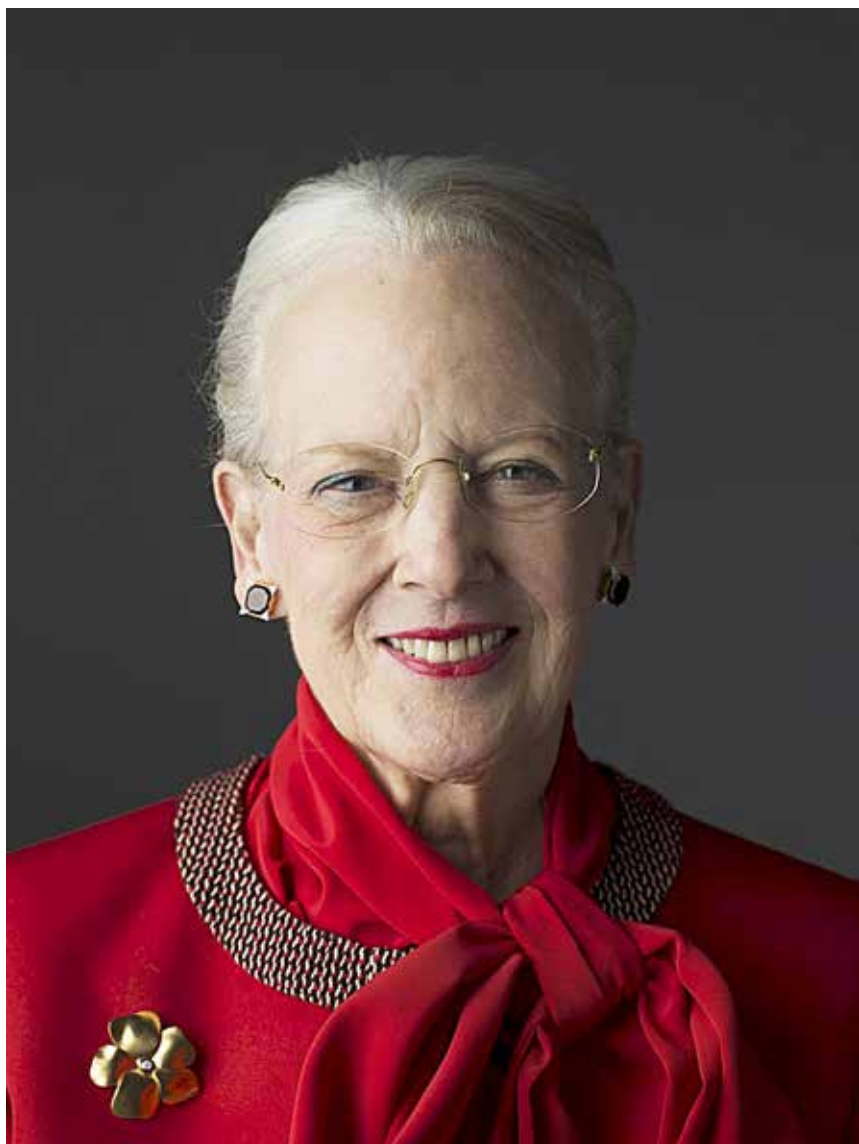
Dronningen besøger mindretallet i september.