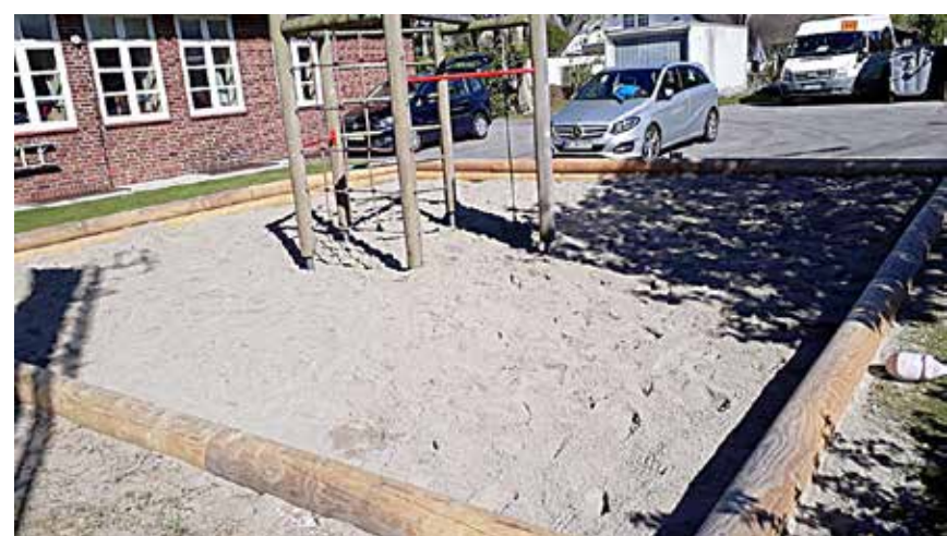
Nu er sandkassen fin, trods børnehaver-forældrenes (med få undtagelser) manglende indsats.