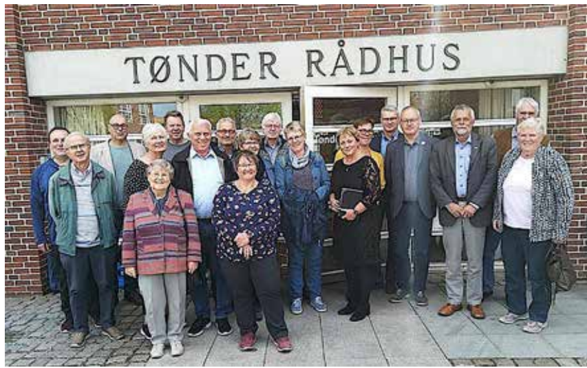
SSW'ere på studietur sammen med deres værter foran Tønder rådhus.