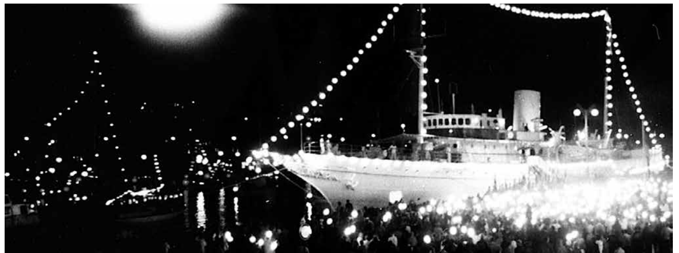
Det er nogle år siden, Kongeskibet Dannebrog lagde til ved kajen i Flensborg. Det var i 1978. Godt 40 år senere sker det igen, i september i år.