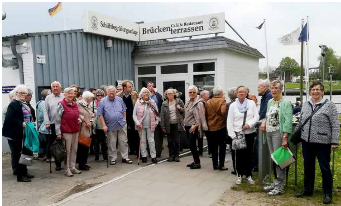
Flensborgerne ved welcome-point'et ved Kielerkanalen.