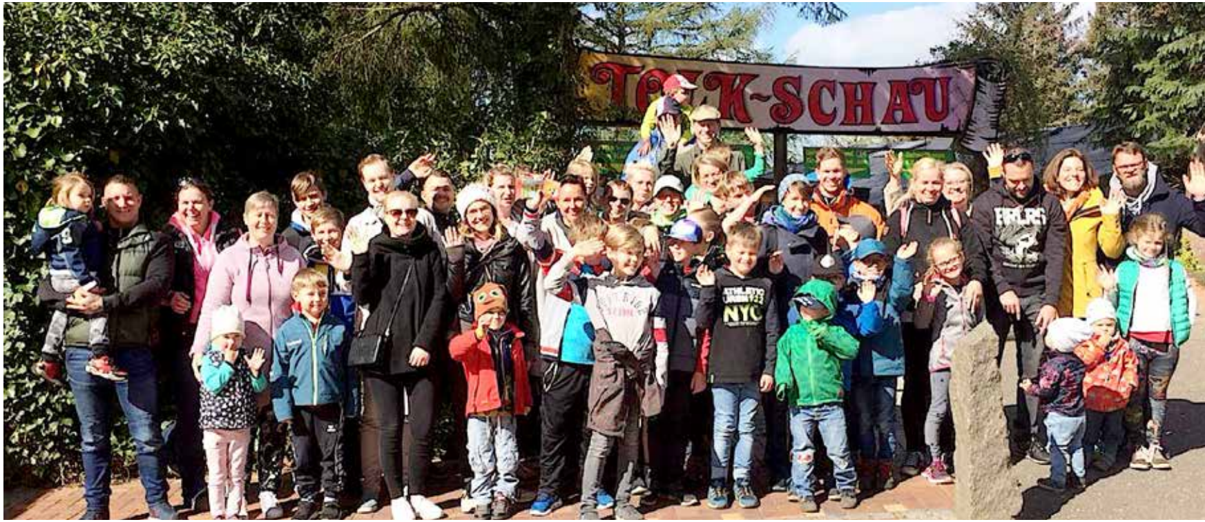
51 store og små deltog i SSF Hohn Herreds tur til Tolk.