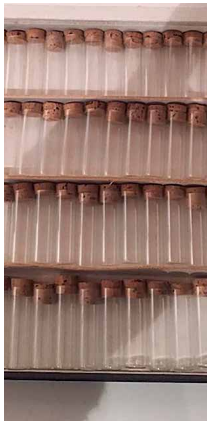
Sådanne reagensglaslignende beholdere bliver jordprøverne opbevaret i.