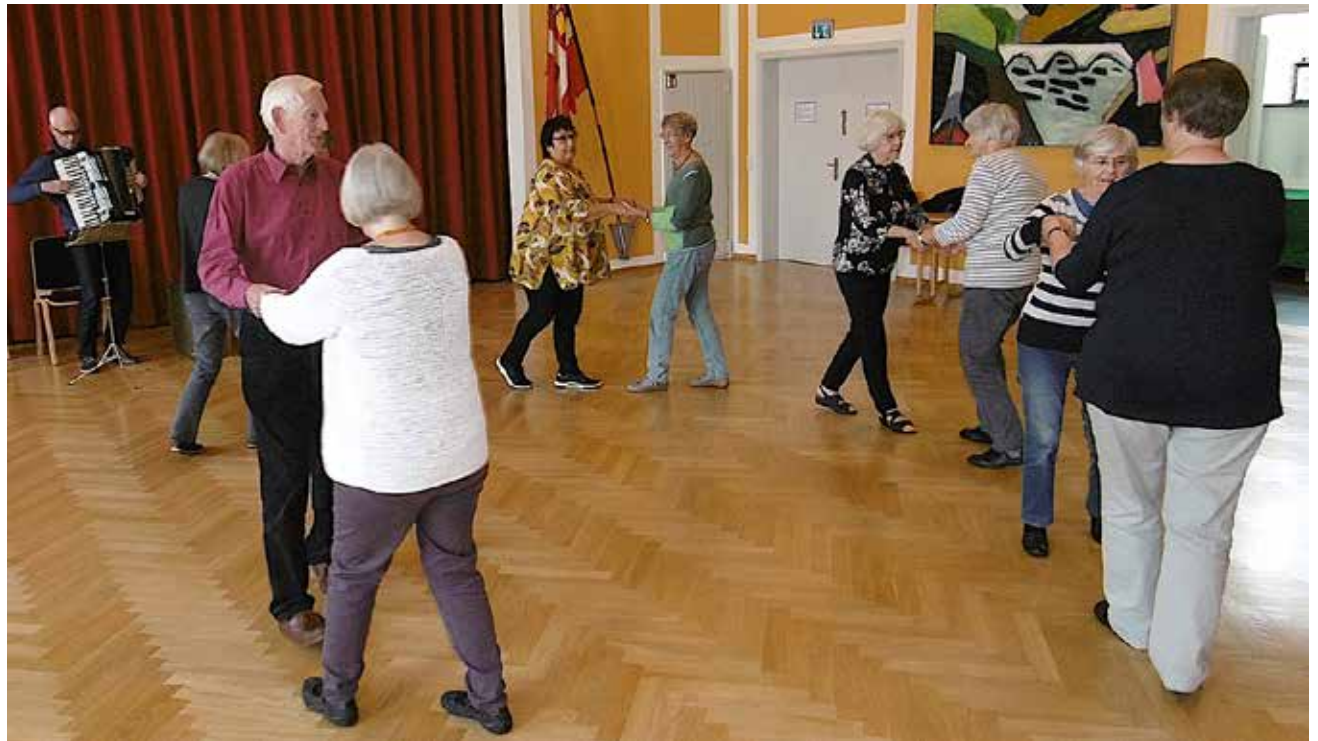
De er altid omkring de 10, der svinger folkedanser-benene som senior-motionister.